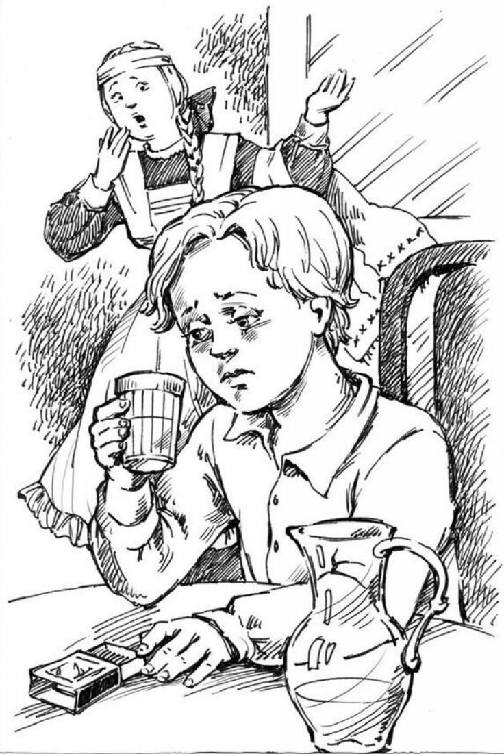
– Артемий Николаевич, что вы делаете?! – закричала Таня не своим голосом.

У Тёмы мелькнула только одна мысль, чтобы Таня не успела вырвать стакан. Судорожным, мгновенным движением он опрокинул содержимое в рот... Он остановился с широко раскрытыми, безумными от ужаса глазами.