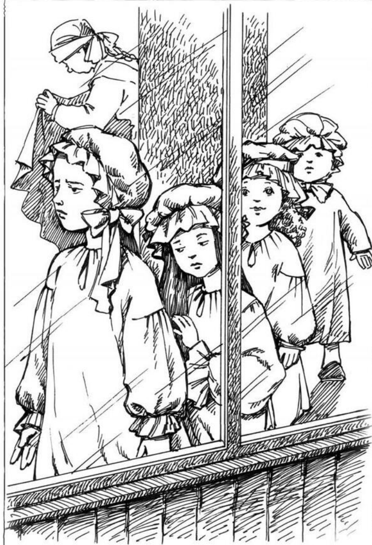
Через двадцать минут дети, уже в белых чепчиках, гуськом возвращаются назад в детскую.

Вот Маня – ясное майское утро, готовая всех согреть, осветить своими блестящими глазками.