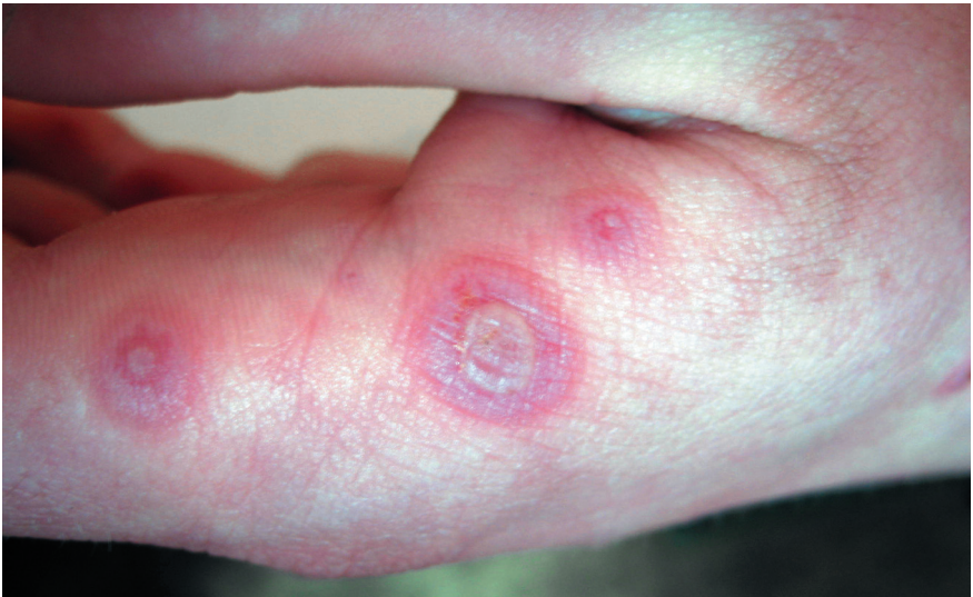
Рис. 8.1. Многоформная экссудативная эритема. Поражение кожи кисти

Тяжелая форма многоформной экссудативной эритемы — синдром Стивенса–Джонсона . Процесс начинается внезапно с повышения тем-