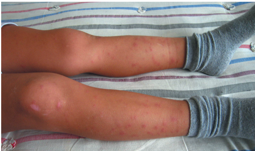
Рис. 8.4. Острая узловатая эритема. Многочисленные мелкие подкожные узлы

Хроническая узловатая эритема характеризуется рецидивирующим течением с обострениями в холодное время года. Возникает преимуще-