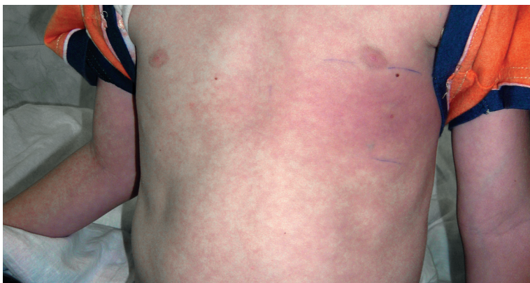
Рис. 8.7. Боррелиоз. Эритема

судорожный синдром, нарушение сознания) и поражения опорно-двигательного аппарата (артралгии, артриты).