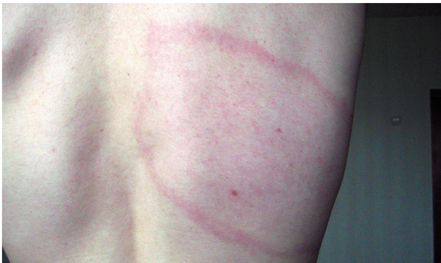
Рис. 8.6. Боррелиоз