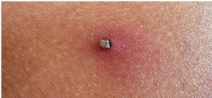
Рис. 8.5. Боррелиоз. Укус клеща

Возбудитель болезни в природных очагах циркулирует по схеме: клещи ↔ инфицированные животные. Клещи заражаются при кровососании инфицированных животных и в свою очередь заражают здоровых животных. Около 20–60% иксодовых клещей имеют возбудителей боррелиоза. Заражение происходит при укусе иксодового клеща, чаще всего во время прогулки по лесу. Реже клещ попадает на кожу человека с шерсти собак или одежды. Отмечают четкую сезонность заболевания: весна и лето.