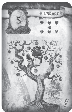
Рис. 12. Карта Дерево

(фран. Le Jeu De Change ), в качестве сюжета для изображений на картах используются темы французской и американской революций. Она будет издана не только в виде бумажной колоды, но и как приложение для iPad , что выведет карты Ленорман на абсолютно новый современный уровень 1 .