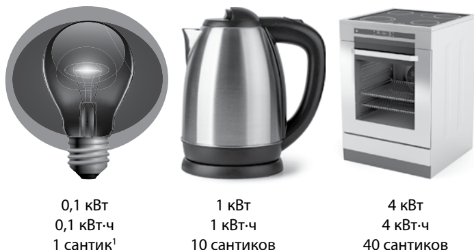
Рис. 2. Измерение энергии в финансовом выражении

представляют собой количественное представление одной и той же физической величины — энергии. Следовательно, джоули можно выразить через киловатт-часы, и наоборот. Посчитаем, сколько джоулей в киловатт-часе. Запишем 1 кВт·ч таким образом, учитывая, что в одном часу 3600 секунд: