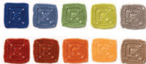
Палитры 3 и 4: Сочетание основных цветов с аналогичными и нейтральными цветами выглядит мягче