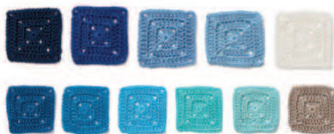
Палитры 5 и 6: Сочетание основных цветов с их различными оттенками создает привлекательный эффект