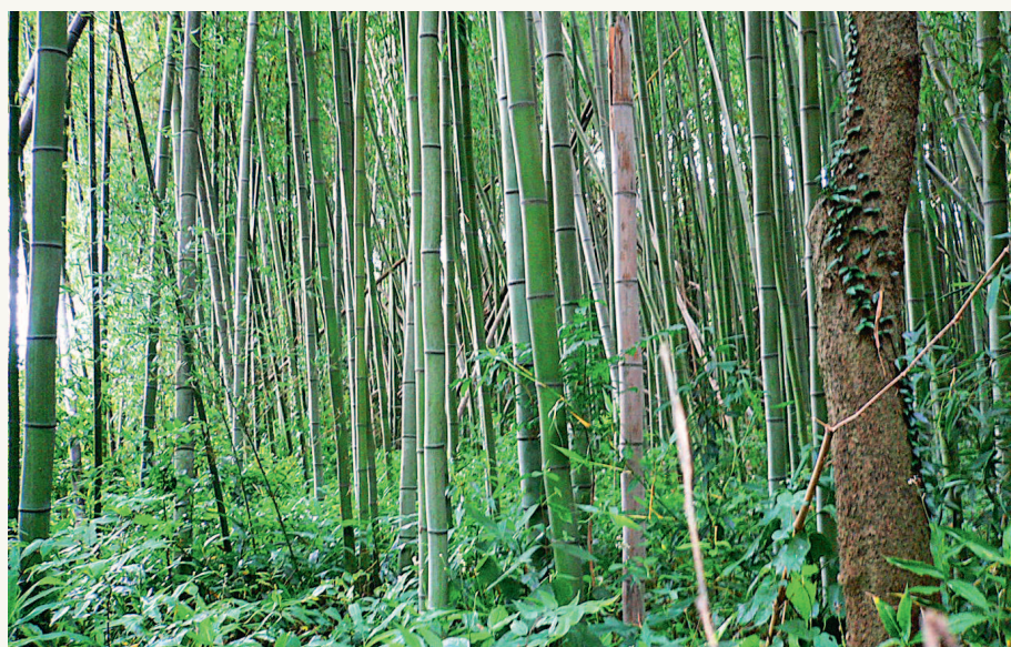
▲ Иногда путь преграждают вот такие сплошные бамбуковые заросли!