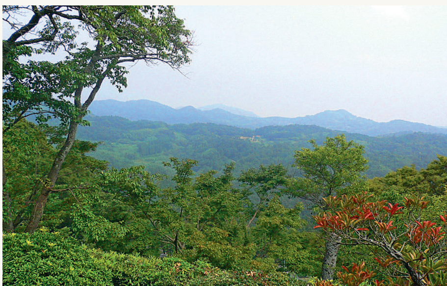
▲ Япония — это страна гор, заросших густым, труднопроходимым лесом и...

В конце книги имеется глоссарий, в котором раскрываются понятия, имеющие отношение к наступательному и защитному вооружению японских воинов и который дополняет сделанные в тексте объяснения. Сопутствующие термины, связанные с бытовой стороной японской культуры, в нём не приводятся, так как разъясняются в тексте. 終わり