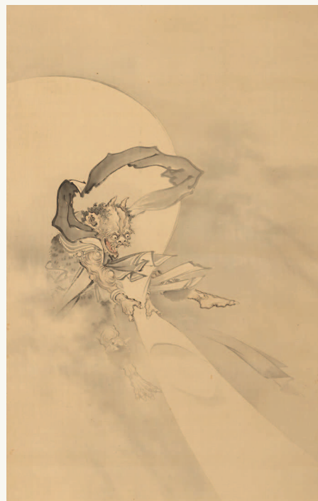
▼ Бог стихий Сусаноо. Картина художника Кобаяси Эйтаку. Музей Артура М. Саклера (Музей искусств Гарвардского университета), Кембридж, штат Массачусетс, США

вернуть её, но это оказалось невозможно, поскольку богиня уже вкусила пищи с очага Страны тьмы и потому она навсегда осталась под землёй. Покинув мрачное царство, Идзанаги совершил очистительное омовение и уже без помощи супруги породил трёх детей, ставших главными японскими божествами. Так из воды, омывшей его левый глаз, возникла богиня солнца Аматэрасу, правый — бог Цукиёми, а из воды, омывшей нос, — бог Сусаноо. Самая старшая из детей, Аматэрасу, получила во владение Равнину Высокого Неба и стала богиней Солнца. Порывистому Сусаноо, богу стихий, бурь и вод, досталось море, а Цукиёми стал богом Луны. Отметим, Аматэрасу Омиками («Великая, священная богиня, сияющая на небе») стала не только главной богиней японцев,