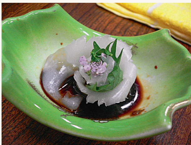
◀ Для Японии всегда были характерны простота и изысканность абсолютно во всём, даже в еде у японцев всё было очень просто, но красиво!