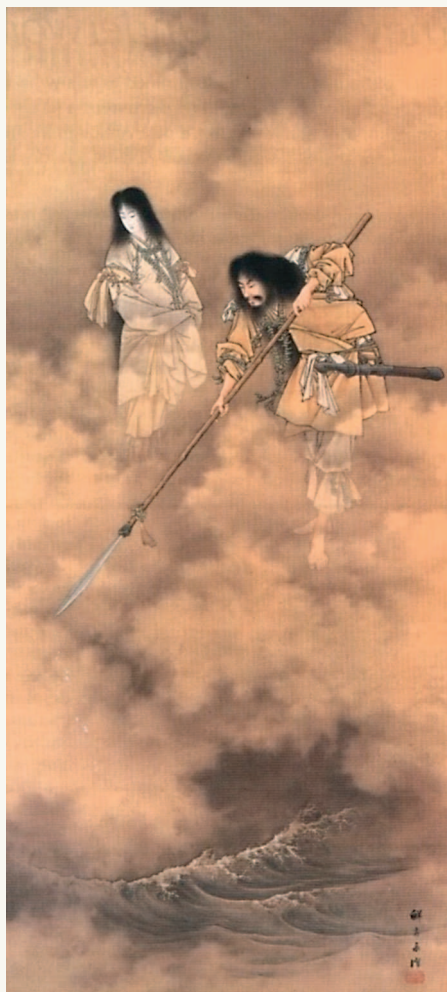
▲ Идзанами и Идзанаги создают Японские острова, ок. 1880 г. Художник Кобаяси Эйтаку (1843–1890). Музей изящных искусств, Бостон, США

Оногородзима — «сам собой сгустившийся остров».