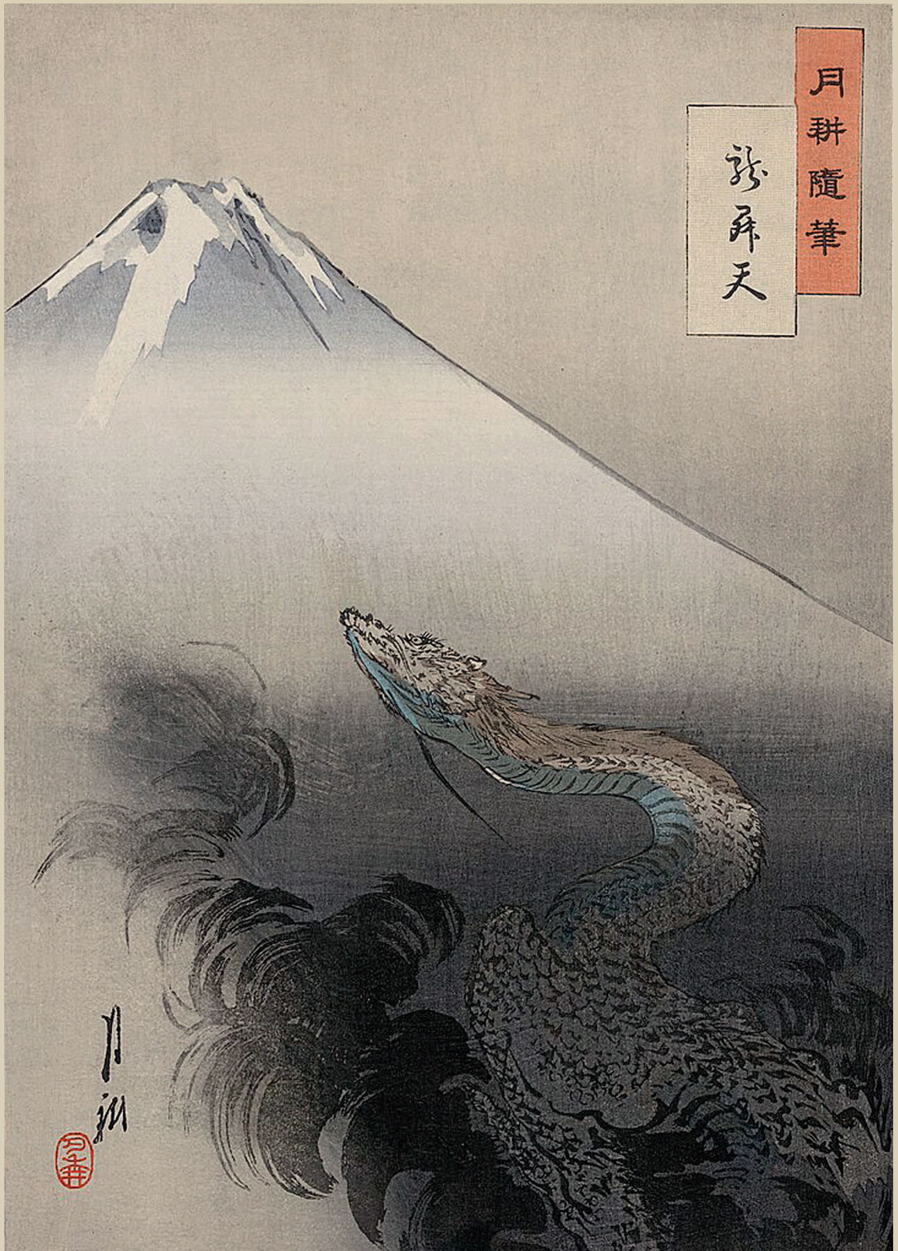
▲ Гора Фудзи. Здесь мы видим её изображение на рисунке в жанре укиё-э художника Огата Гэкко «Дракон взмывает в небеса», 1897 г. Библиотека Конгресса, Вашингтон, США