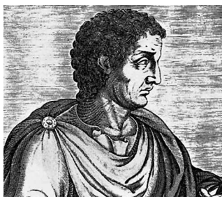
Плиний Старший (23–79 н.э.). Был знаменит своим трудолюбием

Обращаюсь к труду моему. Не дозволяя себе никакого изобретения, я искал выражений в уме своем, а мыслей единственно в памятниках; искал духа и жизни в тлеющих хартиях; желал преданное нам веками соединить в систему, ясную стройным сближением частей; изображал не только бедствия и славу войны, но и все, что входит в состав гражданского бытия людей: успехи разума, искусства, обычаи, законы, промышленность; не боялся с важностью говорить о том, что уважалось предками; хотел, не изменяя своему веку, без гордости и насмешек описывать веки душевного младенчества, легковерия, баснословия; хотел представить и характер времени и характер летописцев: ибо одно казалось мне нужным для другого. Чем менее находил я известий, тем более дорожил и пользовался находимыми; тем менее выбирал: ибо не бедные, а бо-