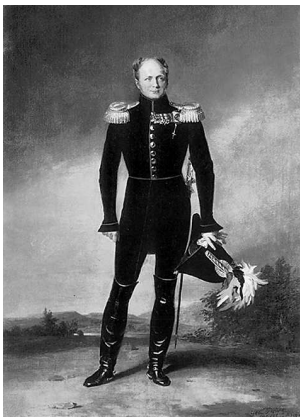
Император Александр I

Согласимся, что деяния, описанные Геродотом, Фукидидом, Ливием, для всякого нерусского вообще занимательнее, представляя более душевной силы и живейшую игру страстей: ибо Греция и Рим были народными державами и просвещеннее России; однако ж смело можем сказать, что некоторые случаи, картины, характеры нашей истории любопытны не менее древних. Таковы суть подвиги Святослава, гроза Батыева, восстание россиян при Донском, па-