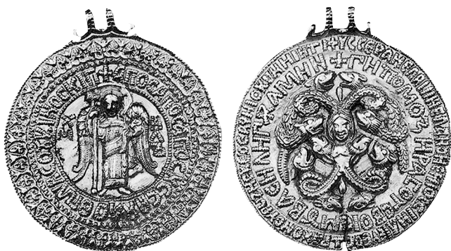
Материальные источники: Змеевик Владимира Мономаха (амулет в виде медали)

ский, Архивский 10 . В каждом из них есть нечто особенное и действительно историческое, внесенное, как надобно думать, современниками или по их запискам. Никоновский более всех искажен вставками бессмысленных переписчиков, но в XIV веке сообщает вероятные дополнительные известия о Тверском княжении; далее уже сходствует с другими, уступая им однако ж в исправности, — например, Архивскому .