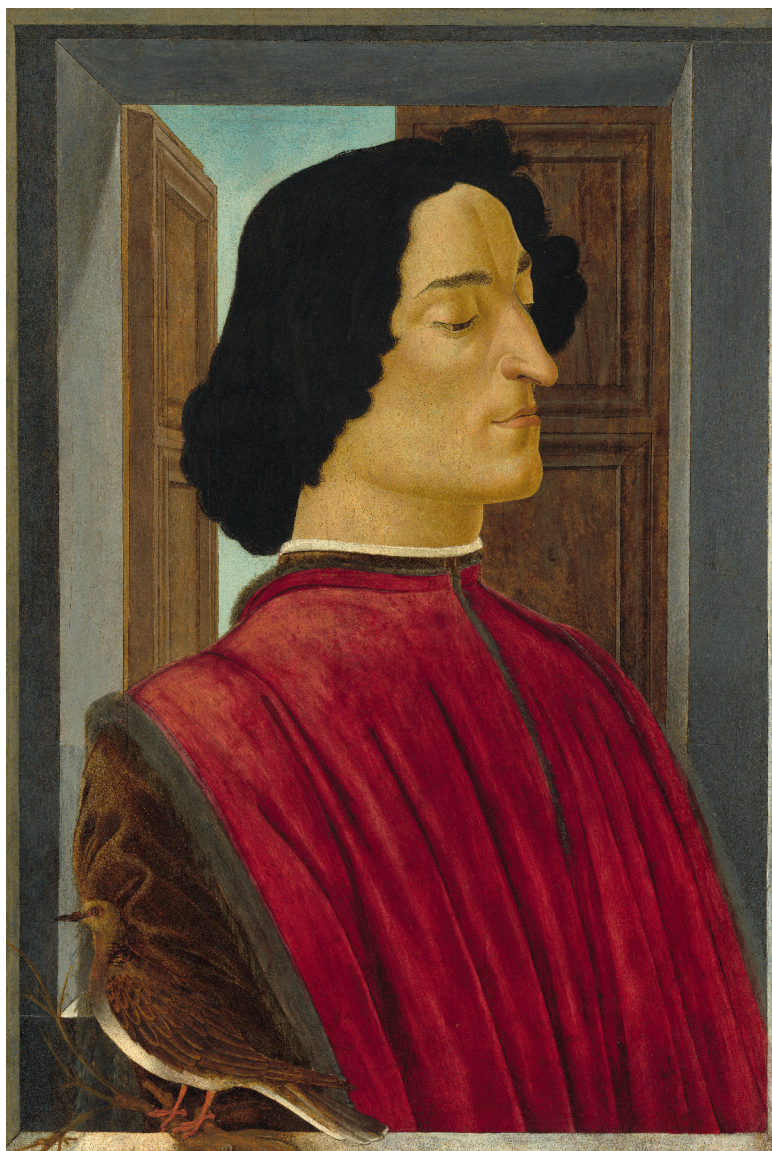
Сандро Боттичелли, портрет Джулиано Медичи, 1478-80 гг.