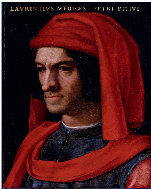
Аньоло Бронзино, портрет Лоренцо Медичи, м-ду 1565-69 гг.

Ее прадедушка – Лоренцо Медичи Великолепный, покровитель Леонардо и Боттичелли, а его младший брат Джулиано когда-то был влюблен в самую красивую девушку Флоренции – Симонетту Веспуччи. Конечно, Екатерина Медичи узнает эту историю любви, когда подрастет.