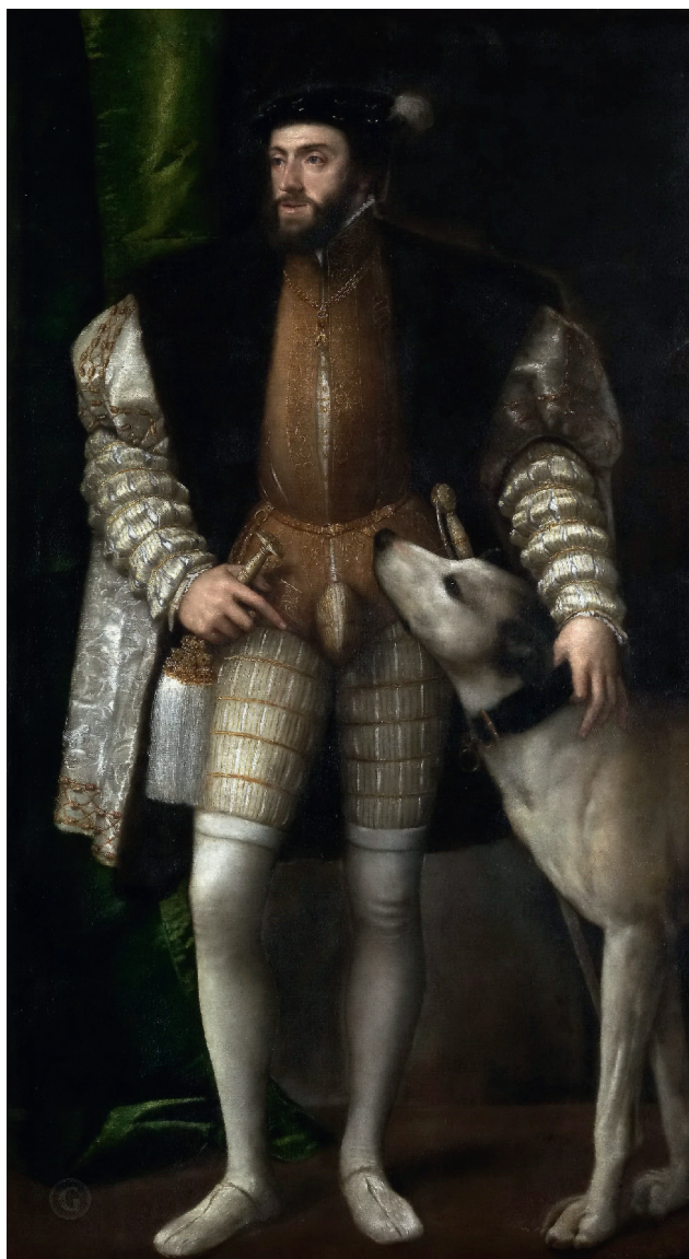
Тициан, портрет Карла V с собакой, 1533 г.