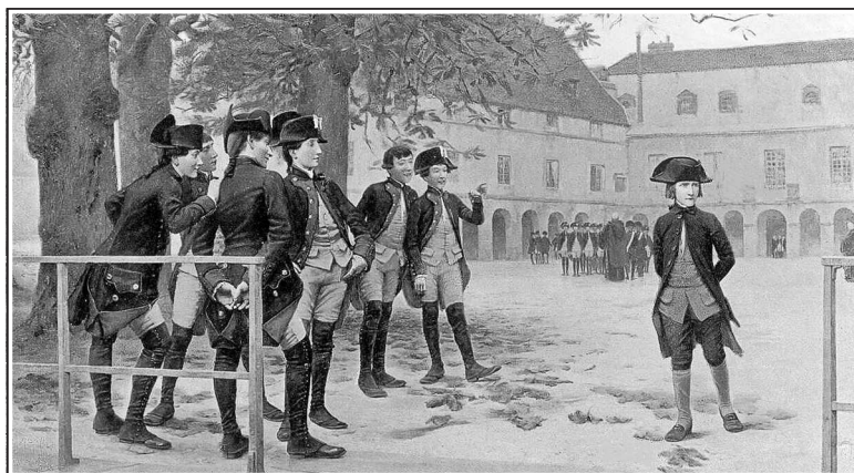
Наполеон Бонапарт в кадетской школе в Бриенн-ле-Шато в 1779 году. Иллюстрация к книге У.-М. Слоана «Жизнь Наполеона Бонапарта». 1896 г.

выговору. Но несколько драк, яростно и не без успеха (хотя и не без повреждений) проведенных маленьким Бонапартом, убедили товарищей в небезопасности подобных столкновений. Учился он превосходно, прекрасно изучил историю Греции и Рима. Он увлекался также математикой и географией. Учителя этой провинциальной военной школы сами не очень были сильны в преподаваемых ими науках, и маленький Наполеон пополнял свои познания чтением. Читал он и в этот ранний период и впоследствии всегда очень много и очень быстро. Французских товарищей удивлял и отчуждал от него его корсиканский патриотизм: для него французы были тогда еще чуждой расой, пришельцами-завоевателями родного острова. Со своей далекой родиной, впрочем, он в эти годы общался только через письма родных: не такие были у семьи средства, чтобы выписывать его на каникулы домой.