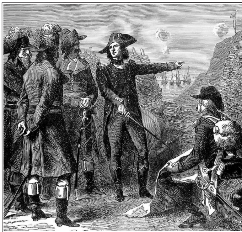
Наполеон излагает план взятия Тулона.

Иллюстрация Ф. Ликса из «Универсальной истории Ридпата». 1897 г.