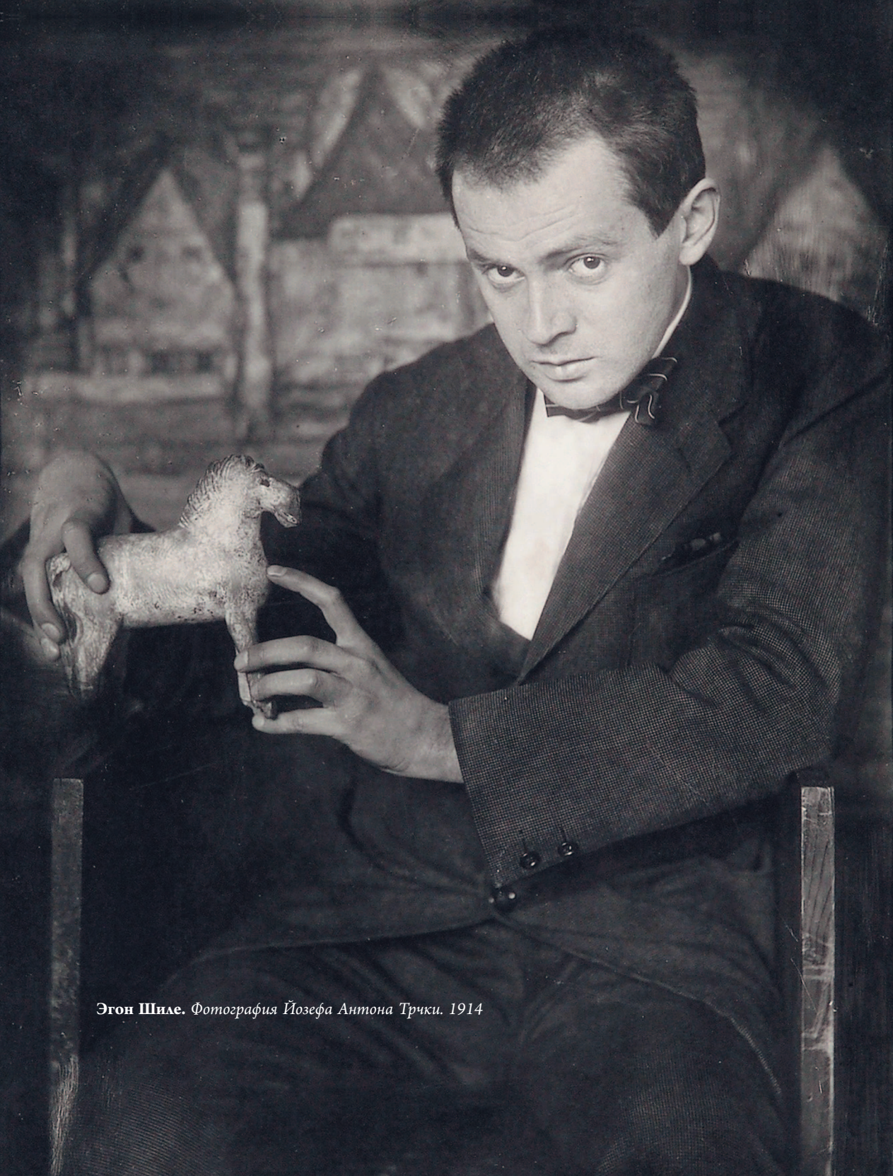
Эгон Шиле. Фотография Йозефа Антона Трчки. 1914