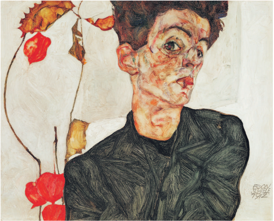
Автопортрет с физалисом. 1912 Музей Леопольда, Вена