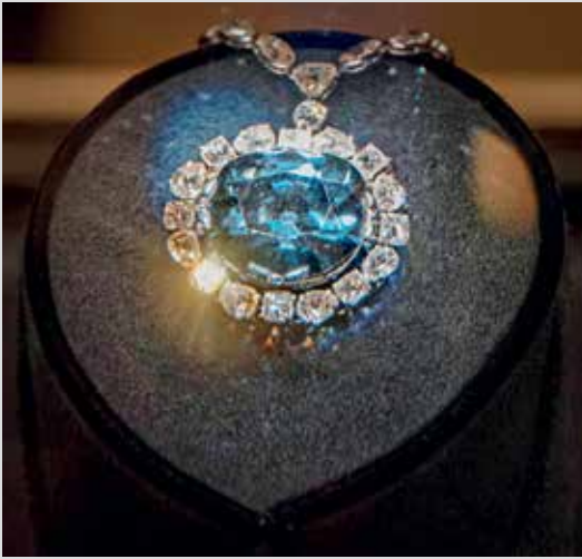
Алмаз Хоупа в Смитсоновском национальном музее естественной истории.