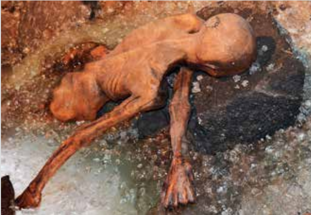
Этци, Ледяной человек. В таком виде он был найден в 1991 году в Эцтальских Альпах в Тироле.