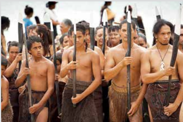
Воины-маори, празднующие День Вайтанги. Новая Зеландия, Северный остров, 2017 г.