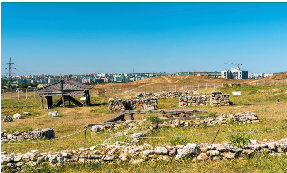
Часть экспозиции под открытым небом

По мере того как Неаполь старел и разрушался, разрасталось новое поселение. Сначала это был Керменчик — по-крымско-татарски «маленькая крепость», затем, по мере укрепления Крымского ханства, поселение превращалось в город, в тот самый Акъмесджит, о котором мы уже говорили. Если