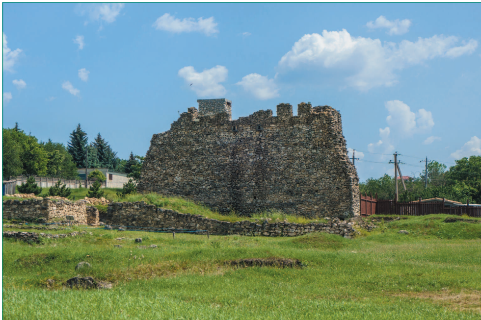
Стена Неаполя Скифского

В крымско-татарский период на развалинах крепости добывался камень для строительства. Разбор старых сооружений для возведения новых продолжался и тогда, когда Крым вошел в состав Российской империи.