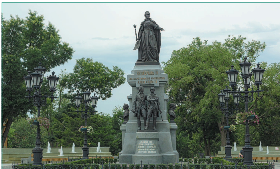
Памятник Екатерине II в Симферополе

Конечно же, нынешний сад значительно отличается от изначального, ведь за годы, десятилетия и века своего существования он не раз реконструировался. Зато в нем есть монумент в честь Екатерины II — копия ранее утраченного. Государыня в царском облачении держит в одной руке скипетр и карту Крыма, другой же указывает на место, где находится южная столица империи. Центральная скульптура окружена четырьмя скульптурами сподвижников Екатерины. В их числе князь Потемкин и великий полководец Суворов.