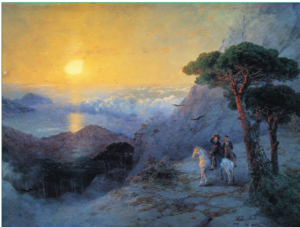
И. К. Айвазовский. А. С. Пушкин на вершине Ай-Петри при восходе солнца. 1899 г. Государственный Русский музей

строками подписывал свои зарисовки Максимилиан Волошин... Пушкин, Чехов, Куприн, Бунин, Цветаева, Горький, Грин, Маяковский — целое созвездие именитых литераторов, и все они оставили свой след в Крыму, а Крым — в их творческих биографиях.