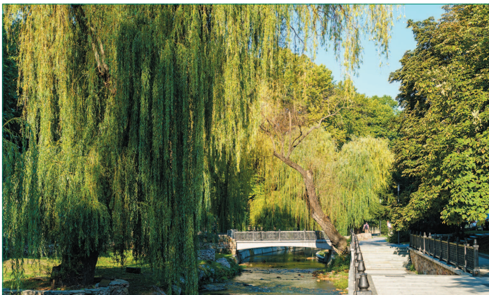
Парковая зона на берегу Салгира

расчистил, подставил емкость для сбора воды (говорят, простой кусок черепицы). Как возник слух о целебности воды, доподлинно неизвестно, но к источнику потянулись горожане. Более того, появились люди, утверждавшие, что вода принесла им исцеление. Так, каменотес Ананий Кастамбулов, грек по национальности, первым благоустроил это место в благодарность за избавление от лихорадки. А спустя некоторое время, в середине XIX века, другой грек, Апостол Савопуло, прозрел, хотя был незрячим от рождения. Тогда-то он и решил соорудить за свои средства фонтан, центральным скульптурным изображением которого стало лицо ангела. До сих пор, несмотря на реконструкции, можно увидеть надпись, напоминающую об инициаторе создания фонтана. Были у него и другие названия, греческое и тюркское, которые означали одно и то же — «святая вода». Фонтан Савопуло — единственный из девяти симферопольских фонтанов, сохранившихся до нашего времени.