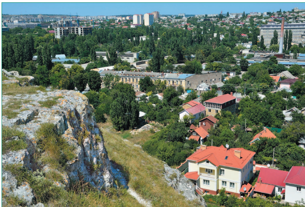
Вид на Симферополь с Петровских скал

сравнительно недавно. «Несущий всем благо», «собиратель» — какая у вас ассоциация с этими словами? Да, разумеется, пчела. Именно она помещена сейчас в верхнем поле гербового щита Симферополя, а в нижнем, под волнистой линией, изображающей главную реку Крыма — Салгир, — античная чаша как напоминание о прародителе города, Неаполе Скифском.