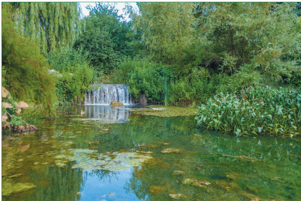
Уголок парка «Салгирка» (Воронцовского)

Екатерининский сад на берегу Салгира был устроен в модном для начала XIX века английском стиле, имитирующем уголок дикой природы. Сад начали создавать в период правления любимого внука Екатерины Великой, Александра I.