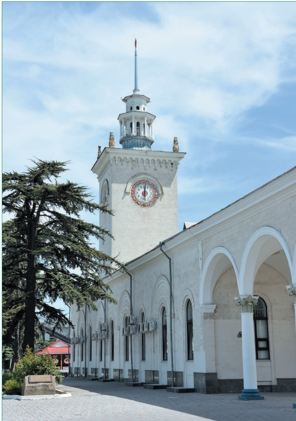
Железнодорожный вокзал в Симферополе