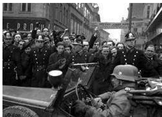
Немецкие войска вступают в Прагу, 1939 г.

27 сентября сдается Варшава. Польское правительство отправляется в изгнание через Румынию.