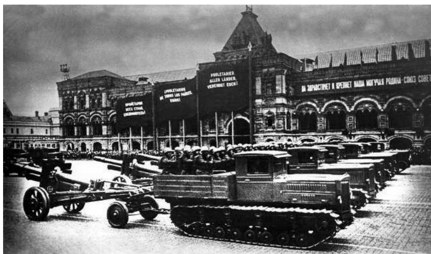
Артиллерия на параде, 1 мая 1940 г.

ного объяснения этому приказу нет; демонтировав старые УР и так и не достроив к началу войны новые, наше командование лишило отступающую армию возможности закрепиться хотя бы по линии старой границы. Но, может быть, смысл приказа был именно в этом: командующие должны были сознавать, что за спиной у них других укреплений нет, значит, биться нужно только на границе, «не отдавая ни пяди своей территории». Недаром в начале войны некоторые командующие отдавали при-