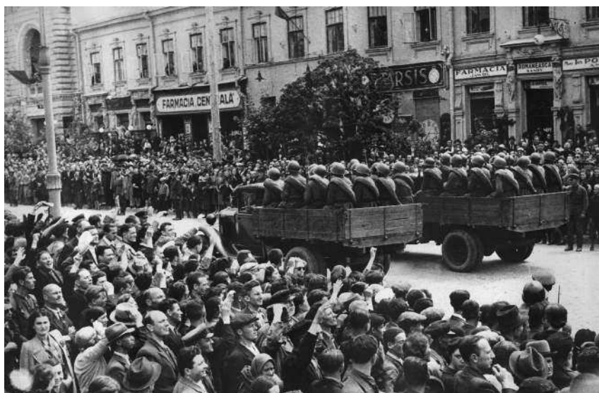
На параде Красной Армии в Кишиневе 3 июля 1940 года в связи с освобождением Бессарабии