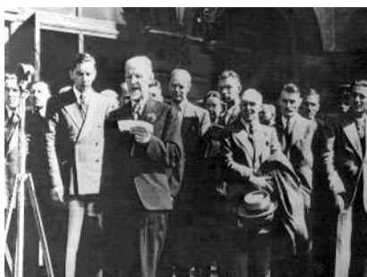
Принятие Латвии в состав СССР. Рига 30 июля 1940 года. У микрофона — председатель Народного правительства профессор А. Кирхинштейн

★ Под Новый год в «Известиях» опубликована статья «Уран-235», которую заключала фраза «Физика стоит перед открытия-