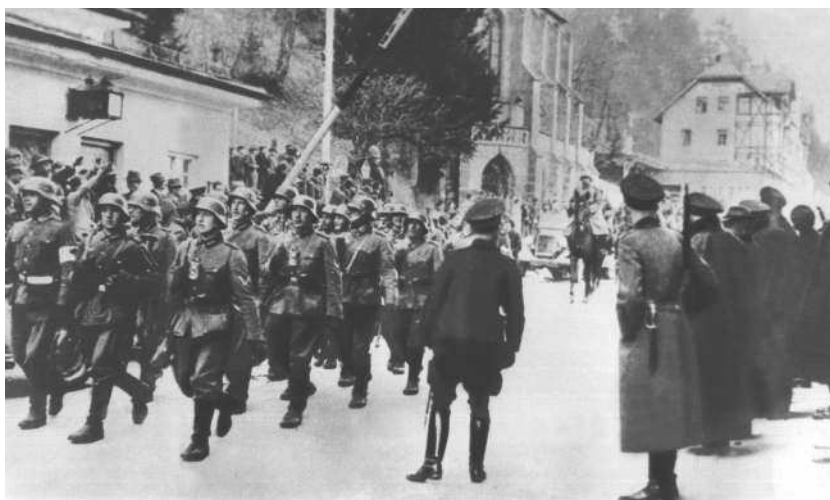
Вступление немецких войск в Австрию у Ниферсдорфа

Австрия (нем. Österreich), официальное название — Австрийская Республика (Republik Österreich) — государство в центре Европы. Название страны происходит от древнемецкого Ostarrichi — «восточная страна».