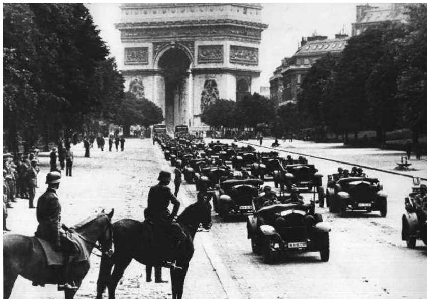
Парад немцев в Париже, 1940 г.

тральные страны Бенилюкса. Люксембург оккупирован 10 мая; Нидерланды сдаются 14 мая; Бельгия — 28 мая.