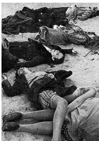
Польша, 1939 г.