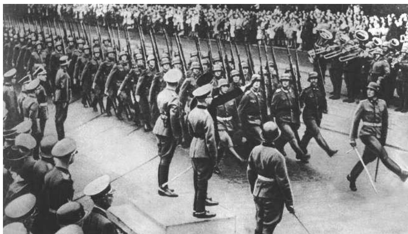
По главной улице Берлина маршируют отличившиеся в войне против Польши и Франции

В южной части Франции устанавливается коллаборационистский режим со столицей в городе Виши.