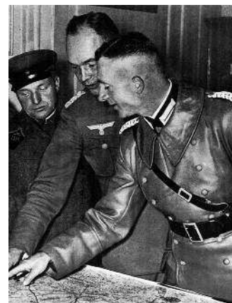
Немецкие офицеры в Белостоке проводят демаркационную линию в присутствии командира Красной Армии, 1939 г.

★ Германия и Советский Союз подписывают пакт о ненападении и секретное приложение к нему, по которому Европа разделяется на сферы влияния.