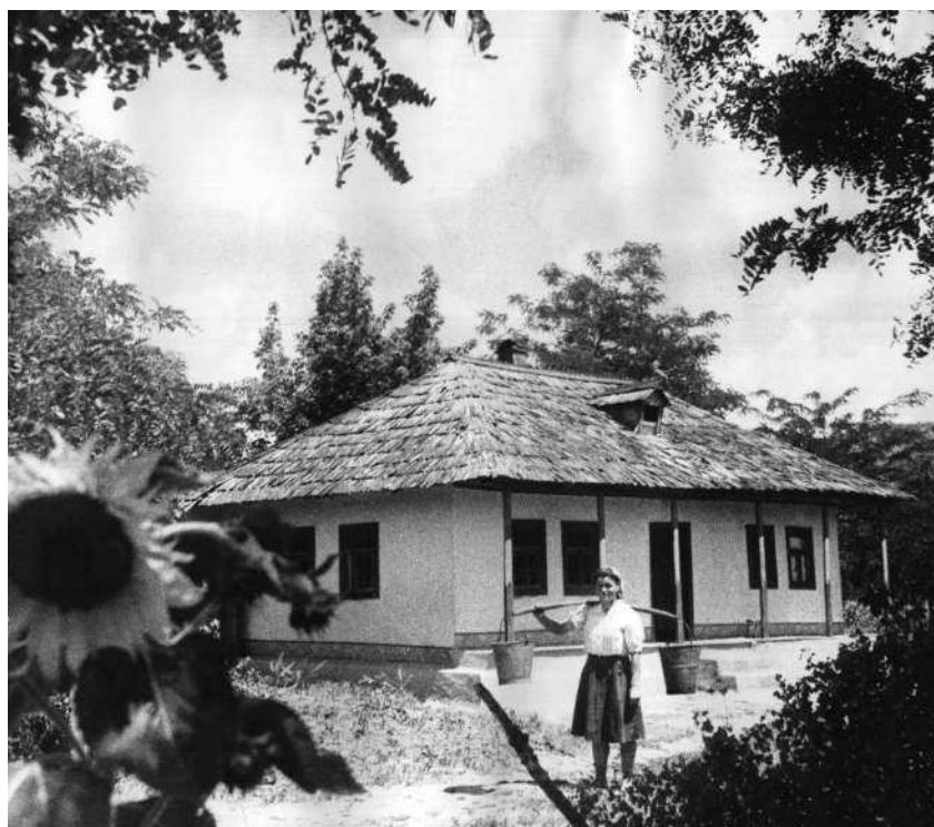
Усадьба молдавского крестьянина, 1930-е гг.

Великобритания и Франция потому настаивали на «соглашении трех» — Лондона, Парижа и Москвы: в случае если бы Франция и Великобритания оказались в состоянии войны с Германией из-за взятых уже ими обязательств перед Польшей и Грецией, СССР оказал бы им немедленно помощь и поддержку, и наоборот.