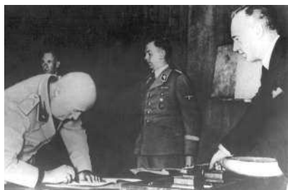
Муссолини подписывает Мюнхенское соглашение

★ Германия присоединяет Австрию (так называемый Аншлюс).