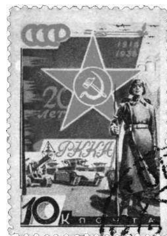
Почтовая марка 20 лет РККА, 1938 г.

★ МИД Великобритании так комментировал это предложение: «Москва, возможно, в состоянии обеспечить оборону собственной территории», но не сможет, «даже если захочет, предложить полезную активную помощь за пределами своих границ. Данные, имеющиеся у нашей секретной разведывательной службы, говорят о том же. Мощь советской армии подорвана чистками; советские военно-воздушные силы, хотя и внушительны по численности, не отвечают современным требованиям; советский военно-морской флот, вероятно, не в состоянии сделать многое против германских ВМС в Балтийском море». Вывод МИД Великобритании был неутешительным: «Соглашение не обеспечит в значительной степени дополнительной безопасности; оно вызовет подозрения наших друзей и усилит враждебность врагов». Начальники штабов Великобритании подготовили меморандум, в котором говорилось, что в случае, если не удастся добиться никакого соглашения с СССР, то это только подтолкнет Гитлера к очередной агрессии и «в конце концов толкнет СССР в ее объятия». Польша была решительно против альянса с СССР: если Германия объявит войну Великобритании или Франции, Польша и СССР объявят войну Германии, и тогда Москва направит свои танки и самолеты через территорию Польши, а это пугало Варшаву. СССР в своих предложениях выдвинул интересный пункт о защите Литвы, Латвии, Эстонии, Финляндии — то есть о защите своих западных границ и легальной возможности направить свои войска в любую из этих стран. Ни