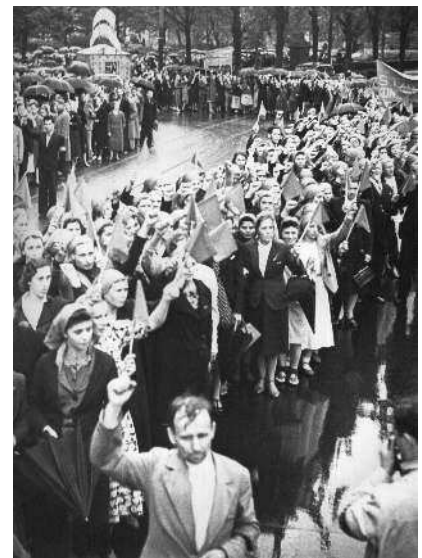
200-тысячная демонстрация в честь принятия Латвии в состав СССР, 6 августа 1940 г.

Гитлером «плана Барбаросса» докладывал в Москву: «...(фамилия вычеркнута) сообщил, что... (фамилия вычеркнута) от высокоинформированных источников