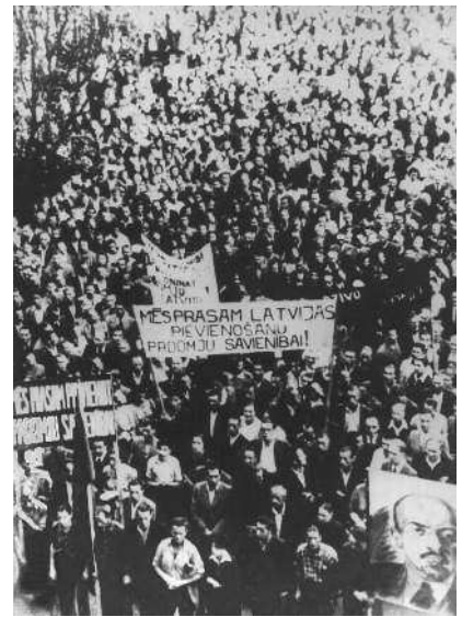
Рига. Демонстрация трудящихся с требованием присоединения Латвии к СССР

★ Советский военный атташе в Берлине генерал Туников через 11 дней после принятия