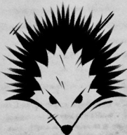
Рог Чёрного ежа