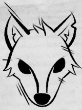
Рог Серого волка