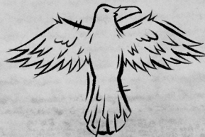
Рог Речного ворона