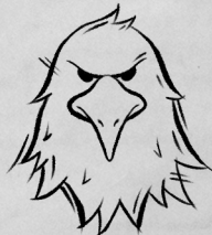
Рог Сизого орла