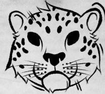
Рог Снежного барса