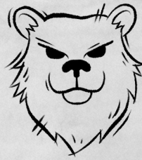
Рог Бурого медведя