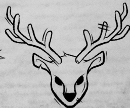
Рог Поморского оленя