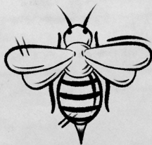
Рог Золотой пчелы