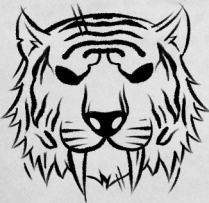
Рог Белого тигра