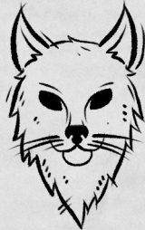
Рог Сумеречной рыси