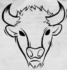
Рог Красного зубра