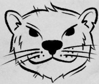
Рог Донской свирвы