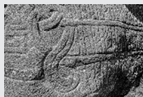
Рунный камень Харальда в Дании

Для наглядности возьмем одну сюжетную основу — божественная власть нисходит с небес на землю — и посмотрим, как она реализуется в различных мифологических системах. В древнегреческой мифологии сын богини дневного света Гемеры Уран, олицетворяющий небо, сочетался браком с Геей — Землей, породив множество дивных существ. Громовержец Зевс — царь богов, внук Урана и Геи — взирал на людей с неприступной вершины Олимпа. Среди детей, родившихся от союза Зевса со смертными женщинами, не только герои, но и цари. Самая известная и почитаемая богиня японского пантеона, Аматэрасу, — олицетворение солнца, праматерь императоров. В германо-скандинавской мифологической традиции верховным божеством является Один (Водан), мудрец и бог войны (в греческом пантеоне таким сочетанием функций могла похвастаться Афина). Среди его сыновей Тор — опять же бог-громовержец (как тут не вспомнить еще и славянского Перуна!); Ингви, считавшийся родоначальником династии королей Швеции,