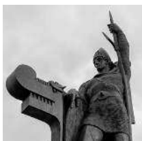
Статуя викинга Ингольфура Арнарсона, семья которого поселилась в Исландии в 874 году. Рейкьявик, Исландия

Чем суровее условия жизни, чем больше усилий должен прилагать человек для выживания, тем драматичнее сказания. Это в полной мере касается скандинавских саг — части германо-скандинавской мифологии. Предки современных