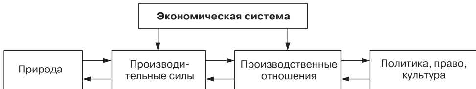
Рис. 3.1. Элементы экономической системы

В экономике каждой страны имеется множество различных видов деятельности, и каждая составляющая ее системы находится во взаимосвязи и взаимодействии (рис. 3.1).