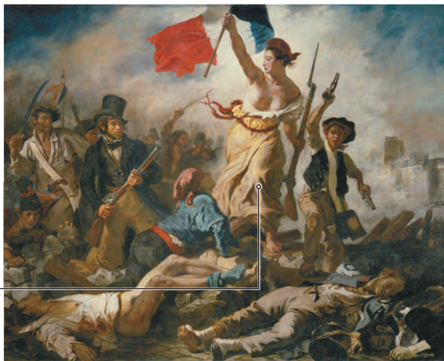
Эжен Делакруа. Свобода, ведущая народ. 1830 г.

Восставших ведет к победе аллегорическая фигура античной богини, вздымающей знамя Республики.