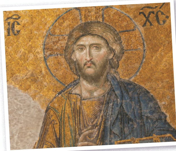
Деисус. Фрагмент мозаики. Айя-София. Около 1261 г.

В глубокой древности храм образно называли кораблем, который во время молитвы уносит верующих на небеса. Его стены, кровли, своды, внутреннее убранство полны сложных богословских знаков и символов, получивших визуальное воплощение.