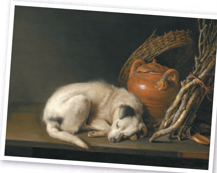
Геррит Доу. Спящая собака. 1650 г.

Изображения братьев наших меньших, их образы позволяют передать особые эмоции, которые гораздо сложнее выразить при помощи человеческих фигур. На маленькой деревянной доске Геррит Доу детально, вплоть до каждой шерстинки, изобразил чистенького тощего щенка, задремавшего под глиняным боком кувшина с надколотой крышкой. Судя по небольшой вязанке хвороста для растопки очага и потертой корзине, щенка не ожидает сытный обед. Но оставленная хозяином-бедняком уличная обувь остается под надежной охраной.