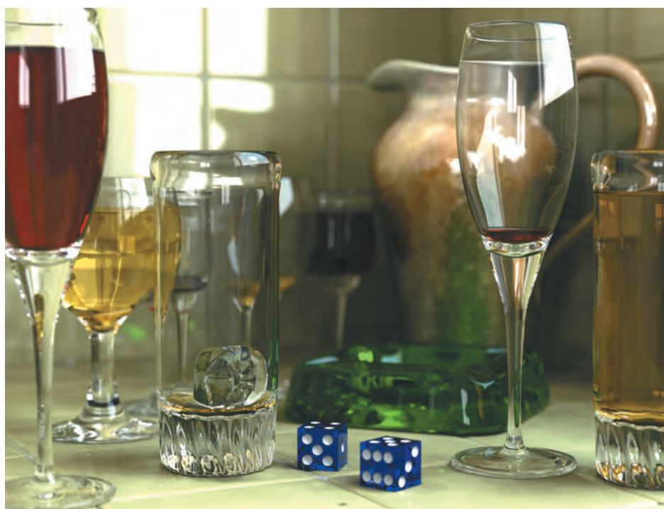
Жиль Тран. Стаканы, кувшин, пепельница и игральные кости. Около 2004 г.

Натюрморты популярны и в фотографии, которая идет рука об руку с компьютерной графикой. Современное программное обеспечение предоставляет множество инструментов для получения изображений. Для создания этого синтетического натюрморта, произведения «цифрового искусства», Жиль Тран использовал программу POV-Ray 3.6 и метод Radiosity. Стаканы и кувшин были смоделированы в Rhino, а игральные кости — в Cinema 4D.