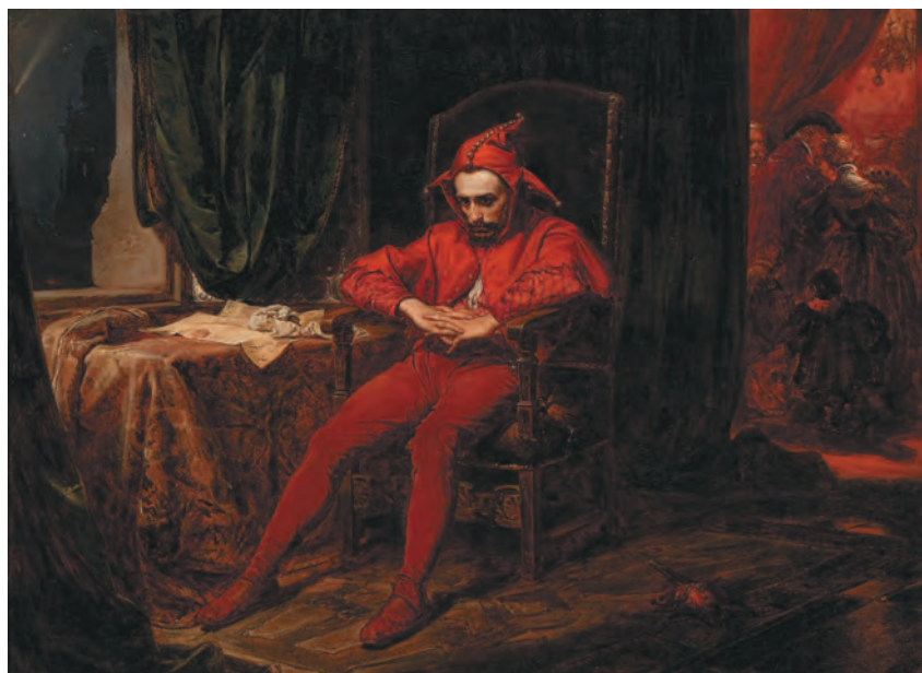
Ян Матейко. Станчик. 1862 г.