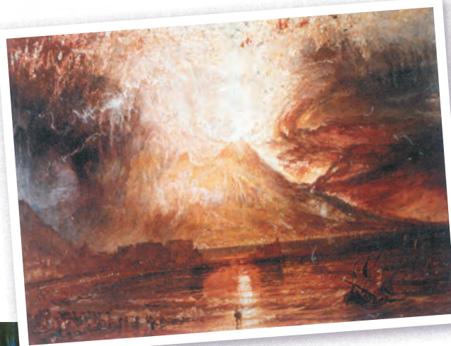
Уильям Тернер. Извержение Везувия. Около 1817 г.

Восхищение могуществом природы нашло отражение в пейзажах. Вспышки света и мрачная тяжесть туч, зеркальные отблески вод и громады высящихся над ними гор передают впечатление от созерцания буйства стихии. Такова акварель Тернера, запечатлевшая извержение Везувия. Художник вместил на небольшой лист детали, которые усилили грандиозность события.