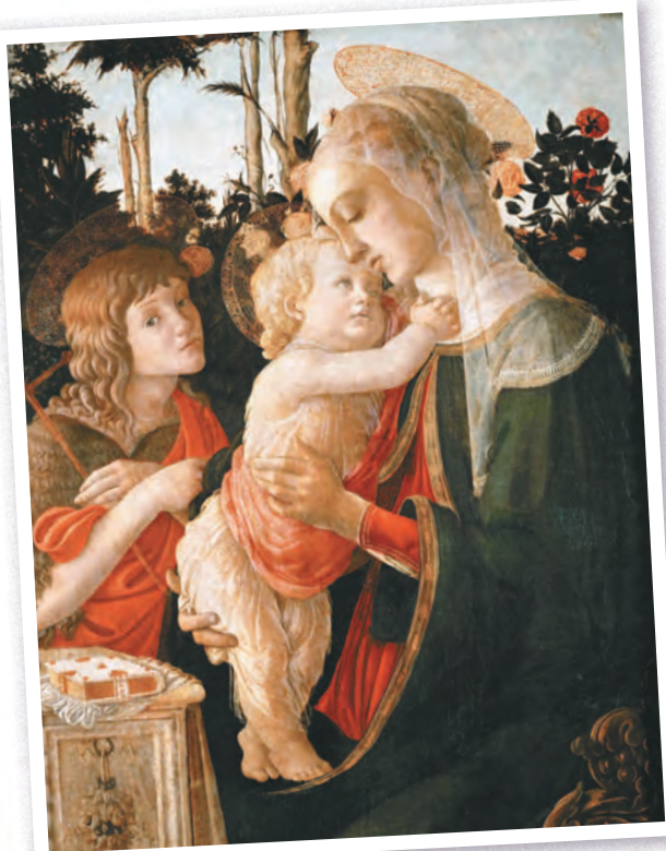
Сандро Боттичелли. Мадонна с Младенцем и юным Иоанном Крестителем. Около 1470—1475 гг.

Начиная с эпохи Возрождения свое преклонение перед Божественным живописцы западноевропейской традиции выражали в трогательных лирических композициях. Такие изображения пронизаны искренним религиозным чувством благодарности жертве Христа и разделению скорби Мадонны перед неизбежностью грядущего.