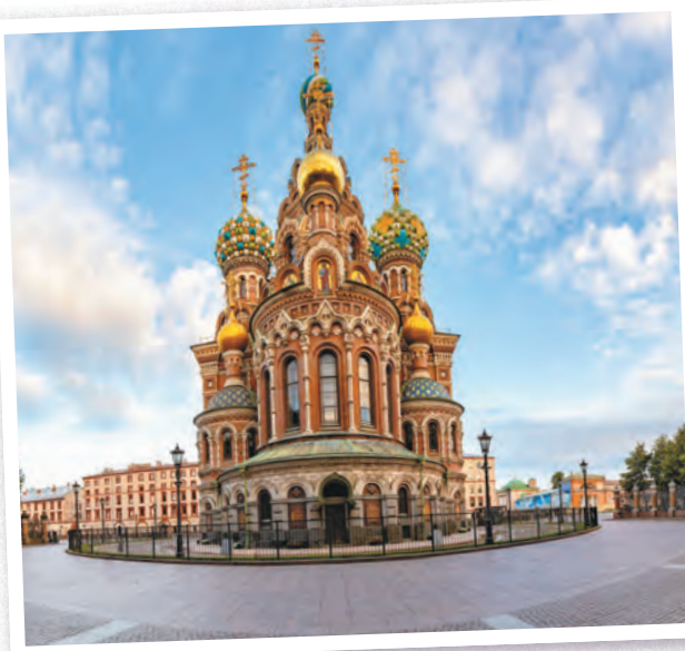
Альфред Парланд. Храм-памятник Спаса на Крови. 1883—1907 гг.

Трагическому событию посвящен православный храм-памятник Спаса на Крови в Санкт-Петербурге. Девятиглавая, 81 м в высоту, живописная церковь высятся на месте, где 1 марта 1881 г. в результате покушения был смертельно ранен император Александр II. Возведенная по проекту архитектора Альфреда Парланда в русском стиле, она стала символом уходящей эпохи.