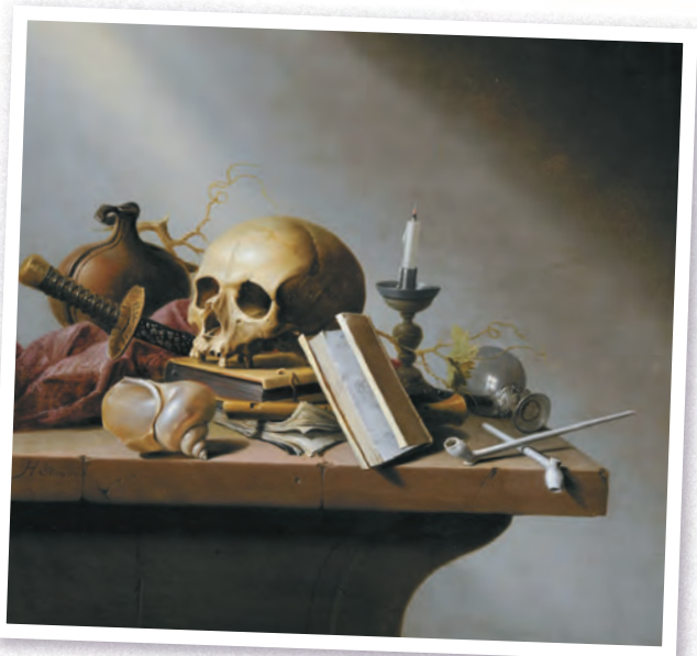
Хармен Стенвейк. Ванитас. Около 1640 г.

Выхватывая угасающим лучом света из подступающей тьмы пустой бокал, потухшую свечу, недочитанную книгу, рукоять навеки оставленного меча, нидерландский живописец Хармен Стенвейк напоминает о необходимости ценить каждое мгновение бытия.