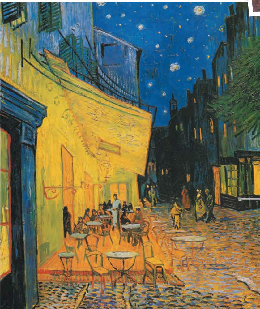
Винсент Ван Гог. Терраса кафе ночью. 1888 г.

Оттенки сине-фиолетового и пронзительно желтого, холодные пятна звезд и теплые прямоугольники окон — игра контрастов цвета и перспективных сокращений на картине Ван Гога превращает маленькую террасу кафе на узкой улочке в драматичную сцену.