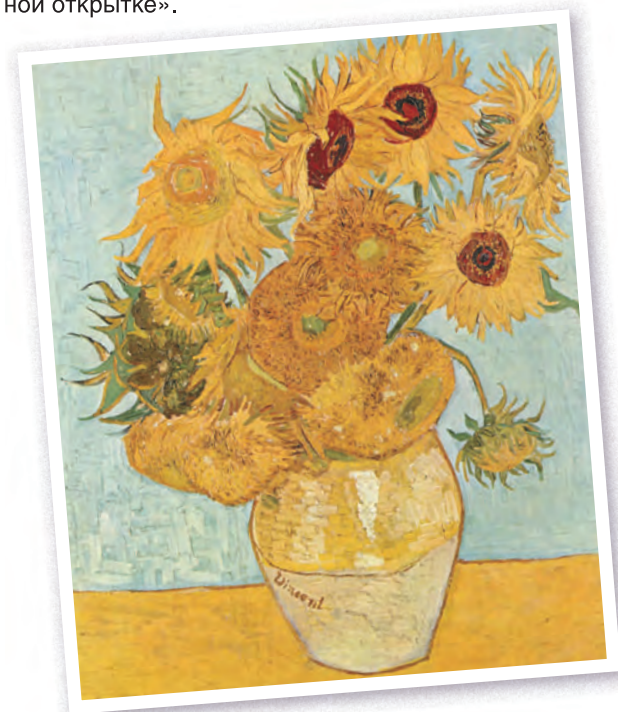
Винсент Ван Гог. Ваза с подсолнухами. 1888 г.

Знаменитую серию натюрмортов с подсолнухами Винсент Ван Гог создал в радостном ожидании приезда своего коллеги Поля Гогена. Их искрящийся цвет будто вобрал все солнце юга. Условная плоскостность фона контрастирует со светлым бликом на боку простого глиняного сосуда. Это привлекает внимание к подписи художника на своеобразной «приветственной открытке».