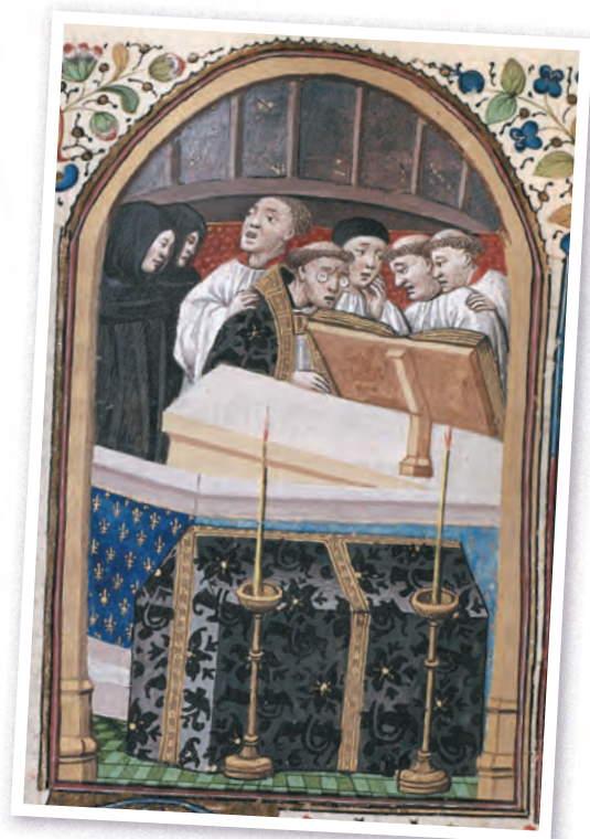
Неизвестный мастер. Часослов. Миниатюра. Около 1450 г.

Первыми исполнителями христианских песнопений были монахи. Сборники музыкальных произведений для них украшали изящные миниатюры. Религиозные песнопения составляют золотой фонд шедевров музыкального искусства. Знаменитая «Аве Мария» Франца Шуберта или трагический «Реквием» Вольфганга Амадея Моцарта заставляют замирать сердца многих поколений слушателей.