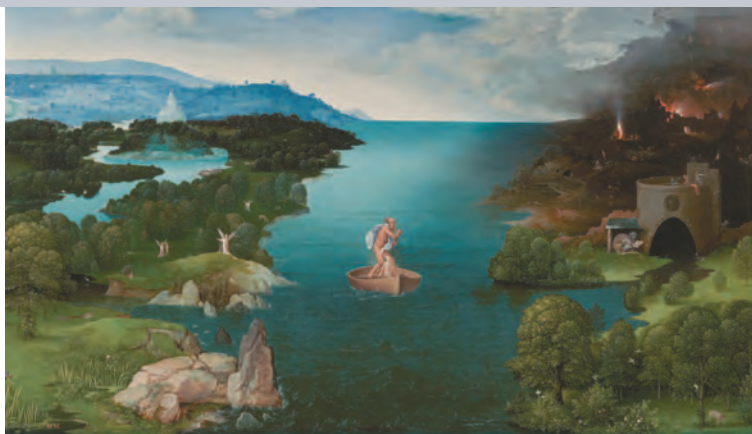
Иоахим Патинир. Переправа через Стикс. Около 1520—1524 гг.

Стремление передать единение природы и человека привело к включению в пейзажи фигурок. Такие детали изображения называют стаффажем. Они позволяют оценить масштаб творений природы и по виду героев, мирно пасущимся животным или сражающимся группам людей точнее понять основную мысль. В эпоху Возрождения одним из первых этот прием стал использовать фламандец Иоахим Патинир.