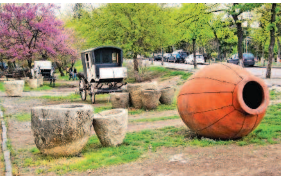
Этнографическая экспозиция под открытым небом

в поддержку грузинского языка как единственного государственного языка Грузинской ССР.