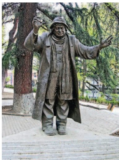
Памятник актеру Рамазу Чхиквадзе

В настоящее время парк 9 апреля известен прежде всего своими многочисленными памятниками. Посвящены они самым разным знаменитым людям, прославившим Грузию: художникам Ладю Гудиашвили и Елене Ахвледиани, о которых мы еще не раз вспомним во время наших прогулок, актерам Рамазу Чхиквадзе и Отару Мегвинетухуцеси, писателю Игнатию Ниношвили. Есть здесь памятники и известным людям негрузинского происхождения, например Анатолию Собчаку, расследовавшие