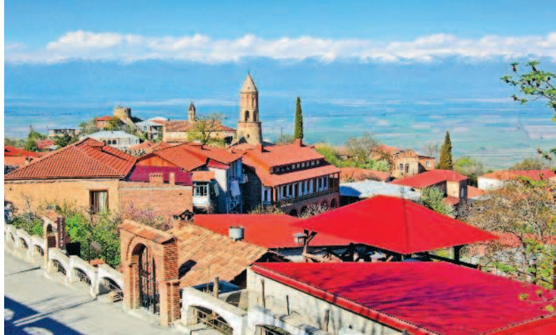
Сигнахи — город весны и любви

Забудем про стереотипы. Как по мне, так самое плохое в путешествиях — это выслушивать множество ненужных мнений от знакомых и сталкиваться с ворохом сомнительных отзывов. А самое хорошее в путешествиях — это ломать все эти стереотипы и мнения уже на месте. Проверено не раз.