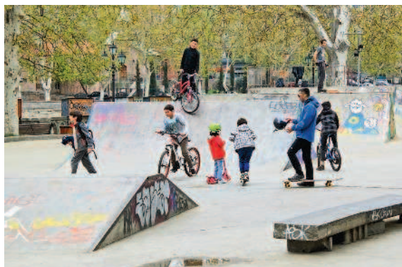
Скейт-парк облюбован детьми и молодежью

В парке Деда Эна теперь кипят не только политические страсти — с недавних пор он стал местом проведения самых разных культурных мероприятий, праздников и фестивалей. Зимой здесь появляется новогодний городок и рождественская ярмарка, где гостей ждут праздничные угощения, игрушки ручной работы, тематические инсталляции и концерты. А в начале мая парк принимает фестиваль молодого вина, и его территорию «оккупируют» столы и палатки для дегустаций. Как правило, дегустаторов набирается несколько тысяч человек.