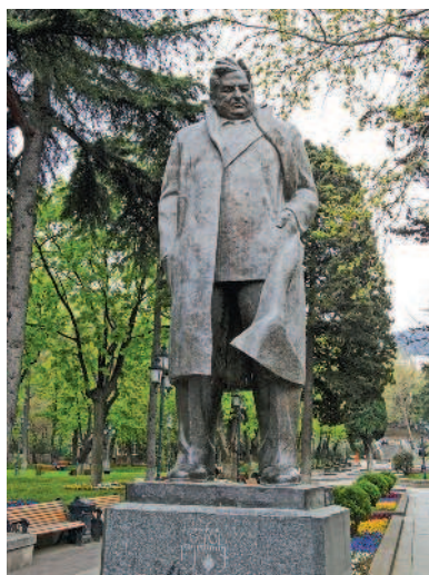
Скульптуры в парке 9 апреля