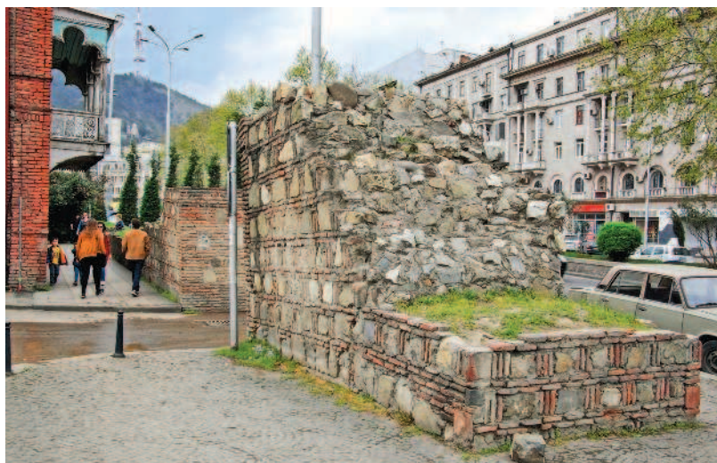
Остатки старой крепостной стены

Мы немножко задержимся на этой стороне улицы Бараташвили, так как здесь немало интересного. Рядом с «Берикаоба» вы увидите конку и скульптуру взбирающегося по лестнице фонарщика, точнее сказать —