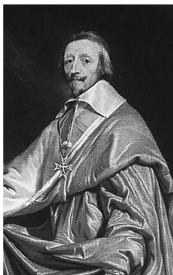
Слева — патриарх Иоаким Московский (1621—1690), икона работы неизвестного художника XVII в., справа — французский кардинал Ришелье (1585—1642), портрет работы Филиппа де Шампеня, XVII в.