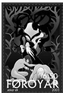
Аск и Эмбла на почтовой марке Фарерских островов

Едва начав осознавать свое «я» и отделять себя от природы, человек заметил, что мир устроен удивительно разумно. Ночь сменяется днем, ясная погода — дождливой; потрудившись, можно добыть себе пропитание и одежду, обустроить жилище. Почему всё так, а не иначе? Чьему замыслу и воле человек обязан своим существованием?