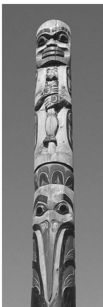
Тотемное изображение в Виктории (Канада)

Человек устроен так, что все пытается понять и познать. Окруженный необъяснимым, он подобен ребенку в темной комнате: а вдруг совсем рядом притаилась неведомая опасность, и никто не придет на помощь? То важное для нас, что бессилён постичь разум, издревле объясняет вера.