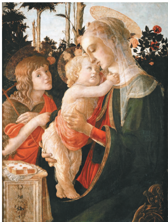
Сандро Боттичелли. Мадонна с Младенцем и юным Иоанном Крестителем. Около 1470–1475 гг.

В северных областях Центральной России была распространена традиция создания раскрашенных деревянных скульптур, представлявших Христа и ангелов. В этих фигурках православный канон изображений опирался на народные традиции.