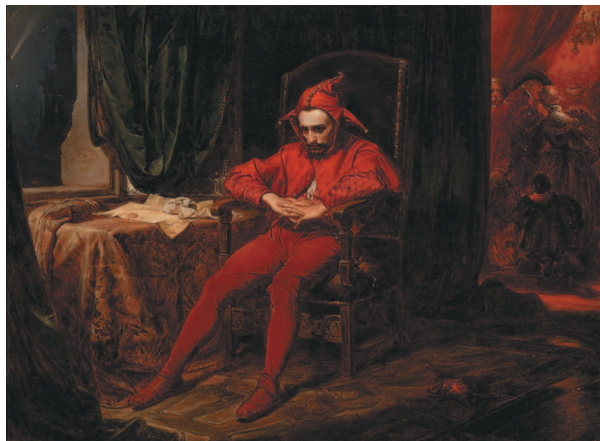
Ян Матейко. Станчик. 1862 г.

Резкий контраст между на первый взгляд незатейливым сюжетом и глубоким смыслом картины усиливается драматизмом красок живописного повествования. Таково полотно «Станчик» выдающегося польского мастера батальных и исторических сцен 2-й половины XIX в. Яна Матейко. На залитом красно-коричневыми тонами полотне изображен печальный шут, ускользнувший с беззаботного праздника. Тяжесть его раздумий вызвана письмом о грандиозном поражении армии, предшествующую победу которой празднуют на балу.