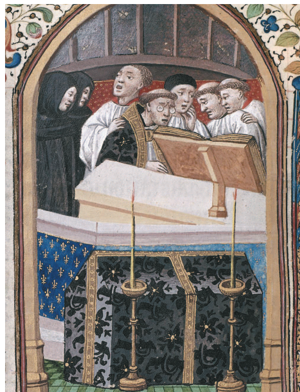
Неизвестный мастер. Часослов. Миниатюра. Около 1450 г.

Первыми исполнителями христианских песнопений были монахи. Сборники музыкальных произведений для них украшали изящные миниатюры. Религиозные песнопения составляют золотой фонд шедевров музыкального искусства. Знаменитая «Аве Мария» Франца Шуберта или трагический «Реквием» Вольфганга Амадея Моцарта заставляют замирать сердца многих поколений слушателей.