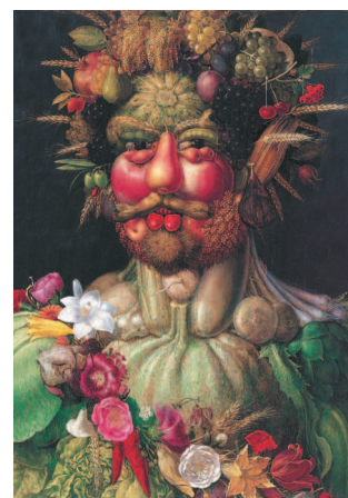
Джузеппе Арчимбольдо. Портрет императора Рудольфа II в образе Вертумна. Около 1590 г.

Пышная корона из сладких плодов и золотистых колосьев венчает голову бога плодородия Вертумна кисти Джузеппе Арчимбольдо. В этом буйстве плодов земных непросто рассмотреть портрет императора Рудольфа II. Такой его образ сулит процветание и благоденствие стране.