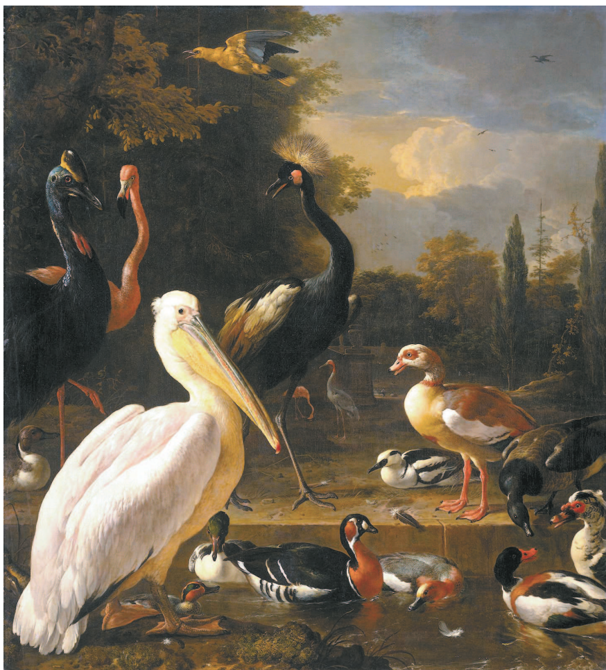
Мельхиор де Хондекутер. Пеликан и другие птицы у пруда. Около 1680 г.

ИЗОБРАЖЕНИЯ ЗВЕРЕЙ ВО ВСЕЙ ИХ КРАСЕ И СИЛЕ ПОЯВИЛИСЬ ЕЩЕ НА СВОДАХ ПЕЩЕР КАМЕННОГО ВЕКА. ЕГИПЕТСКИЕ БОГИ НА СТЕНАХ ДРЕВНИХ ГРОБНИЦ И ХРАМОВ ОБРЕТАЛИ УЗНАВАЕМЫЕ ЧЕРТЫ ЖИВОТНЫХ. ТАК ПОСТЕПЕННО, ЗА ДЕСЯТКИ ТЫСЯЧЕЛЕТИЙ, В ИСКУССТВЕ СЛОЖИЛСЯ ОСОБЫЙ ЖАНР.