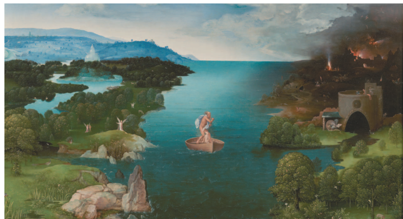
Иоахим Патинир. Переправа через Стикс. Около 1520–1524 гг.

Стремление передать единение природы и человека привело к включению в пейзажи фигурок. Такие детали изображения называют стаффажем. Они позволяют оценить масштаб творений природы и по виду героев, мирно пасущимся или сражающимся группам животных точнее понять основную мысль. В эпоху Возрождения одним из первых этот прием стал использовать фламандец Иоахим Патинир.