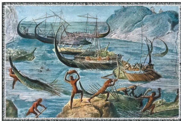
Морская батальная сцена. Римская стенная роспись. I в. до н.э.

Людам нравится рассказывать истории о своих победах. Уже в первобытных наскальных росписях, на древнеегипетских рельефах и древнеримских фресках встречаются сцены, изображающие сражения, путешествия и другие события, важные для их создателей.