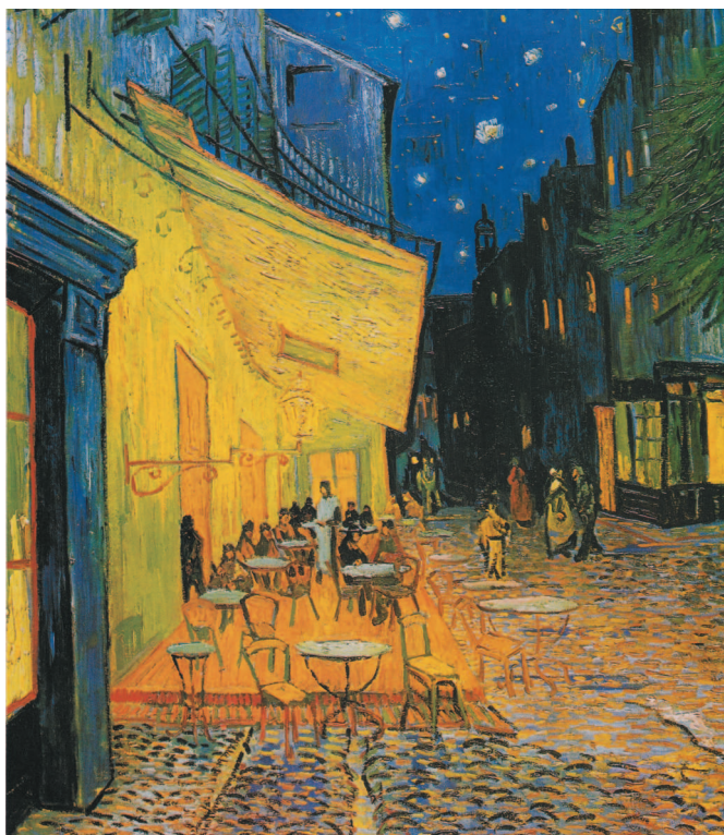
Винсент Ван Гог. Терраса кафе ночью. 1888 г.