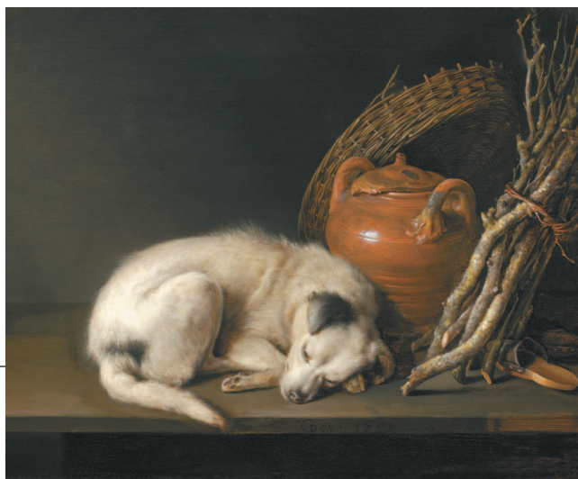
Геррит Доу. Спящая собака. 1650 г.