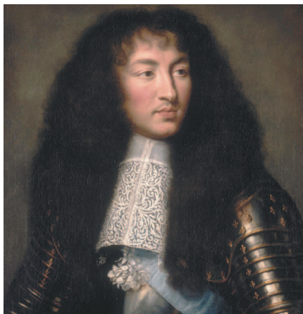
Шарль Лебрен. Портрет Луи XIV, короля Франции. Около 1662 г.