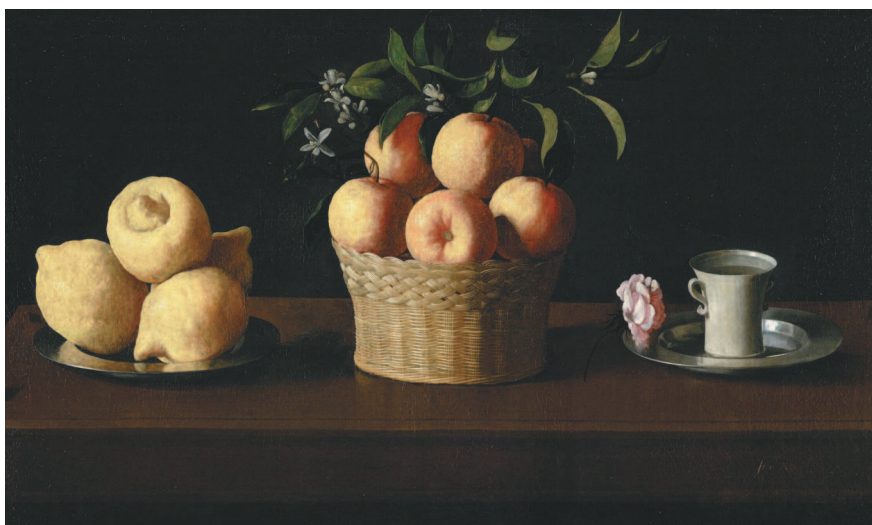
Франсиско де Сурбаран. Натюрморт с лимонами, апельсинами и розой. 1633 г.

Мастера натюрморта не ограничивались любованием красотой земных плодов. Яркий цвет фруктов, блеск посуды доставляют глазу истинное удовольствие, однако за простыми предметами скрыт глубокий смысл. Свежие краски картины Франсиско де Сурбарана почти ощутимо передают бугристую грубость и горьковатый аромат лимонов, нежность цветков и плодов апельсина и бархатистость лепестков розы на сияющей чистой тарелке. Но главным для живописца и его современников был скрытый в этих предметах и их сочетании образ Троицы и напоминание о Деве Марии.