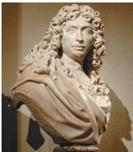
Антуан Куазевокс. Бюст Шарля Лебрена, первого художника короля. 1679 г.