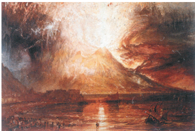
Уильям Тернер. Извержение Везувия. Около 1817 г.

Восхищение могуществом природы нашло отражение в пейзажах. Вспышки света и мрачная тяжесть туч, зеркальные отблески вод и громады высящихся над ними гор передают впечатление от созерцания буйства стихии. Такова акварель Тернера, запечатлевшая извержение Везувия. Художник вместил на небольшой лист детали, которые усилили грандиозность события.