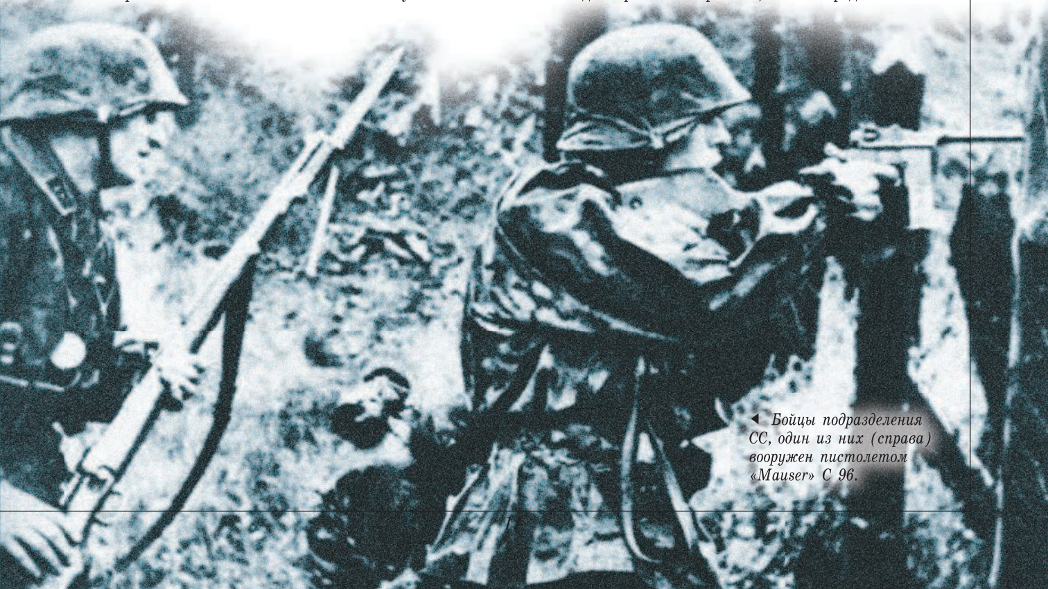
◀ Бойцы подразделения СС, один из них (справа) вооружен пистолетом «Mauser» С 96.

9×19 «Parabellum». Кроме них в сражениях приняли участие небольшое количество «Mauser» обр. 1932 г. («Model 712»), из которых можно было вести огонь не только одиночными выстрелами, но и очередями.