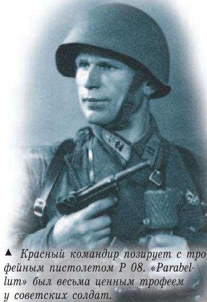
▲ Красный командир позирует с трофейным pistolом P 08. «Parabellum» был весьма ценным трофеем у советских солдат.

▼ Офицеры украинского антисоветского подразделения рассматривают карту. У некоторых из них на поясных ремнях pistols «Parabellum» P 08.