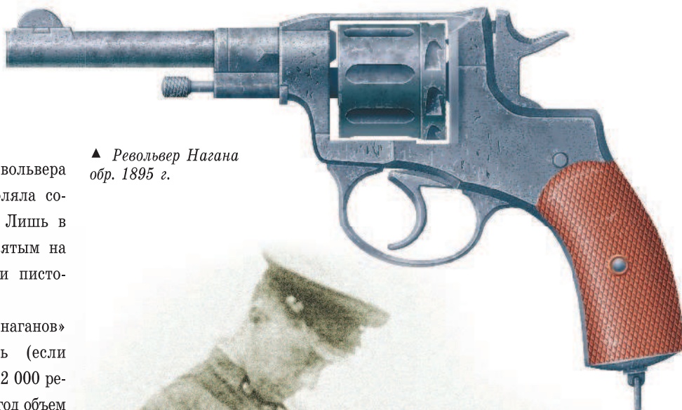
▲ Револьвер Нагана обр. 1895 г.

► Советские артиллеристы изучают трофейную батальонную пушку «Туре 92», захваченную у японцев во время боев на Халхин-Голе в 1939 г. Оба командира вооружены «наганами».