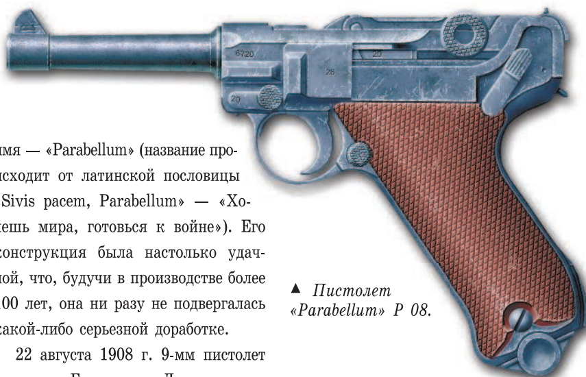
▲ Пистолет «Parabellum» P 08.

«Parabellum» обр. 1908 г. стал основой для создания многих специализированных стрелковых систем. Для флота была выпущена «Морская модель», ко-