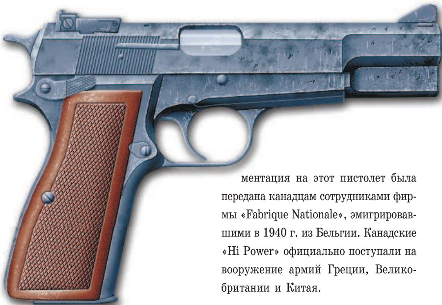
▲ Пистолет «Browning» HP.

После оккупации немцами Бельгии в 1940 г. заводы фирмы «Fabrique Nationale» начали выпускать пистолеты «Hi Power» под обозначением P 640 (b). За годы Второй мировой войны части Вермахта и СС получили более 300 000 этих пистолетов. В союзнической Румынии было произведено еще около 100 000 пистолетов «Browning Hi Power». Пистолеты «Browning» обр. 1935 г. в годы Второй мировой войны можно было встретить на вооружении армий многих противоборствующих государств. Так, например, их производство было организовано в Канаде (которая являлась участницей антигитлеровской коалиции) на заводах фирмы «John Inglis». По некоторым данным, доку-