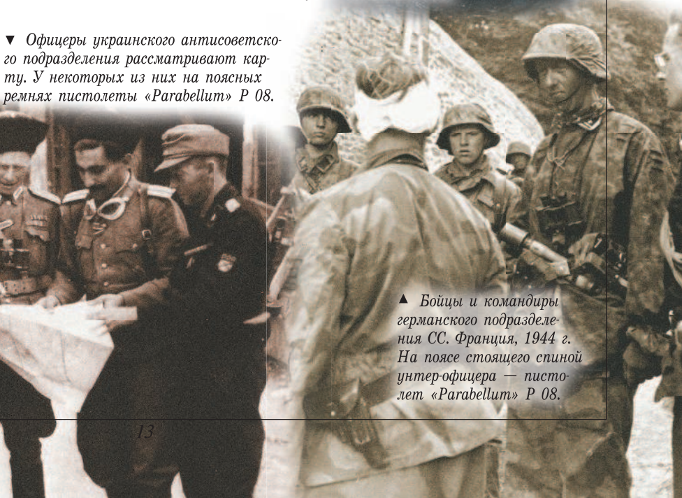
▲ Бойцы и командиры германского подразделения СС. Франция, 1944 г. На поясе стоящего спиной унтер-офицера — pistol «Parabellum» P 08.