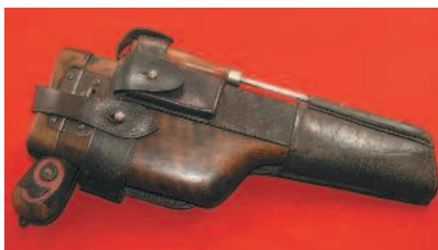
▲ Пистолет «Mauser» С 96 в кобуре, которая является также приставным прикладом. На боку кобуры-приклада имеется кожаный крепеж для шомпола.

Наиболее популярная довоенная модификация была выпущена в 1912 г. Впервые для пистолетов системы Маузера был освоен выпуск сразу двух моделей, рассчитанных на использование патронов калибра 7,63 мм (7,63×24 «Mauser») и 9 мм (9×19 «Parabellum»). Однако вскоре 9-мм патроны стали основными в германской армии, и начиная с 1916 г. все пистолеты системы Маузера (кроме экспортных моделей) выпускались под этот патрон.