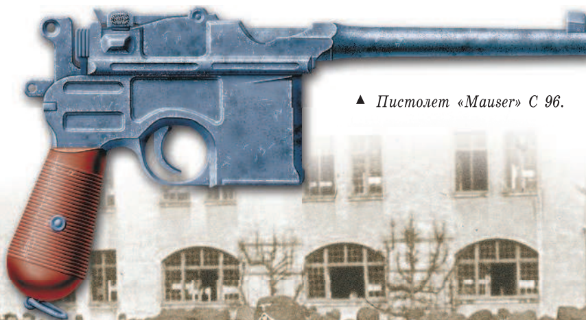
▲ Пистолет «Mauser» С 96.

К важнейшим странам, куда экспортировалось это оружие, относились также Турция, Италия, Персия (с 1935 г. Иран), Мексика и ряд других государств. До 1912 г. всего было произведено около 100 000 пистолетов «Mauser» С 96.