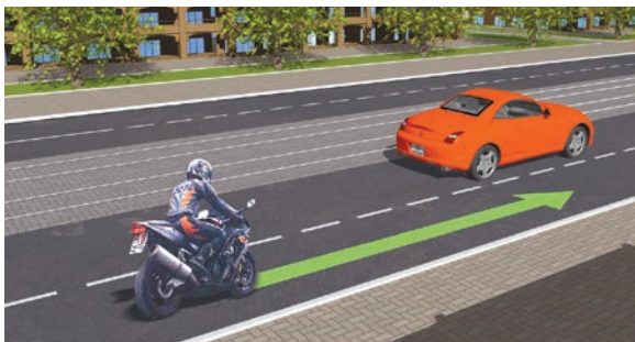
Опережение не подразумевает выезд на соседнюю полосу и может осуществляться и слева и справа

« Опережение » — движение транспортного средства со скоростью, большей скорости попутного транспортного средства.