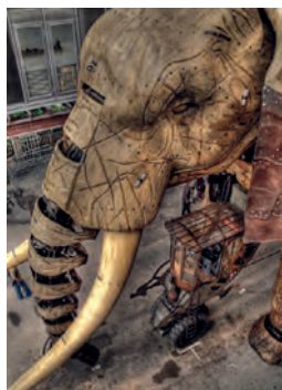
Предыдущий разворот, слева Внутренняя иллюстрация из «Парового дома» Жюль Верна, 1880 Вверху «Слон Султана» на выставке «Машины острова Нант» в Нанте, Франция

Как и Верн, Уэллс с осторожностью относился к общепринятой идее о пользе технического прогресса. Но, в отличие от Верна, Уэллс еще и стремился критиковать сложившийся порядок вещей. Особое внимание в своих книгах он обращал на классовую борьбу. Верн описывал ученых-изгоев, индивидуалистов, чьи высокомерие, самонадеянность и воображение доводили их до сумасшествия.