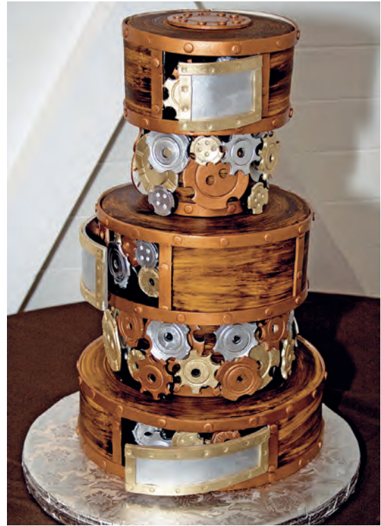
Вверху Свадебный торт в стиле стимпанк

Прошлое — это всего лишь будущее, которое уже однажды произошло.