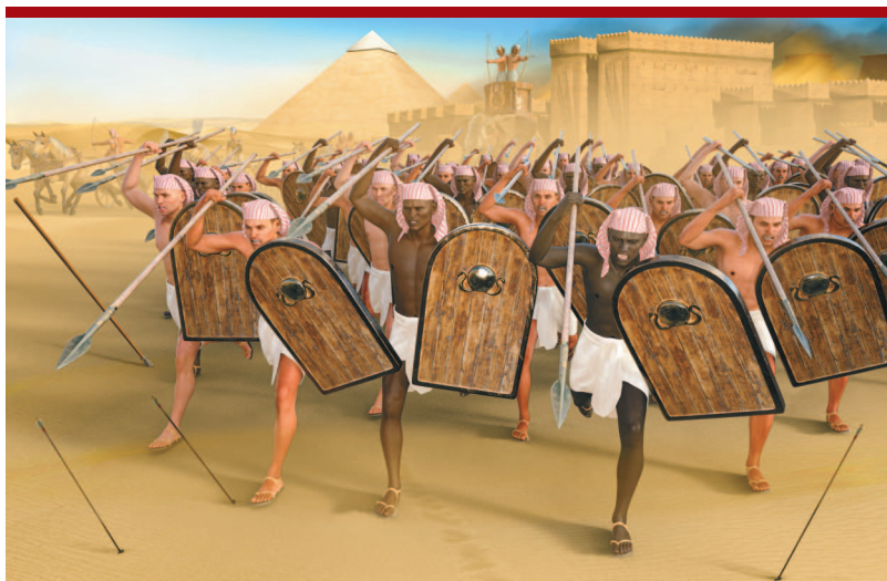
Воины Древнего Египта.

Битва при Кадеше стала поворотным моментом в отношениях между Египтом и Хеттским царством, которые перешли от вражды к сотрудничеству. Кроме того, значение битвы при Кадеше состоит в том, что она была одним из самых масштабных и подробно описанных сражений в истории Древнего Востока, которое показало возможности и ограничения военного искусства того времени.