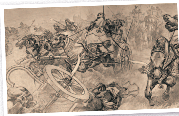
Андре Кастен. Атака персидских серпоносных колесниц.

Сражение началось атакой серпоносных колесниц, на которые Дарий возлагал особые надежды, однако македоняне были готовы к встрече с ними. Они подняли невообразимый шум, который напугал лошадей и заставил часть из них повернуть назад и врезаться в строй персидской пехоты, сея там смерть и хаос. Лишь немногим персидским колесницам удалось прорваться к македонским фалангам и нанести им урон.