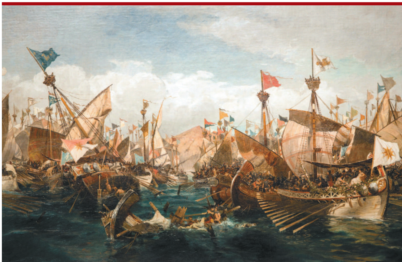
Константинос Воланикис. Морское сражение при Саламине.