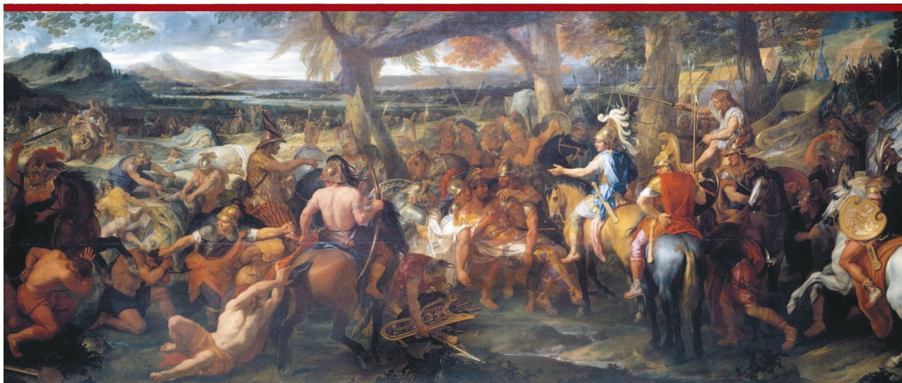
Шарль Лебрен. Александр и Пор.

Победа при Гидаспе стала заключительным аккордом почти десятилетнего победоносного похода на восток Александра Македонского. Вскоре после битвы он вернулся в Персию, где занялся внутренними делами созданной им огромной империи.