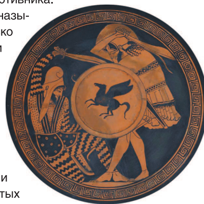
[ Греческий гоплит и персидский воин сражаются друг с другом. Изображение на древнегреческом сосуде. ]

Хотя персы были известны тем, что уважительно относились к доблестным воинам противника, Ксеркс был настолько раздосадован потерями, что приказал отрубить голову Леонида и распять его тело.