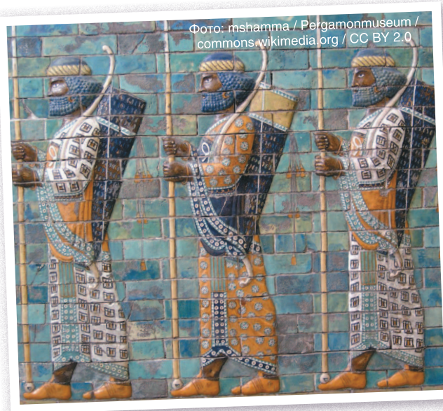
Персидские воины. Фриз из коллекции Пергамского музея, Берлин.

Афиняне захватили семь персидских кораблей, но большинство смогли уйти в море. Персы попытались обойти мыс Сунион и атаковать Афины с моря, но планы врагов были вовремя разгаданы Мильтиадом. Греческая армия совершила форсированный марш к Афинам и смогла опередить персов. Увидев перед собой готовых к бою афинян, персы отказались от планов вторжения и вернулись в Азию.