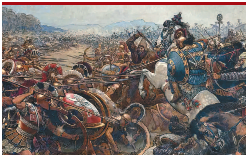
Герман Кнакфус. Битва при Марафоне (фрагмент).

Из-за явного неравенства сил в битве при Марафоне афинянам пришлось впервые поставить в фалангу рабов.