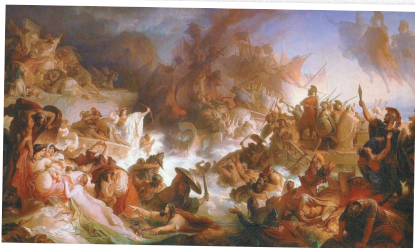
Вильгельм фон Каульбах. Битва при Саламине.

Перед атакой греки сначала немного отступили в центре своего построения, заманив вражеский флот в клещи. В ходе боя положение персов еще более усугубил поднявшийся с моря ветер — он сильно раскачивал более высокие и оттого менее устойчивые персидские корабли, разворачивал их и подставлял под тараны более маневренных греческих триер.