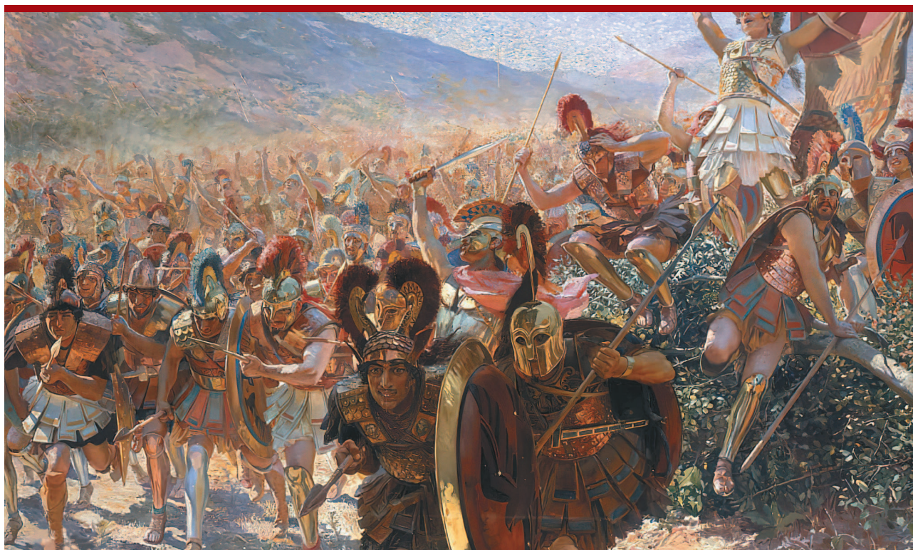
Жорж Антуан Рошгросс. Герои Марафона.