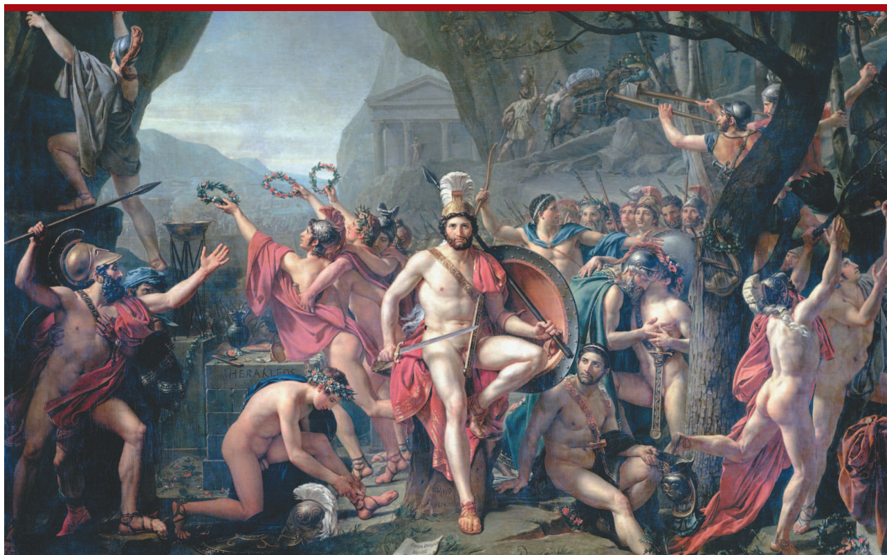
Жак-Луи Давид. Леонид при Фермопилах.