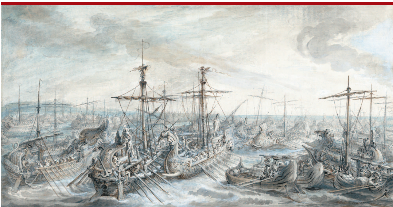
Габриель-Жак де Сент-Обен. Морское сражение у мыса Экном.