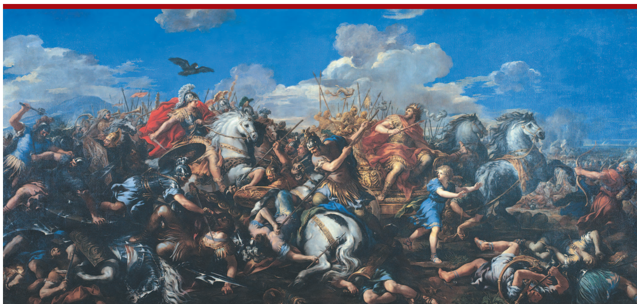
Пьетро да Кортон. Битва Александра с Дарием.