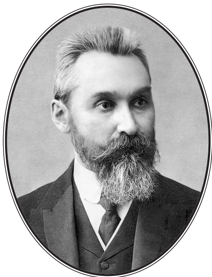
Павел Иванович Новгородцев (1866—1924)

Знаменитый русский юрист-правовед, философ, общественный и политический деятель, историк, автор книг по истории философии права.