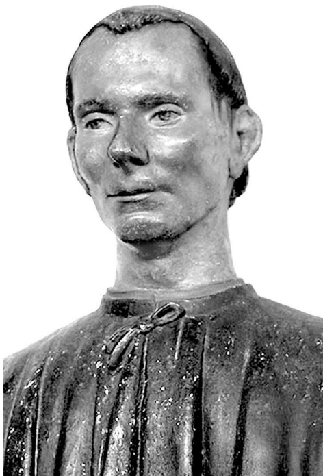
Деревянный бюст Макиавелли. XVI в.

мы видим будущего пронизательного мыслителя и тонкого аналитика. Вместе с тем перед нами раскрывается тот подготовительный процесс, которым воспитывалась политическая мысль Макиавелли.