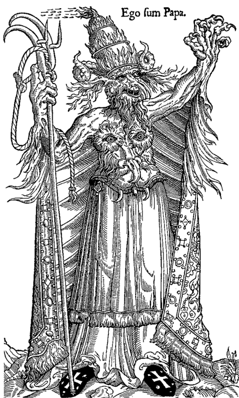
Карикатура на папу Александра VI. Генуя. Начало XVI в.

и считает его причиной гибели Италии. Все его помыслы устремлены на создание крепкого государства. Макиавелли не лучшего мнения о человеческой природе, чем средневековая Церковь. Он не верит в человека и в прочность его нравственных стремлений. Он думает, что в людях преобладают дурные влечения, что все действия их направляются пороком. Но он далек от веры Средних веков в воспитательную миссию Церкви.