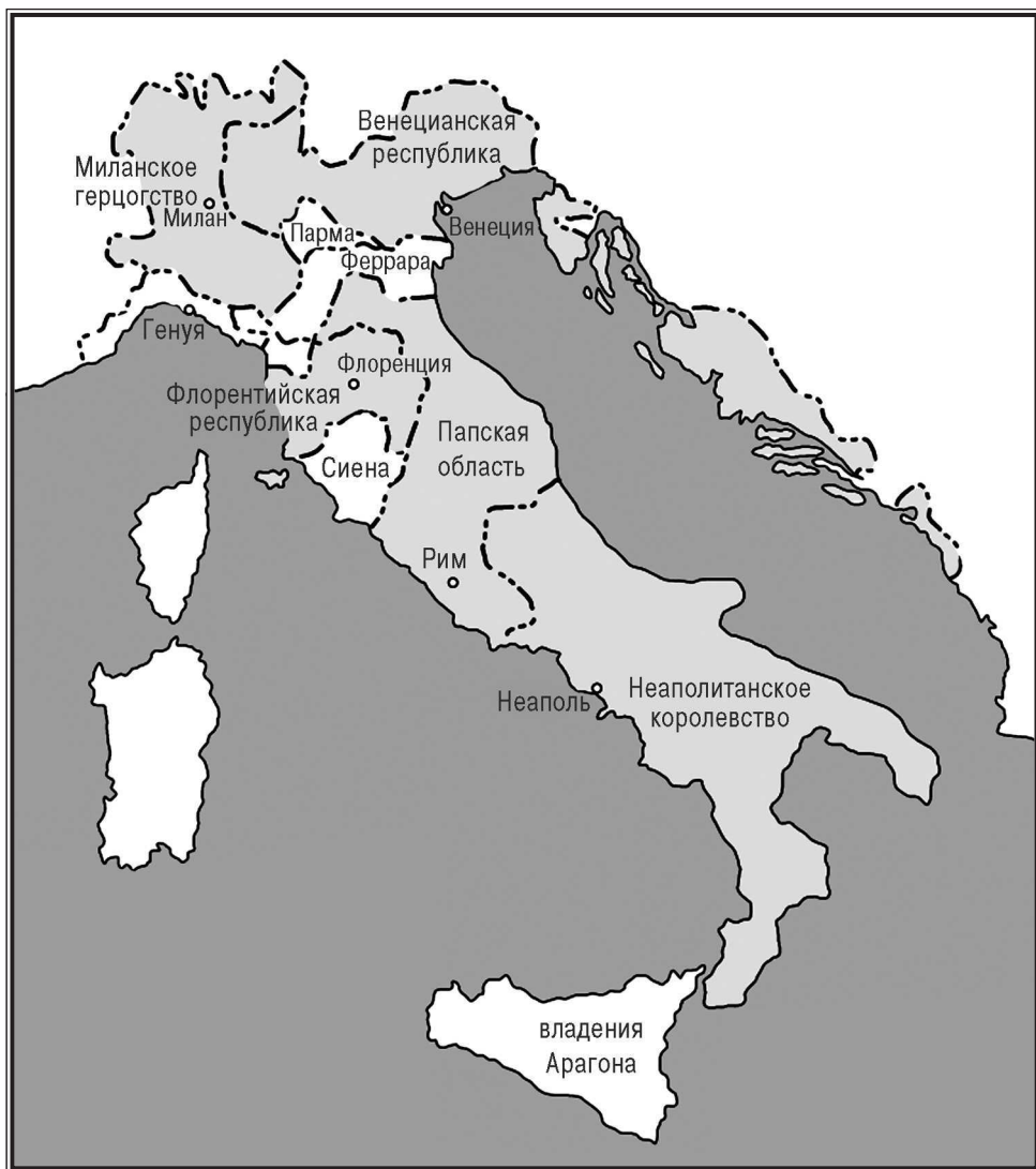
Границы итальянских государств в период существования Итальянской лиги (1454—1492 гг.)

учение классиков, но жажда привычной деятельности не покидала его. Он ищет возможности возвратиться во Флоренцию и снова поступить на службу. План этот казался ему осуществимым: многие из его прежних товарищей, служивших прежде республике, сохранили свои места и при Медичи, которые в общем управляли мягко, не прибегая к крутым переменам. Потребность служить государству побеждала в Макиавелли всякие иные соображения. Но все его искания долго оставались безуспешными. Только под конец своей жизни ему пришлось еще выполнить по просьбе Медичи несколько поручений, впрочем неважных. Но этот невольный покой, которым так тяготился Макиавелли, дал ему возможность предаться литературным занятиям и написать те произведения, которые обессмертили его имя. Поселившись в деревне, он вскоре принялся за свои политические трактаты. Позже он написал «Историю Флоренции» и несколько менее значительных произведений в прозе и стихах.