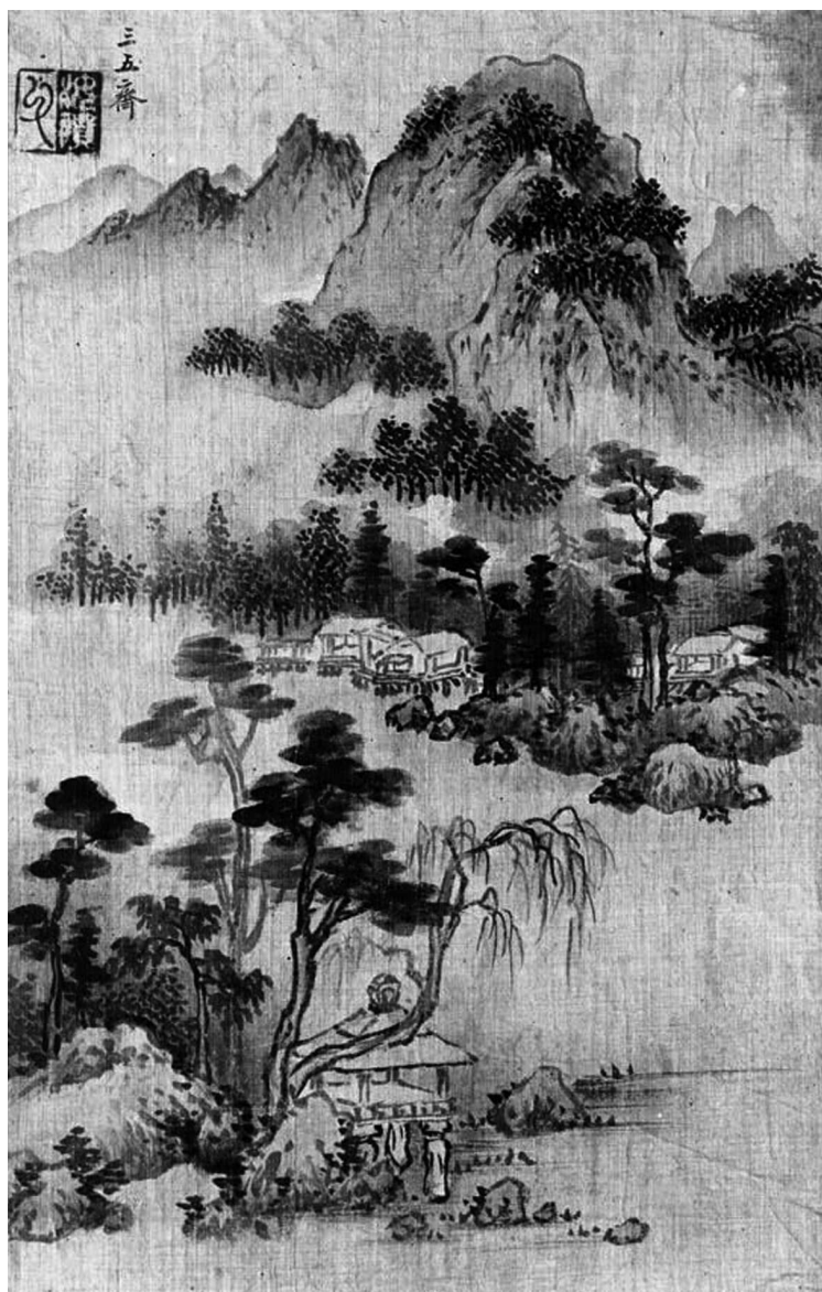
Неизвестный автор. Павильон у дерева. XVIII в.