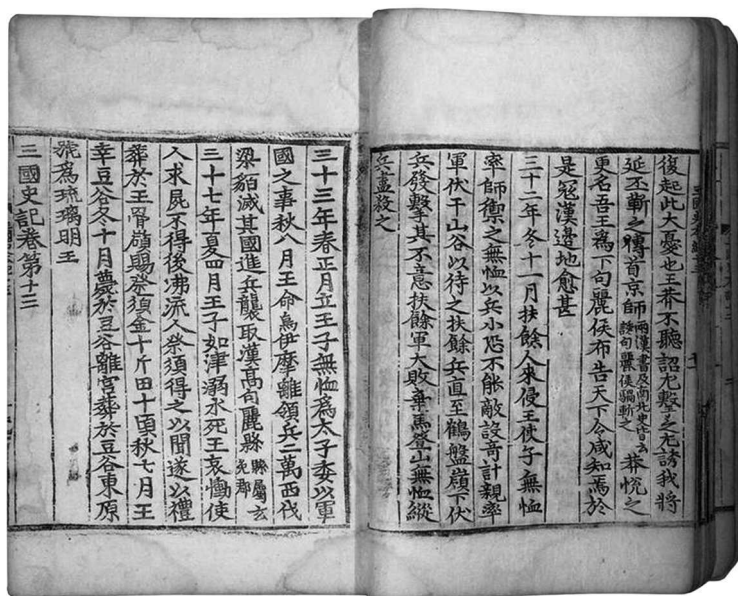
Разворот «Самгук Саги». XII в.

К особой категории источников по корейской мифологии следует отнести так называемые понпхури — песенные сказания шаманов. По большей части они передавались от человека к человеку (вернее, от шамана к шаману) в устной традиции, но с течением времени некоторые сюжеты вырывались за границы «профессионального сообщества», становились достоянием общественности и записывались. Слово «понпхури» можно примерно перевести как «разъяснение истоков», «то, с чего все началось» — это фактически синоним понятия «миф».