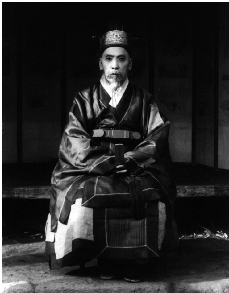
Представитель корейской знати. Фото 1910 г.

В этой книге мы по мере необходимости будем обращаться и к мифам, и к религии, и к сказке. Тем более что в корейской культуре, с большим уважением относящейся к прошлому, их «переплетение» выражено