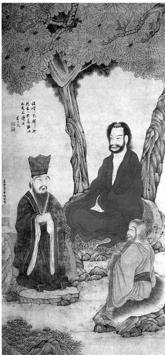
Дин Юньпэн. Мастера трех философий (Конфуций, Лао-Цзы и Будда). 2-я пол. XVI — нач. XVII в.