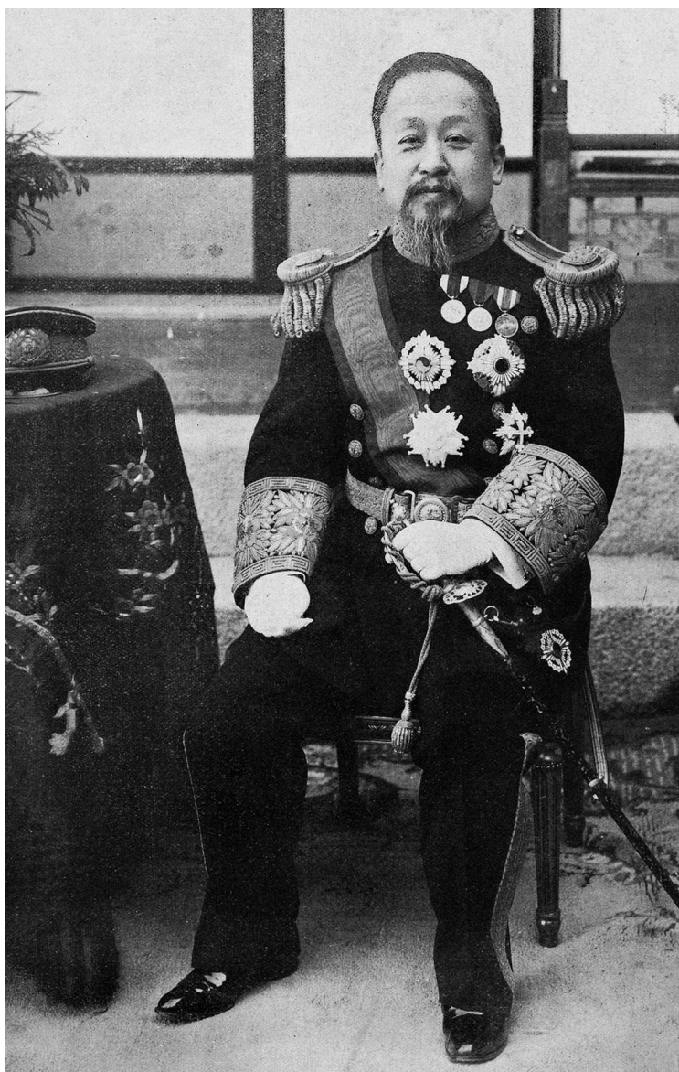
Коджон — первый император Кореи. Фото 1897 г.