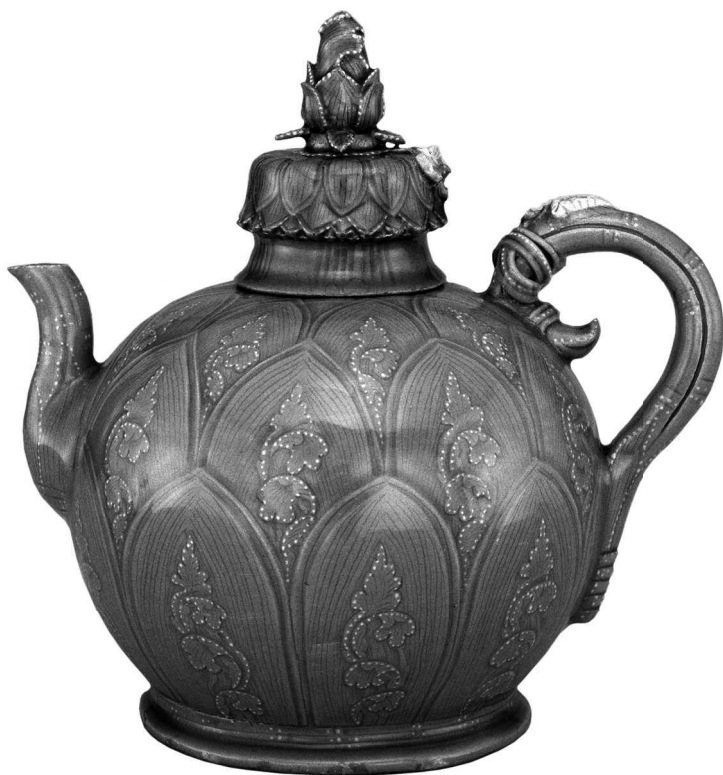
Керамический чайник периода Корё. 1-я пол. XII в.

Название «Чосон» становится также и названием страны, столицей ее объявляется Сеул. Несмотря на более или менее стабильное внутреннее положение, Чосон на разных этапах своей истории являлся данником то китайцев, то маньчжуров, то отбивался от японцев, а иногда приходилось признавать вассальную зависимость от нескольких соседей одновременно.