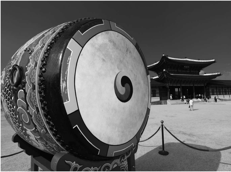
Традиционный корейский барабан-бук

Ну а с проникновением в Корею буддизма почитание дерева получило новые оттенки, ведь, как известно, именно под деревом бодхи снизошло просветление на принца Гаутаму, который благодаря этому стал Буддой.