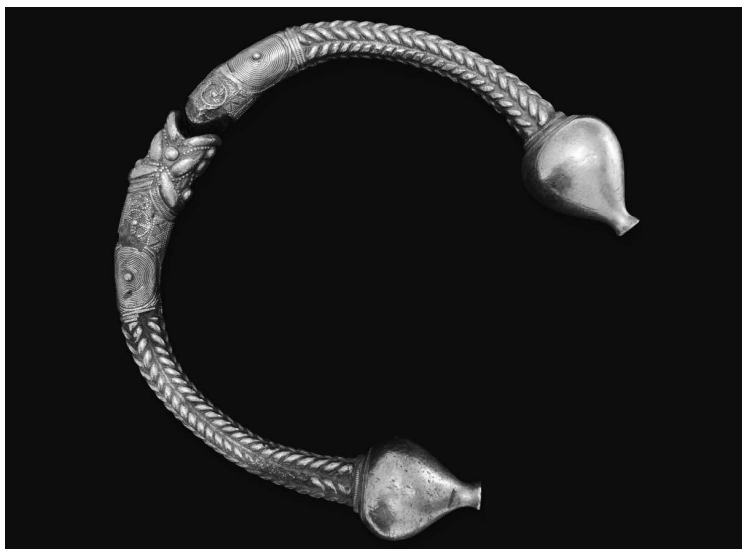
Золотой кельтский торквес. Ок. II в. до н. э.

Торквесы — шейные обручи — у кельтов были весьма распространены, как и у многих других народов. У славян аналогичные ожерелья именовались гривнами. Причем, что интересно, первоначально они являлись в основном женским атрибутом, но с течением времени превратились в украшение для мужчин, преимущественно воинов. Видимо, торквесы могли играть роль знака отличия, культового предмета или оберега, а также средства платежа — в захоронениях часто встречаются отдельные кусочки драгоценных ожерелий. Скорее всего, ими расплачивались просто как кусками драгметалла, «на вес».