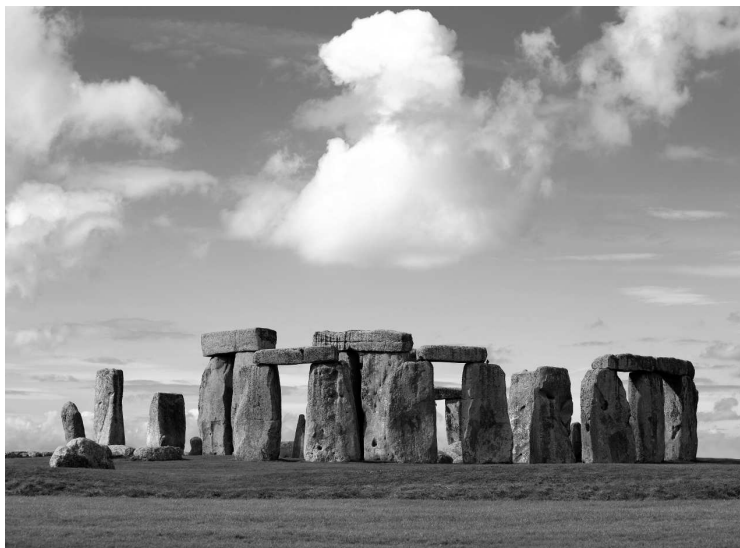
Стоунхендж. Современное фото

и бежали с поля боя. Кельты так напугали римлян, что часть горожан покинула город, а оставшиеся (и вместе с ними — остатки бежавшей армии) несколько месяцев спасались на Капитолийском холме. Рим тогда был плохо укреплен, и сеноны долго и с удовольствием жгли и грабили городские районы, правда, до Капитолия не добрались. Вернее, они несколько раз предпринимали попытки штурмовать капитолийские укрепления, но окончились они неудачей. Во время одной из таких атак, согласно Титу Ливию, римлян предупредили об опасности гуси, жившие при храме Юноны: услышав, что кельты начали карабкаться на стены, птицы начали оглушительно гоготать и разбудили караульных, которые уснули от усталости и голода. Так и возникла легенда о том, что гуси спасли Рим.