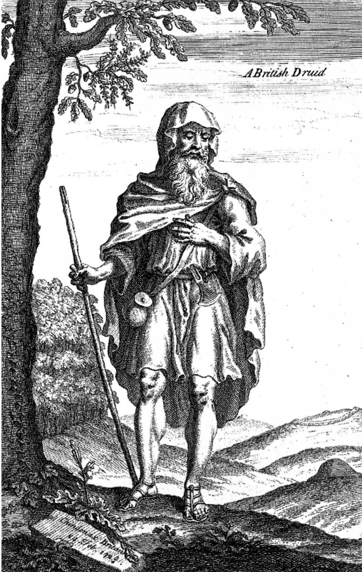
У. Стьюкли. Друид. 1724 г.