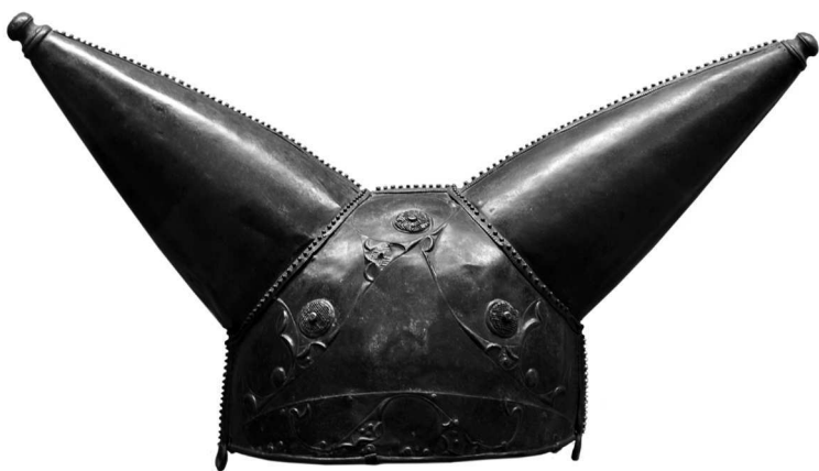
Шлем Ватерлоо. II–I в. до н. э.

Диодор Сицилийский писал: «На своих головах они носят бронзовые шлемы с большими выступающими частями, благодаря чему выглядят исполинами. Есть у них также шлемы с рогами и с изображениями различных животных». Что касается рогов, то археология не дает нам явных подтверждений словам Диодора. Кельтские шлемы могли быть довольно разнообразными по форме, но рогатых либо украшенных еще каким-то подобным образом обнаружено не так много. Например, в XIX столетии в Темзе неподалеку от места Ватерлоо был найден кельтский шлем, украшенный двумя внушительными толстыми рогами. Благодаря месту нахождения его так и назвали — «шлем Ватерлоо». Но он изготовлен из тонкой бронзы, а судя по форме — не так уж плотно сидел на голове. Поэтому археологи предполагают, что этот шлем был предназначен скорее для каких-то обрядов, а не для сражений и устрашения врага.