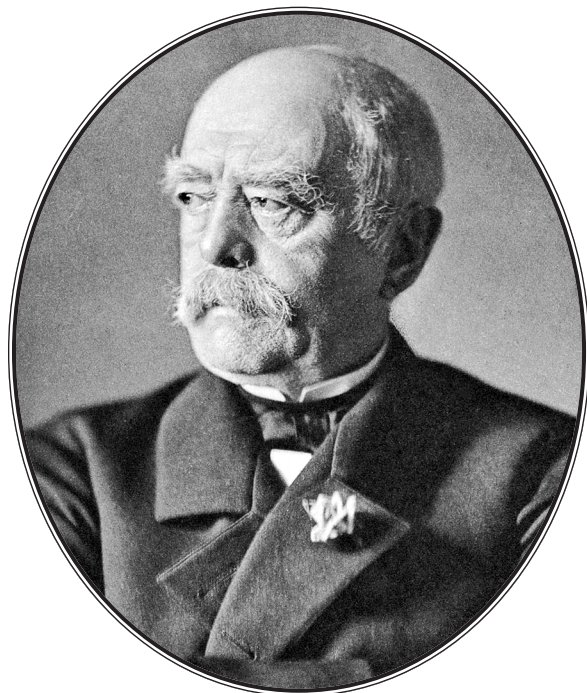
Отто Эдуард Леопольд, фюрст фон Бисмарк-Шёнхаузен, герцог цу Лауэнбург. Фотография. 1890 г.

сколь можно больше укреплять его. Укреплени-ем нашего государственного организма соответствующим режимом (внешним и внутренним) и профилактикой мы повысим его сопротивляемость как пацифистским утопиям вовне, так и марксистским лжеучениям изнутри — стало быть, уменьшим риск войны, как внешней, так и гражданской.