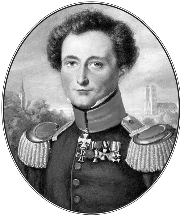
Вильгельм Бах. Портрет генерал-майора Карла Филиппа Готтлиба фон Клаузевица. 1820 г.

Ограничившись этими примерами, перейдем к рассмотрению целей войны.