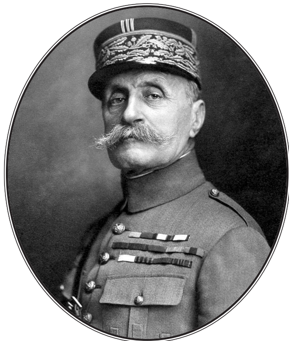
Маршал Франции Фердинанд Фош. Фотография. 1921 г.

Новые пути были найдены французской — так называемой «великой» — революцией, давшей вооруженный народ, и военное искусство возродилось в революционные и наполеоновские войны. Так было и в войну 1914—1918 гг. — войну, видевшую кульминационный пункт, но зато и вырождение вооруженных народов — «полчищ». Выход для военного искусства был найден после войны в старорусской системе сочетания идеи количества — народной армии (земского войска) с идеей качества — малой армией профессионалов (княжеской дружины). Эта старорусская система, применяемая в последний раз в 1812 г. (Кутузов и Ростопчин), именуется иностранцами — которым это простительно — и русскими невеждами — которым это непростительно — как система генерала фон Зеекта.