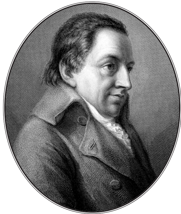
Иоганн Готтлиб Фихте.

И нигде их семя не упало в столь благоприятную почву, как в Германии. Благодаря этим