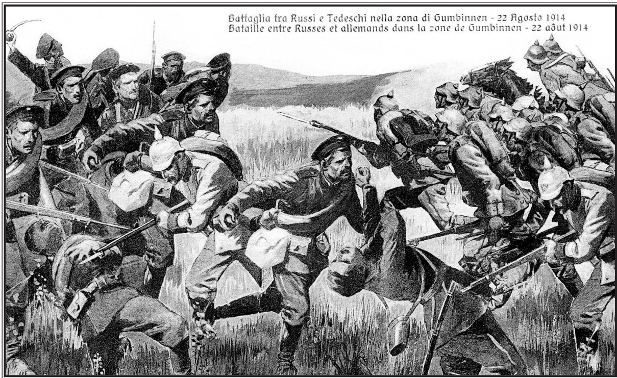
Битва при Гумбиннене 4 августа 1914.