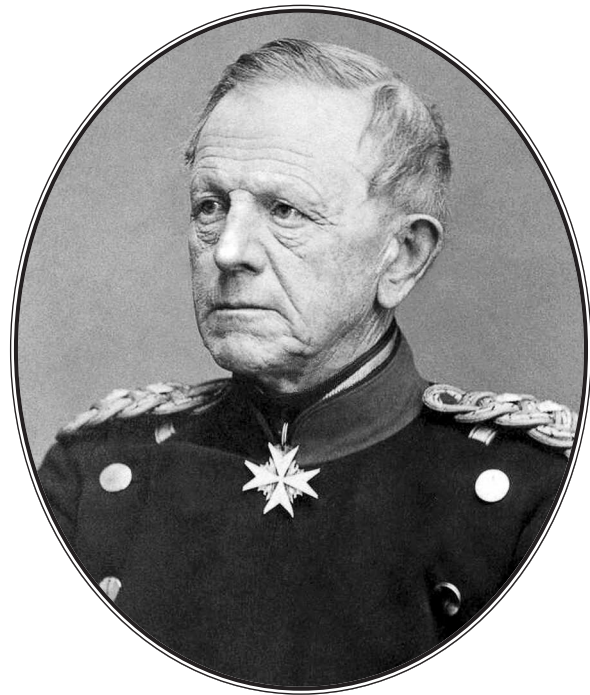
Генерал-фельдмаршал граф Хельмут Карл Бернхард фон Мольтке. Фотография. 1850 г.

Политика и стратегия, оператика и тактика — суть множители полководчества. Они представляют собой известные положительные величины. При недооценке какого-нибудь из этих множителей, умалении его, превращении его