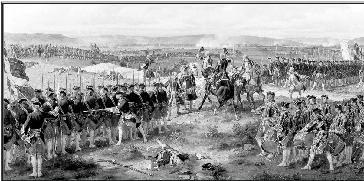
Анри Феликс Эммануэль Филиппото. Битва при Фонтенуа 11 мая 1745 г. Переговоры лорда Чарльза Хэя и графа д'Энтероша: «Господа англичане стреляют первыми!». 1873 г.

том в какую-нибудь из трех основных воинских добродетелей) она особенно высокой ценности не представляет.