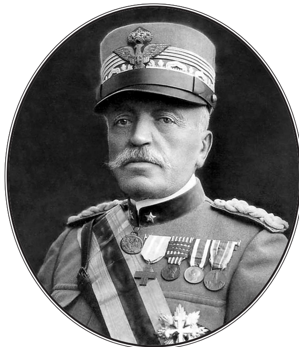
Маршал Луиджи Кадорна. Фотография. 1917 г.

Обещать немного. Но все обещанное сдерживать свято.