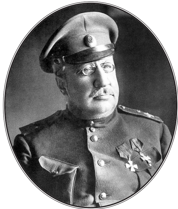
Генерал-лейтенант Владимир Зенонович Май-Маевский. Фотография. 1919 г.

Гражданская война — борьба за власть, и значение политического центра страны — «геометрического места власти», где сосредоточены все командующие страной рычаги правительственного аппарата, приобретает исключительное, первостепенное значение. В 1794 г. бретонские шуаны и вандейцы пропустили благоприятный момент для Парижского похода, что имело следствием конечную неудачу всего их движения. В 1919 г. Деникин, отдав свою «Московскую