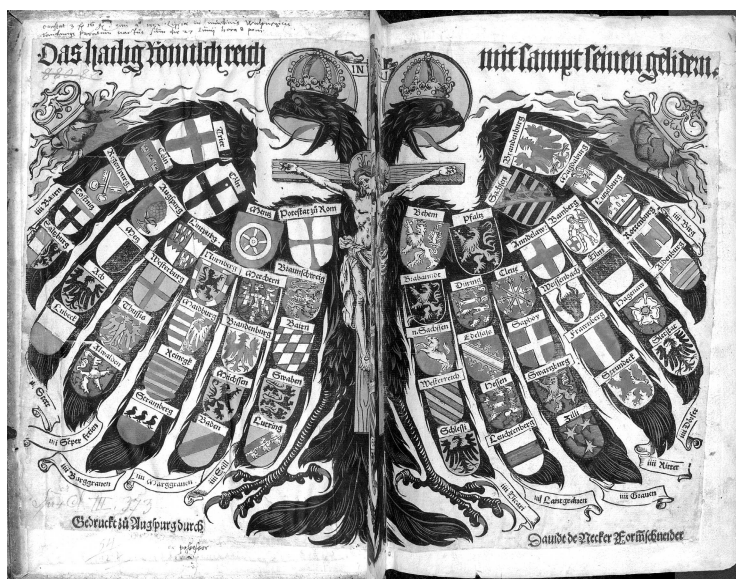
Двуглавый орел, олицетворяющий Священную Римскую империю, с гербами входящих в империю государств. Гравюра XV века

германскими державами. Если же смотреть глубоко в этнические корни, особенно так, как впоследствии это делало руководство Третьего рейха, то касаясь германского начала двух величайших германских государств могут возникнуть вопросы.