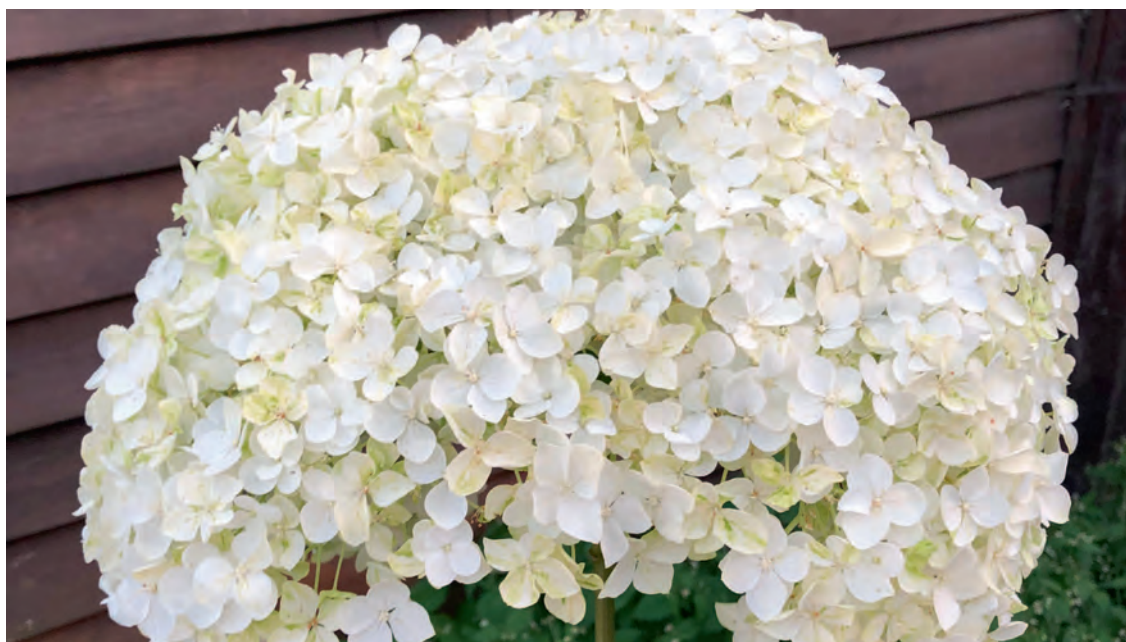
Соцветие гортензии Annabelle

Древовидная гортензия в природном ареале — небольшой кустарник высотой около двух-трех метров с полушаровидными соцветиями и округлыми листьями,