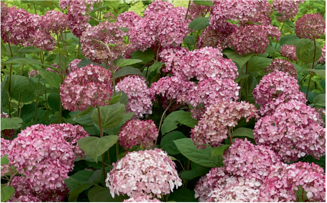
Древовидная гортензия Magical Pinkerbelle

достигающими внушительных размеров. В саду у окультуренной древовидной гортензии размеры скромнее — от одного до двух метров, чаще около полутора.