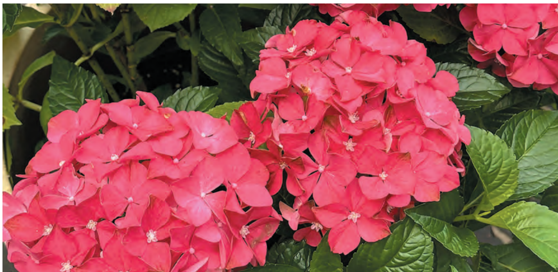
Крупнолистная гортензия Forever and Ever Red

У крупнолистных гортензий интересна не только форма, но и весьма податливый характер. Одно из замечательных свойств Hydrangea macrophylla — способность менять окраску соцветий в зависимости от кислотности почв.