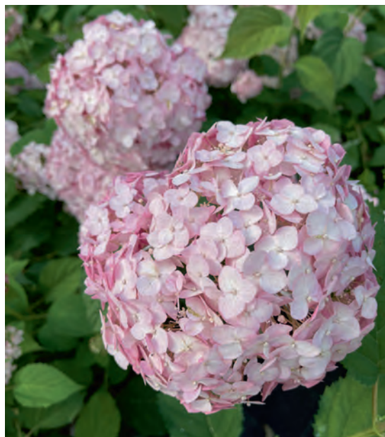
Древовидная гортензия Candibelle Marshmellow