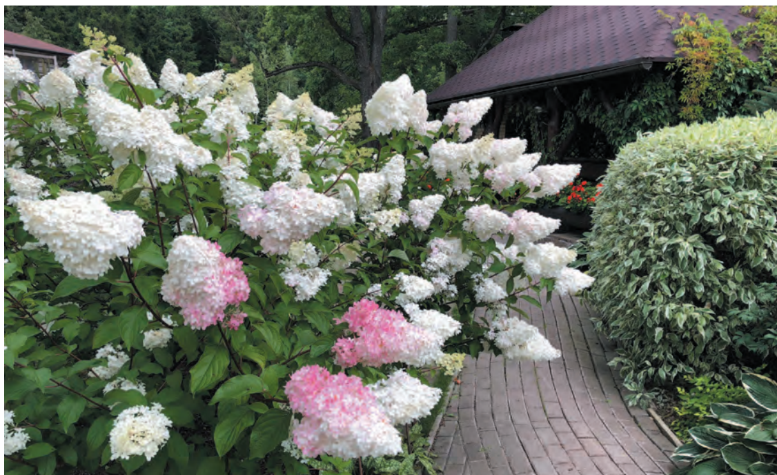
Непревзойденный сорт Vanille Fraise в цвету

Селекционеры ежегодно создают десятки новых сортов, пополняя и без того огромную коллекцию гортензий, и несмотря на это, спрос на метельчатые гортензии продолжает расти. Гортензиевая лихорадка в полном разгаре, и я с величайшим удовольствием тоже ее «подхватила».