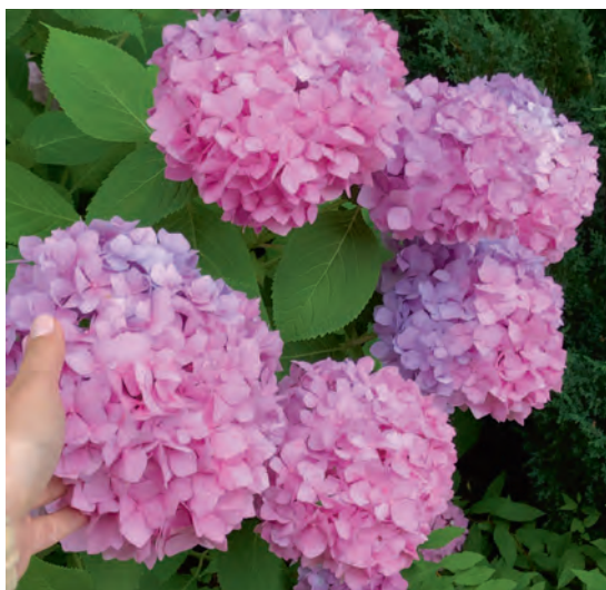
Гортензия Endless Summer

Садоводов не пугают эти многочисленные трудности, и ради умопомрачительного цветения крупнолистных гортензий их владельцы готовы на любые манипуляции. Но все же сложности выращивания крупнолистных гортензий не дают этому великолепному виду получить такое же широкое