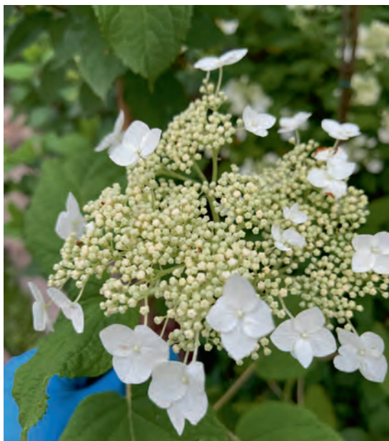
Древовидная гортензия Radiata

У большинства сортов древовидных гортензий фонтанообразная форма и довольно гибкие побеги, поэтому они могут слегка разваливаться под тяжестью крупных ша-