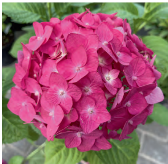
Соцветие крупнолистной гортензии