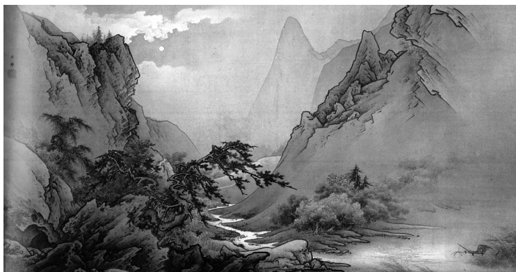
Кано Хогай. Пейзаж. 2-я пол. XIX в.

как пары мужчины и женщины. О богах-хиторигами нам мало что известно: например, «Кодзики» утверждает, что они «растворились между небом и землей». Но означает ли это, что они просто исчезли и более никак не участвовали в судьбе Вселенной? Конечно, нет. Более поздние мифы иногда отождествляют этих богов с природными силами или небесными телами.