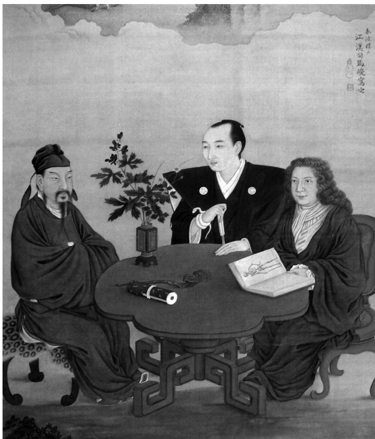
Сива Кокан. Встреча Японии, Китая и Запада. XVIII в.

ворить о том, что синтоизм представляет природу и все находящееся в ней как единое целое благодаря тому, что все и вся пронизано некоей могучей одухотворяющей силой. Отчасти поэтому в Японии такие древние и устойчивые традиции поклонения красоте природы, тяга к гармонии и совершенству.