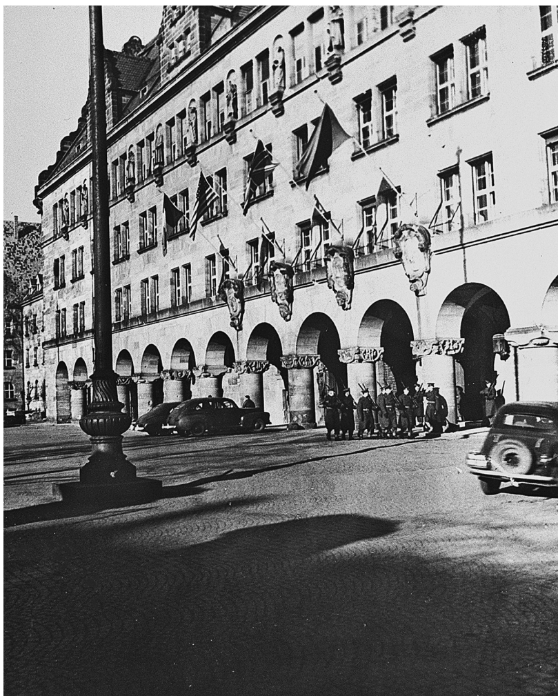
Ил. 1. Дворец юстиции в Нюрнберге, место проведения Международного военного трибунала. 1945–1946 годы.

и на Белорусском фронте. Он видел, что может сделать война. Но его все равно ошеломило увиденное. Нюрнберг почти сравняли с землей периодические бомбардировки союзников и уличные бои. Средневековый центр и современные части города были обращены в кучи щебня и мусора. Перед отъездом из Москвы Кармен смотрел немецкие кинохроники и документальные