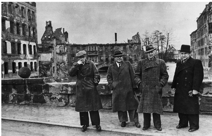
Ил. 2. Роман Кармен (второй справа), Всеволод Вишневский (второй слева) и другие советские корреспонденты в свободное время изучают развалины Нюрнберга. 1945–1946 годы.

делегацией он контролировал поток информации, предоставляя Никитченко и Руденко деликатные сведения о советском прошлом (в том числе детали советско-германского сотрудничества) строго в минимально необходимом объеме. Он прилагал все усилия, чтобы в зал суда не просочились свидетельства собственных военных преступлений СССР.