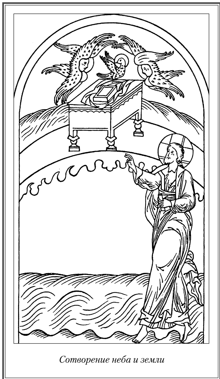
Сотворение неба и земли