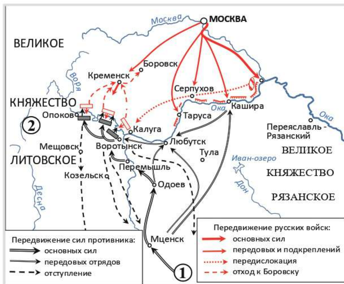
Схема к заданиям 8–10