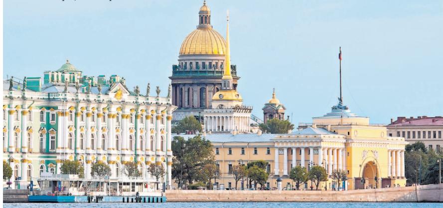
Зимний дворец и Адмиралтейство

Пройдя под арками, мы выходим на Дворцовую площадь – главную площадь города. Одна из главных особенностей этой площади – ее удивительный ансамбль зданий, строившихся в самых разных стилях на протяжении почти ста лет, однако воспринимающихся как единое целое. Прямо напротив нас стоит самое старое строение – Зимний дворец ( Дворцовая пл., 2 ). Огромный дворец строился для императрицы Елизаветы Петровны ее любимым архитек-