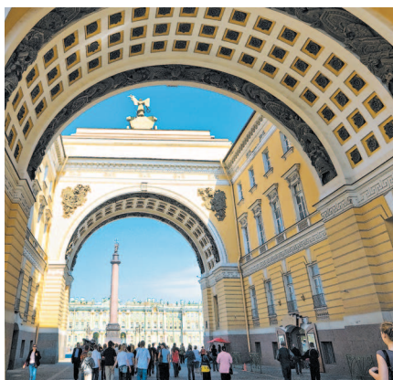
Арка Главного штаба

Панораму Большой Морской улицы завершает арка Главного штаба . На самом деле арок используется сразу две.