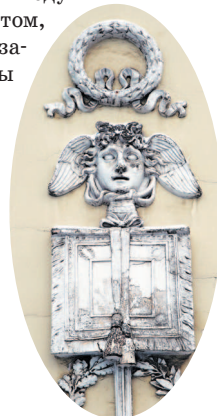
Двуглавый орел, переделанный в советское время в голову Медузы, на здании штаба Гвардейского корпуса

Теперь свернем направо, на Миллионную улицу. По левую