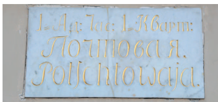
Самая старая адресная доска Петербурга

Миновав Малый Эрмитаж, мы вновь возвращаемся (но уже с другой стороны) к зданию Зимнего дворца. Пройдя вдоль него, мы выходим к перекрестку Дворцовой набережной и Дворцового проезда. Улица эта отделяет нас от здания Главного Адмиралтейства ( Адмиралтейская наб., 2 ). Перейдя улицу и осмотрев один из павильонов Адмиралтейства, двинемся вдоль здания