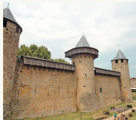
■ Двойной ряд оборонительных стен и башен делал замок Каркассон практически неприступным. Именно благодаря тому, что многие средневековые города, и уж тем более замки, были надежно укреплены, они не были захвачены врагами во время многочисленных войн, и благодаря этому сохранившиеся в них манускрипты не пострадали и дошли до нашего времени.