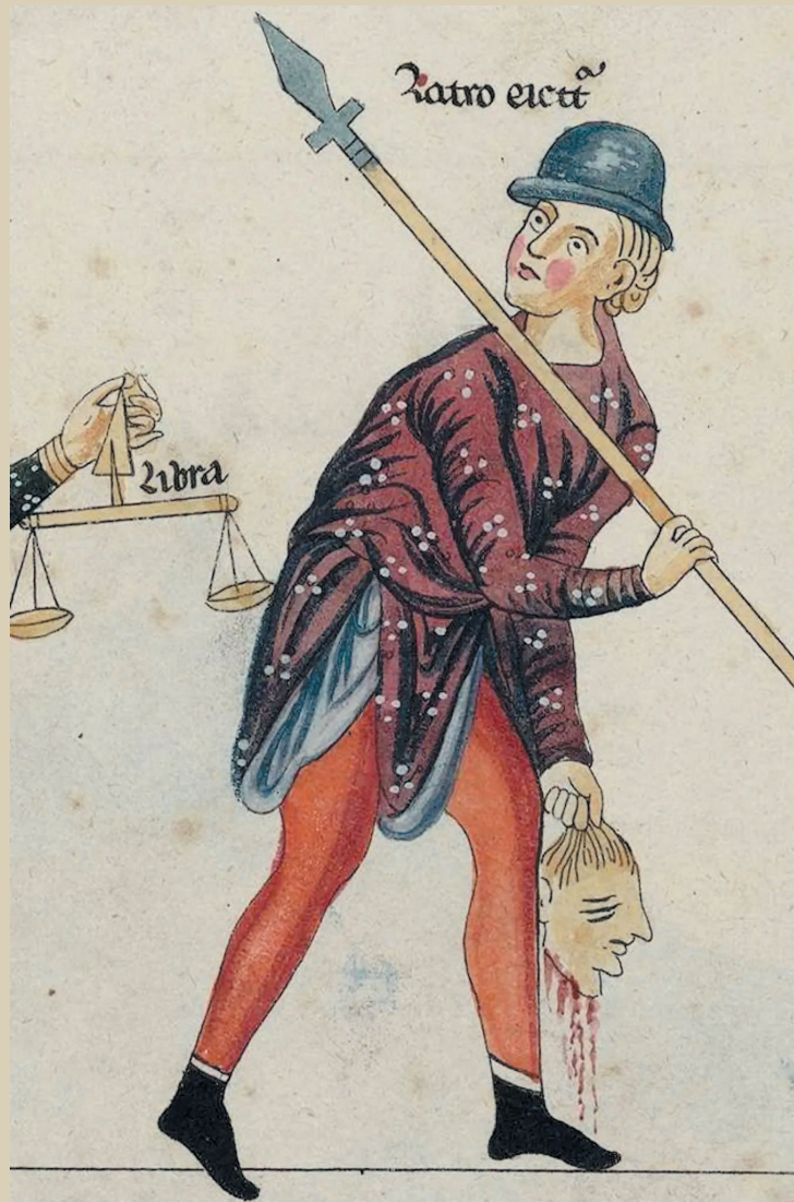
■ «Крылатое копье». Фрагмент миниатюры из манускрипта Геррады Ландсбергской «Сад наслаждений», 1195 г. Эльзасская библиотека Креди Мютюэль, Страсбург, Франция