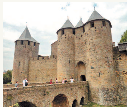
■ Замок Каркассон на юге Франции. Видна надстроенная часть стен и башен на их древнем основании.

очень большом количестве и дошло до наших дней. Это книги духовного содержания: библии и молитвенники, псалтири и часословы, а также сборники поэтических произведений и романы — да-да, романы начали писать уже тогда, а также бестиарии (книги о животных) и всевозможные наставления по ратному делу. И книг этих, без преувеличения, многие тысячи, причем, кроме тех, которые являются украшением современных музеев и библиотек, есть немало пылящихся на чердаках все в тех же замках, не разобранные и не исследованные их хозяевами, ведь в отдельных замках семьи их владельцев живут до сих пор! А ведь есть еще и документы из архивов. Сохранившиеся до наших дней письма и расписки, доклады настоятелей монастырей и отдельных монахов, переданные в Ватикан и... шпионские донесения, договоры между феодалами и городами, купчие и заемные письма, описи имущества все тех же замков и... предсмертные завещания. Вообще всего, что изложено на бумаге, вполне достаточно, чтобы представить себе Средневековье во всем его блеске и многообразии. Вот только далеко не всегда современные люди видят все эти книги, их яркие и красочные иллюстрации, не потускневшие за века. Именно поэтому они чаще всего и представляют его довольно «темным и мрачным», хотя на самом деле все было далеко не так. Впрочем, сегодня мы можем это исправить и показать нашим читателям пусть и не все, но многие средневековые иллюстрации из рукописных манускриптов.