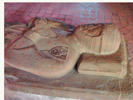
■ Верхняя часть эффигии из замка Каркассон.