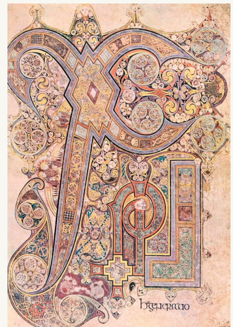
■ Лист 291 «Келльской книги», содержащий портрет Иоанна Евангелиста. Библиотека Тринити-колледжа, Дублин

То есть не было еще ни рыцарей, ни замков. Но трудолюбивые монахи уже создавали такие прекрасные произведения книжного искусства, что они и сегодня поражают наше воображение.