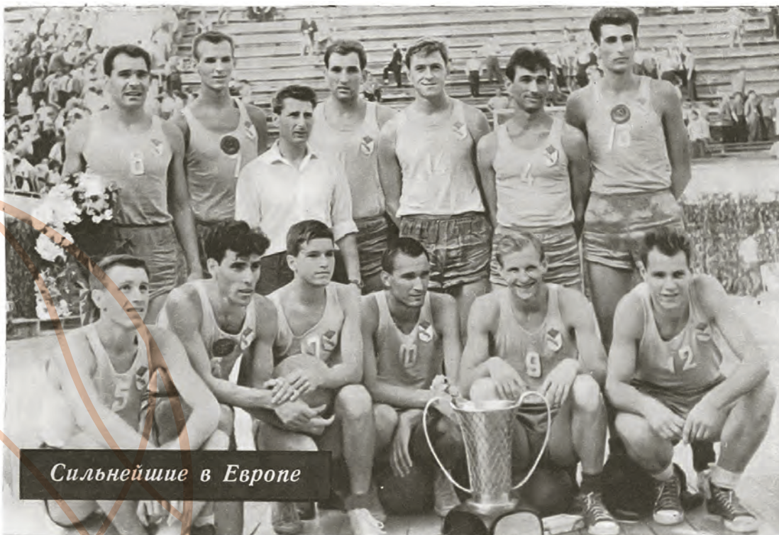
Сильнейшие в Европе

А ведь мы просто были обязаны избежать третьего матча, но на глазах изумленных и потрясенных 20 тысяч болельщиков сделали все возможное для того, чтобы он состоялся.