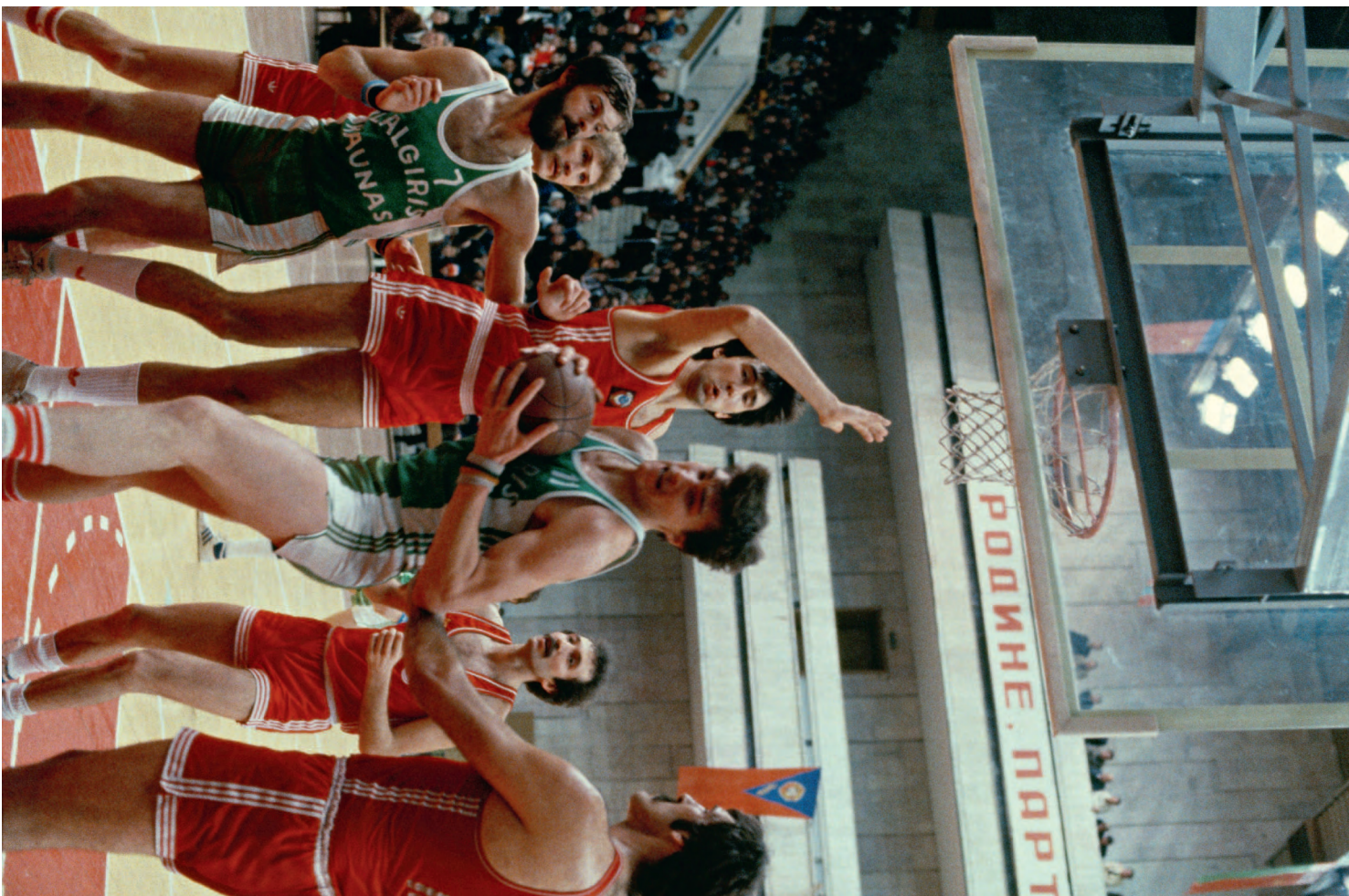
Главное противостояние 80-х: Арвидас Сабонис (с мячом) и его "Жальгирис" против ЦСКА