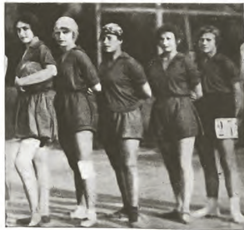
Вверху: команда Москвы, выигравшая первенство СССР; внизу слева: команда Урала, игравшая в финале с Москвой; справа: женская команда Москвы, выигравшая первенство СССР.