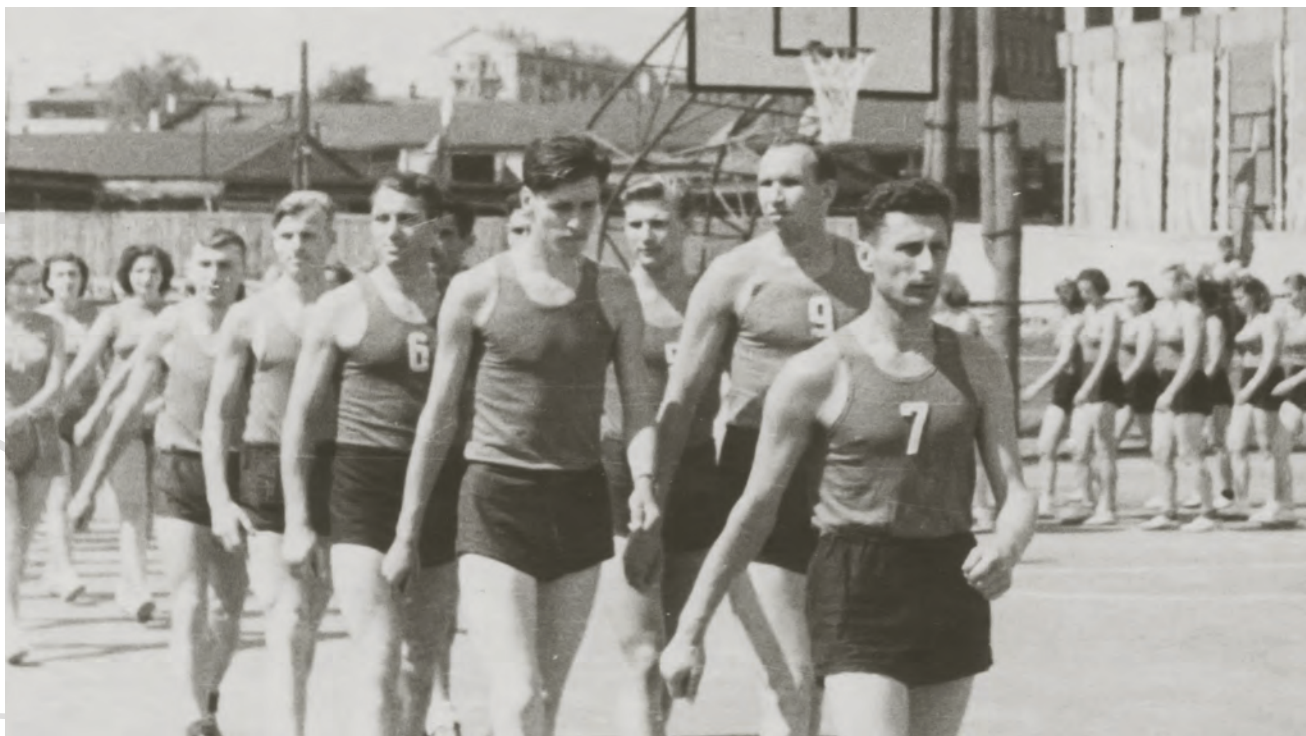
Во главе колонны сборной Москвы

Удивительно: с 1937-го по 1954-й год он принимал участие в 26 турнирах за московские клубы и сборную Москвы. И только однажды остался без медали!