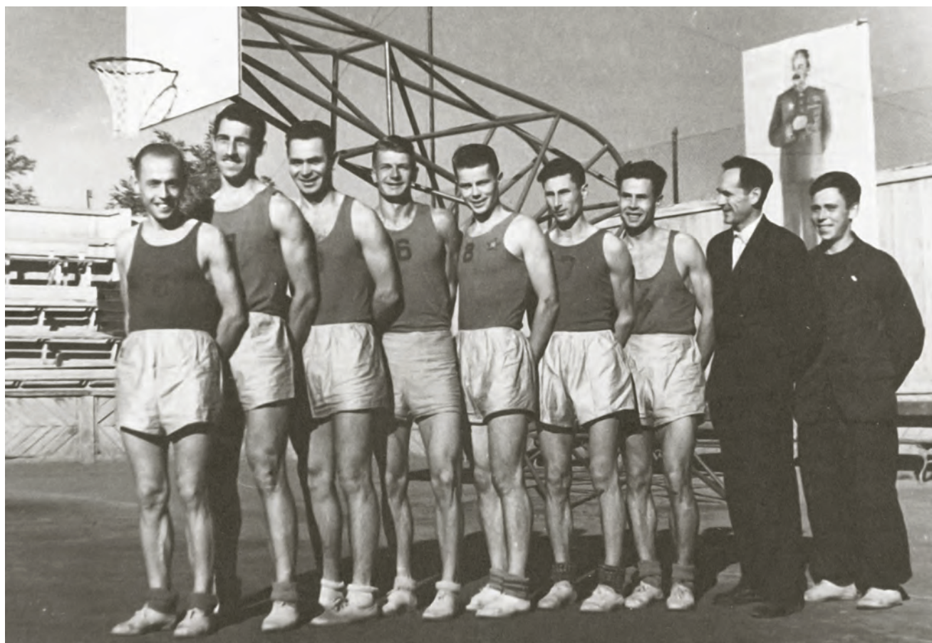
1945 г. Армейцы — первые чемпионы СССР

Похоже, историки забыли, что сразу после войны к розыгрышам медалей все-союзных первенств подключились команды сильнейших баскетбольных стран Европы (уже советских республик) — Литвы, Латвии и Эстонии.