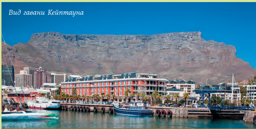
Вид гавани Кейптауна

Каждый год с октября по март город заполняют туристы, приезжающие понежиться под теплым летним солнцем южного полушария. Помимо неперемного подъема на фуникулере на Столовую гору (высота 1087 м), гостям можно порекомендовать совершить экскурсию в прибрежный район Виктория и Альберт. Здесь находятся недавно отреставрированные гавань и причалы, а также два исторических дока в заливе Тейбл-Бей, а на прилегающих улочках расположились всевозможные сувенирные лавки, музеи, отели и рестораны. Неподалеку находится гавань для яхт, «Аквариум двух океанов» и театр под открытым небом.