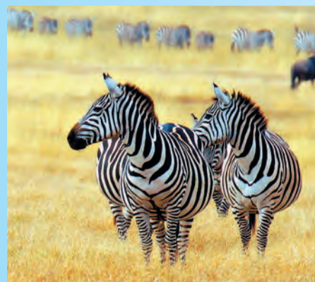
Зебры в парке Серенгети

В Африке расположены уникальные природные зоны с красивой и дикой природой. На севере это пустыня Сахара, а на востоке и юге африканского континента — многочисленные заповедники и национальные парки, внесенные в Список Всемирного культурного и природного наследия человечества и призванные сохранить уникальный животный и растительный мир континента.