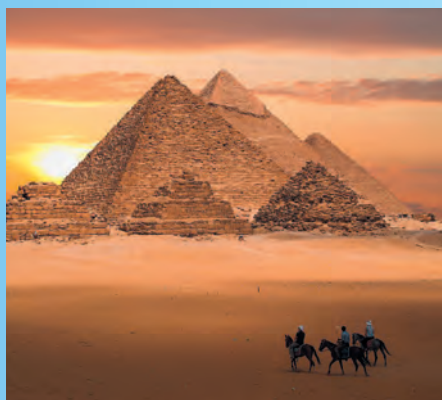
Знаменитые пирамиды в Гизе (Египет)

Африка является колыбелью человечества со многими памятниками культуры. Именно поэтому тысячи людей срываются с насиженных мест и едут сюда, чтобы прикоснуться к древнейшей культуре, своими глазами увидеть пирамиды, дикий затерянный город и храмы. Бесконечное восхищение чудесами Африкой не пройдет никогда.