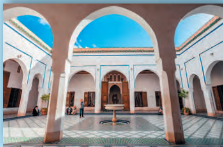
Дворец Бахия в Марракеше