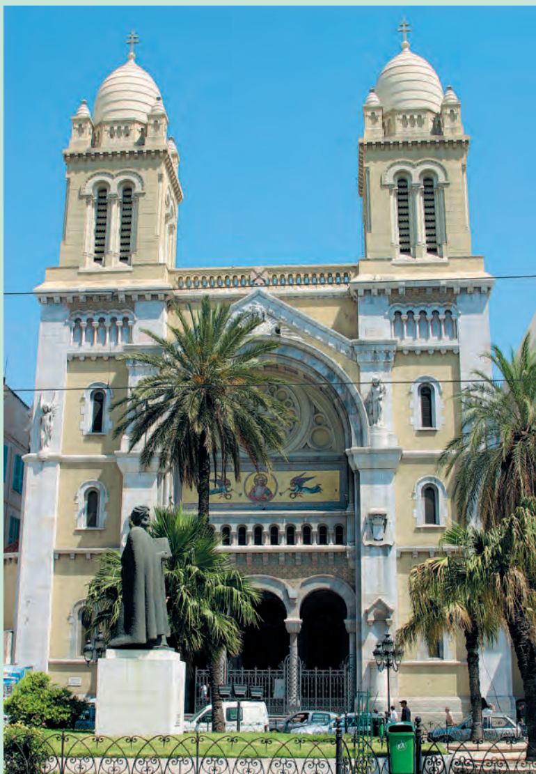
Собор Сент-Винсент де Поль — самое крупное здание колониального периода, сохранившееся в Тунисе. Собор был возведен в XIX в., а в его архитектуре сочетаются элементы готического, мавританского и неовизантийского стилей. Внутреннее убранство храма поражает своей изысканностью, насладиться которой можно в любой день.