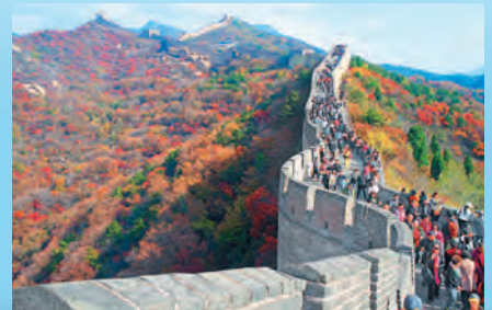
Великая Китайская стена