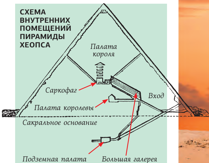
СХЕМА ВНУТРЕННИХ ПОМЕЩЕНИЙ ПИРАМИДЫ ХЕОПСА

Лучшее время для экскурсии в Гизу — период с декабря до февраля, однако вечером может быть прохладно. Многим нравится ранневесенний климат Гизы. На улицах уже заметно теплее, но до 50-градусной жары еще далеко.