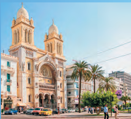
Собор Сент-Винсент де Поль в столице Туниса

Попытаться найти некий универсальный образ африканских городов — задача бесполезная, так как страны на этом континенте слишком разнообразны и многолики. В регионе Сахары облик городов с их мечетями, минаретами и европейскими кварталами оживляет влияние арабской и колониальной культур. Напротив, на юге Африки доминируют современные очертания и четкие контуры горизонта.