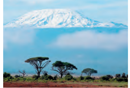
Гора Килиманджаро (Танзания)

Эта прекрасная, заслуживающая внимания книга раскрывает перед путешественниками душу самых разных мест мира.