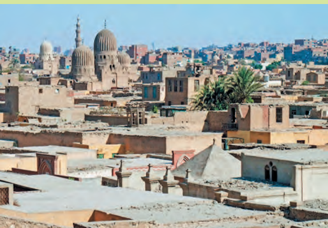
Город мертвых, Имам аль-Шафей — обширное и самое старое кладбище в Каире