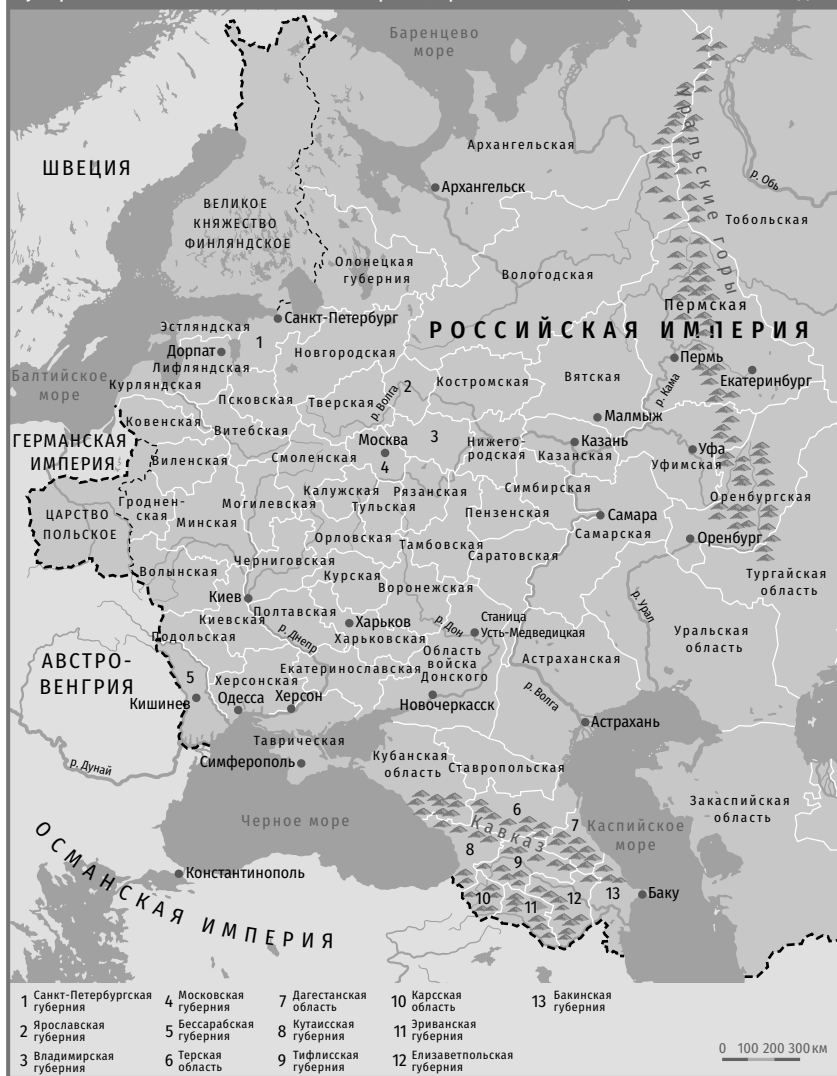
Карта 1. Губернии и области Российской империи (Европейская Россия), начало 1880-х