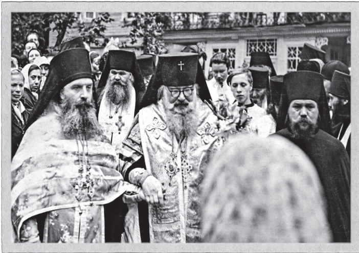
Архиепископ Псковский Иоанн (Разумов) с архимандритом Алипием (Вороновым)

стали устраивать безобразия в храмах во время богослужения, попытки сопротивления приводили к закрытию храмов. Еще 16 мая 1959 года патриарх Алексий и митрополит Крутицкий Николай обратились с письмом к Н. С. Хрущеву, в котором сообщали о незаконном закрытии храмов, оскорблении религиозных чувств духовенства и верующих, о травле, незаконных административных мерах против Церкви. Это письмо, как и ряд других обращений, осталось без ответа.