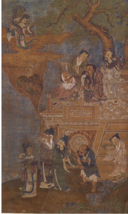
Восемь бессмертных. Художественный музей Уолтерса, США

противопоставлять свою волю течению естественной жизненной силы, возникла смерть. Таким образом, даосы воспринимают смерть как противоестественный феномен, противоречащий изначальной гармонии мира, поэтому цель жизни — возвращение к этой первоначальной гармонии и, следовательно, вечной жизни.