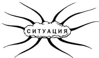
Карта изменения ума № 1. Ваша ситуация

На каждой из линий расположите по одному слову, которое описывает вашу нынешнюю ситуацию перемен.