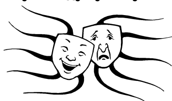
Карта изменения ума № 2. Ваши чувства

На каждой из линий поместите по одному слову (или рисунку), которые бы выражали ваши чувства — как очевидные, так и скрытые.