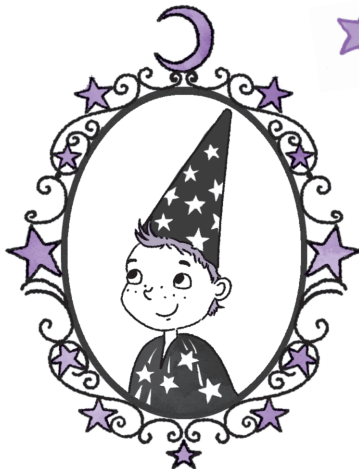
Мой братик Уилбур Луч