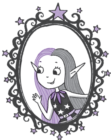
Я! Мирабель Луч