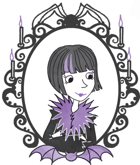
Моя мама Серафина Луч