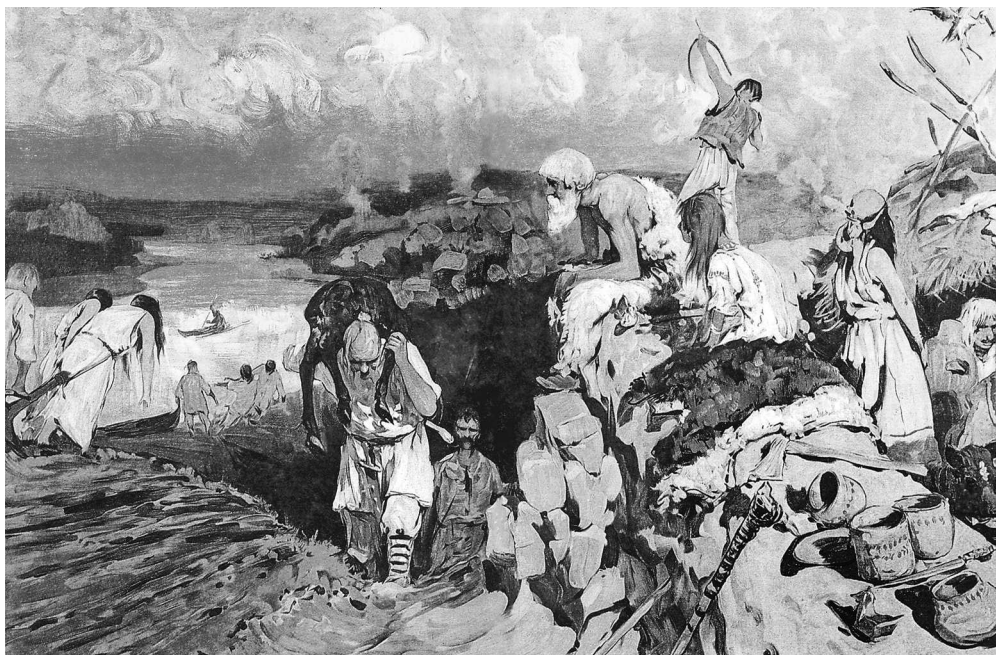
С.В. Иванов. Сцена из жизни восточных славян

них был Перун, бог грома и молнии; — поклонялись также солнцу под разными именами (Дажбога, Волоса), огню, ветру. Верили в загробную жизнь, думали, что души умерших могут есть, пить, и потому считали обязанностью угощать их. Общественного богослужения, храмов, жрецов у них не было; старшины или родоначальники были и жрецами, приносили жертвы.