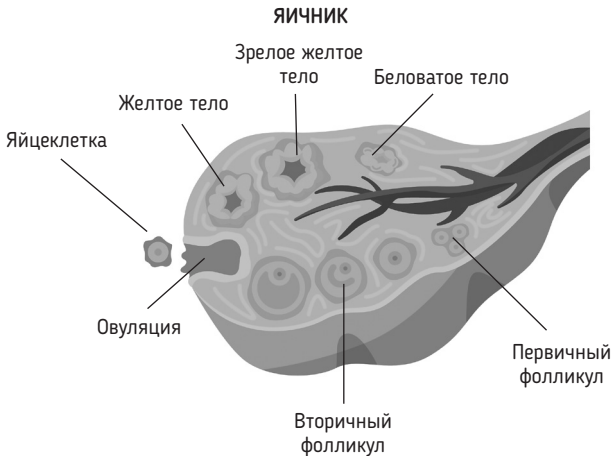
Рис. 2. Рост фолликулов в яичнике. Формирование доминантного фолликула. Овуляция. Образование желтого тела