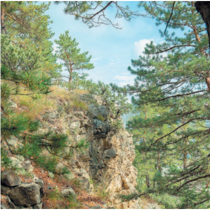
Сосновый лес в горах.