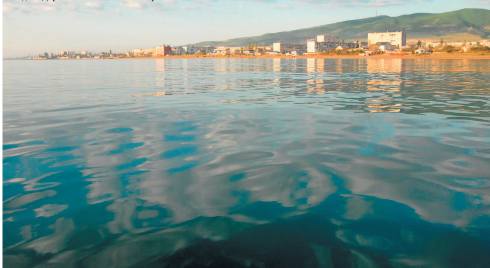
Вид на Дербент с Каспийского моря.

Удивительный обитатель Каспия – каспийский тюлень, или нерпа. Это редкий вымирающий вид, реликт ледникового периода. Селится он по берегам. Зимой тюлени мигрируют в северную, замерзающую часть. Могут подниматься по руслу рек, добираясь, иной раз, до Волгограда. Тюлени живут стаями. Численность их была велика. В начале XX века насчитывалось до миллиона особей. В конце 1980-х годов их было уже 400 тысяч, в 2008-м – 100 тысяч, в 2019-м – 43–66 тысяч. Вымирание, скорее всего, вызвано загрязнением моря нефтепродуктами.