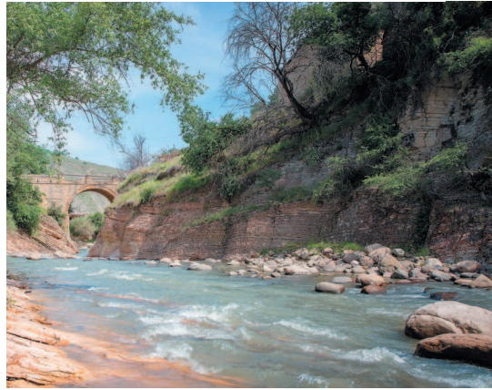
Река Уллучай имеет длину 111 км, а площадь ее бассейна – 1440 кв. км.

Каспийское море не такое соленое, как Черное или Средиземное.