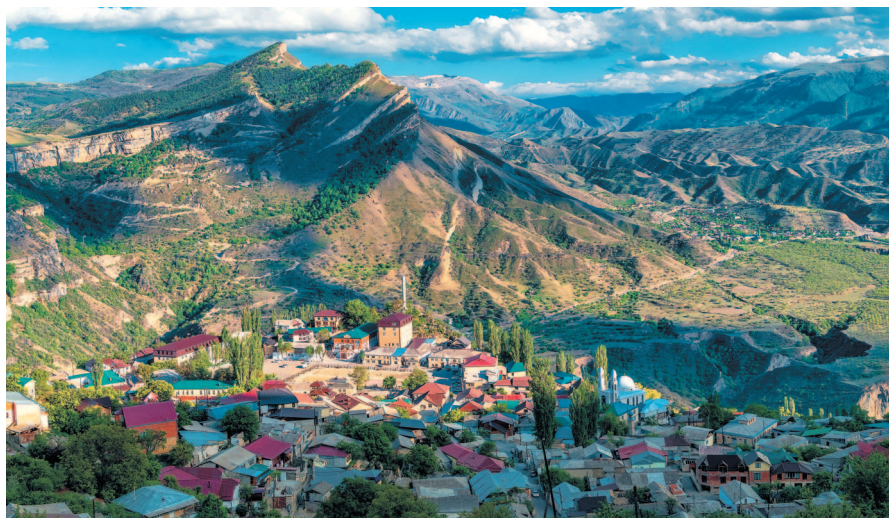
Горный хребет и красивая долина с селом.

Поскольку горообразование здесь находится в активной фазе, Дагестан является сейсмичным регионом. Мощное землетрясение 1970 года разрушило множество зданий в Махачкале, а в почве образовались трещины.