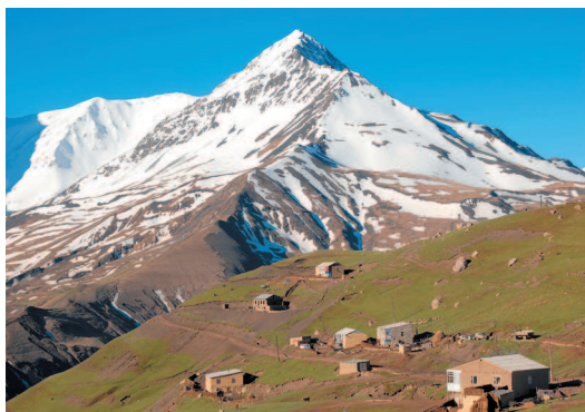
Село Куруш (самая южная точка России и самый высокогорный населенный пункт Европы, 2560 м) и гора Базардюзю (4466 м).

Самая высокая часть Дагестана – Боковой хребет. Перемычками он соединяется с Главным Кавказским хребтом, а между перемычками лежат труднодоступные котловины, днища которых находятся на высотах 1200–1700 метров. Рельеф здесь уже типично альпийский, с серыми скалистыми пиками и заснеженными гребнями.