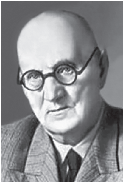
Рис. 1.2. В.Ф. Зеленин (1881–1968)