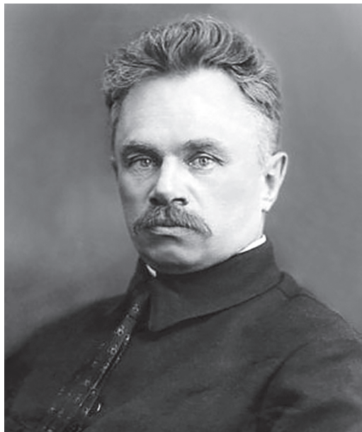
Рис. 1.3. Д.Д. Плетнев (1872–1941)

ной недостаточностью (СН). За достижения в области аритмологии, ревматологии и изучении сепсиса Д.Д. Плетнев был избран почетным членом Объединенного общества терапевтов и педиатров Берлина и Мюнхенского терапевтического общества.