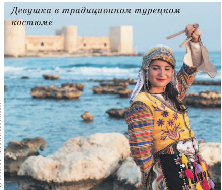
Девушка в традиционном турецком костюме

Турки будут приятно удивлены, если вы употребите всего пару слов на турецком. Например, «Мераба» значит «Здравствуйте». В неформальной обстановке можно использовать «Селям», что переводится как «Привет». Уходя, скажите «Ийи гюнлер», что означает «Всего хорошего». «Спасибо» звучит как «Тешеккюр эдерим», а «Пожалуйста» – «Лютфен».