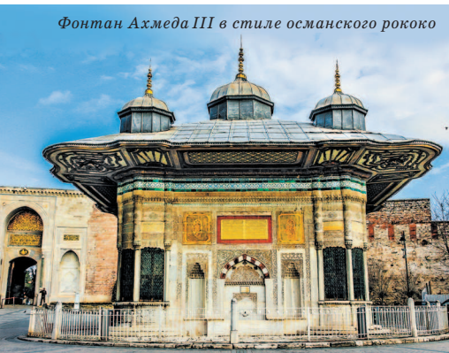
Фонтан Ахмеда III в стиле османского рококо

и большой черный крест, выполненный в технике мозаики на золотистом фоне, и так называемый синтрон (пять рядов сидений, охватывающих апсиду, где во время службы располагалось духовенство). В наши дни помещение церкви используется для проведения концертов.