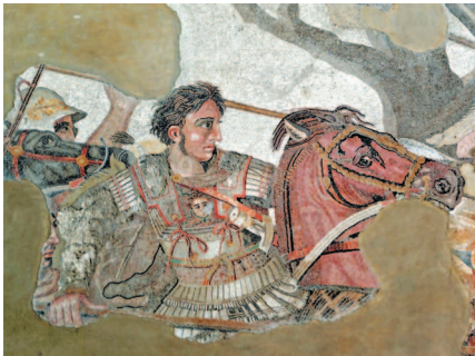
Фрагмент древнеримской мозаики из Помпеи. Александр Македонский (Александр III Великий; 356 г. до н.э. – 323 г. до н.э.) – выдающийся полководец, создатель мировой державы, распавшей после его смерти