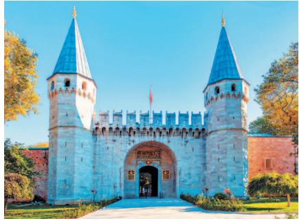
Вход во дворец Топкапы охраняют две башни

Попасть во дворец можно, пройдя через 2 парк Гюльхане. Gulkhāna в переводе с персидского означает «дом роз». Такое название парк получил не случайно: изначально он представлял собой розарий дворца Топкапы. В конце парка высится 3 Готская триумфальная колонна, воздвигнутая еще в III в. в честь победы римских императоров над готами, о чем свидетельствует надпись: «С победой над готами фортуна вновь повернулась к нам». Это древнейший памятник римской архитектуры в городе, дошедший до наших дней. Главная аллея парка ведет на севере к смотровой площадке, откуда открывается великолепный вид на оживленное пространство бухты Золотой Рог, навстречу Босфору. В западной оконечности парка в бывших конюшнях дворца расположился Стамбульский исторический музей исламской науки и техники, открытый в 2008 г. турецким премьер-министром Эрдоганом.