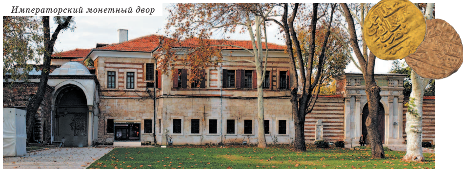
Императорский монетный двор

Нынешнее здание храма Св. Ирины датируется VI в., но ученые выяснили, что ему предшествовало как минимум три строения. Первая христианская базилика была возведена на этом месте на руинах древнего храма Афродиты при римском императоре Константине в IV в. Примечательно, что церковь на протяжении всей своей истории никогда не превращалась в мечеть, поэтому в ней сохранились и атриум (просторное высокое помещение при входе в церковь),