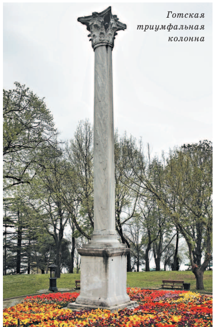
Готская триумфальная колонна