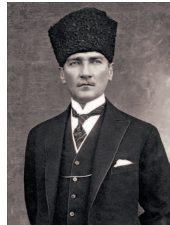
Мустафа Кемаль Ата-турк; Гази Мустафа Кемаль-паша; (1881–1938) – основатель современного турецкого государства

Рим тоже не заставил себя долго ждать. Уже во II в. до н.э. войска Римской республики отправились на завоевания восточных земель. По мере своего продвижения римская цивилизация насаждала свои представления об архитектуре, гигиене, дорогах и праве. Сегодня мы можем наблюдать многие из сохранившихся архитектурных памятников того периода по всей Турции.