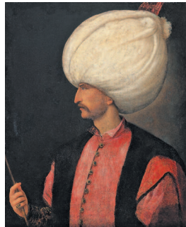
Портрет Сулеймана I Великолепного (Кануни; 1494–1566) – десятый султан Османской империи, и 89-й халиф