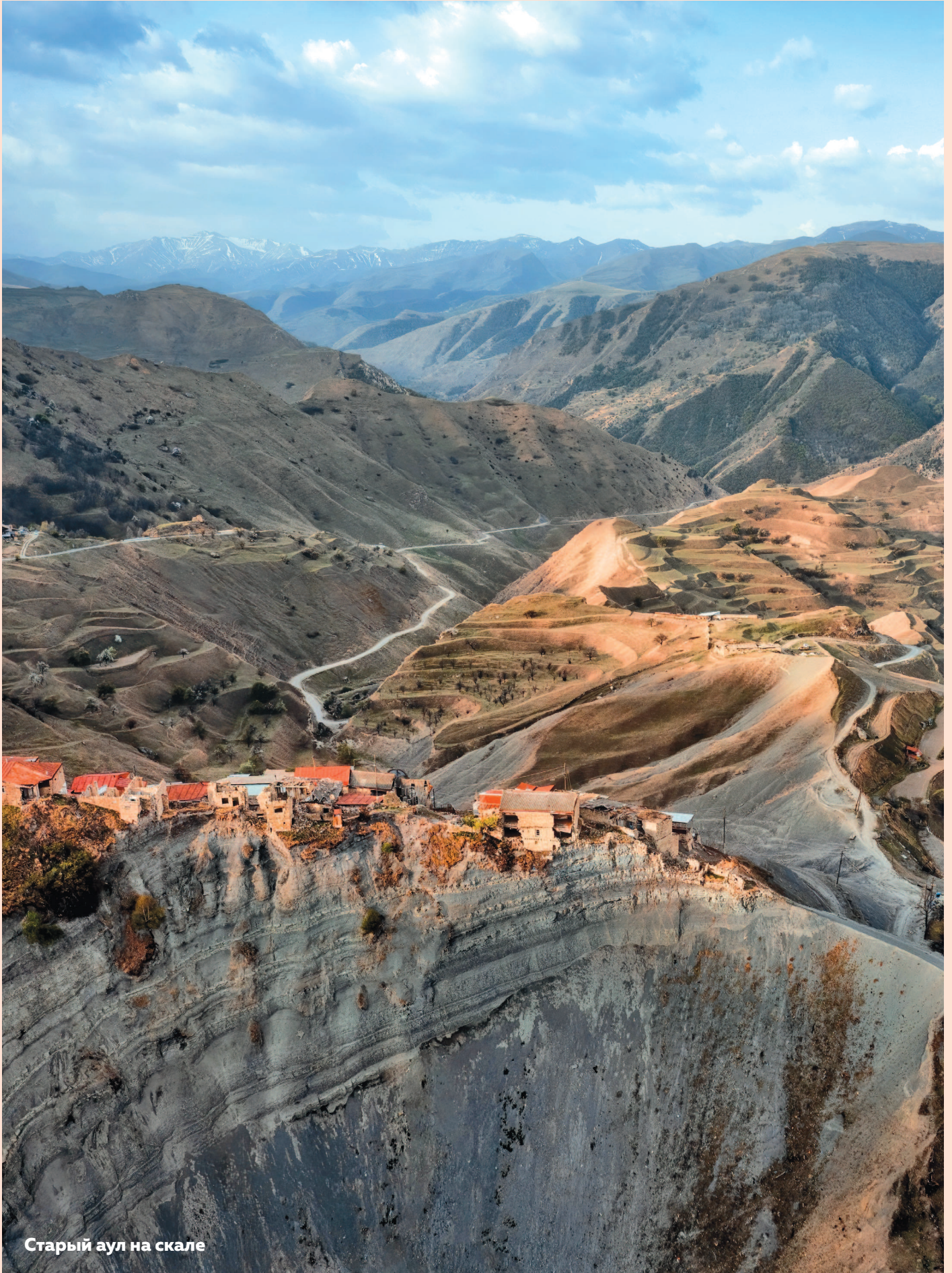
Старый аул на скале