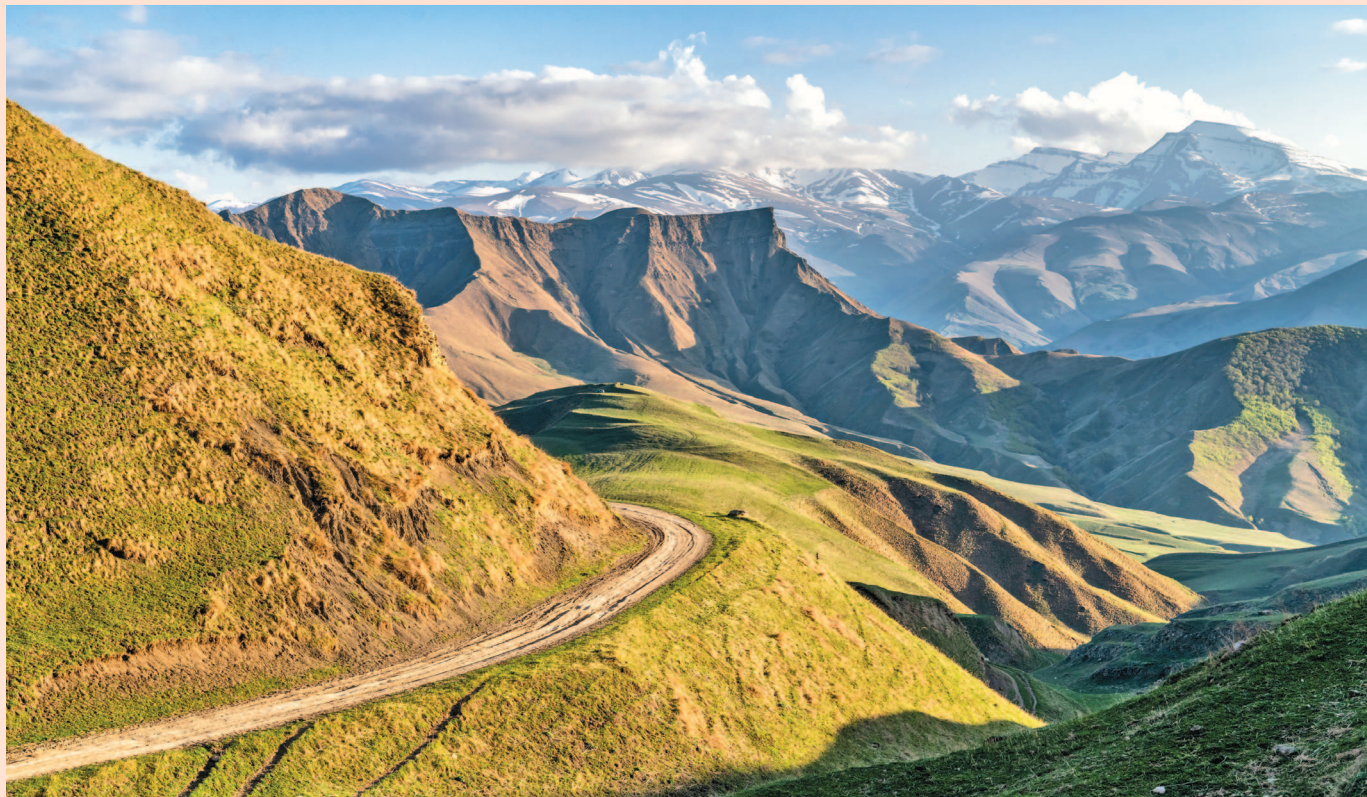
Извилистый путь в горах Дагестана

трубы, по которым в город поступает вода из горных источников, он приказал зарезать несколько быков и спустить их кровь в водопровод. Вода в городских цистернах быстро загнила, и крепость пала. В завоеванный Дербент Маслама переселил около 20 тысяч арабов из сирийских городов. Так вместе с переселенцами и арабскими воинами на Северный Кавказ пришла новая религия — ислам.