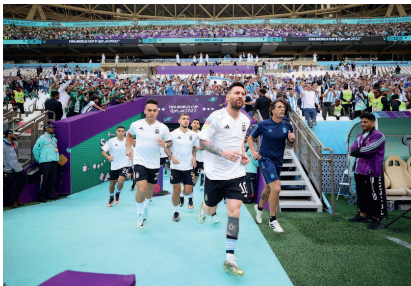
«В ЛЕО ВСЕЛИЛАСЬ ДУША МАРАДОНЫ»