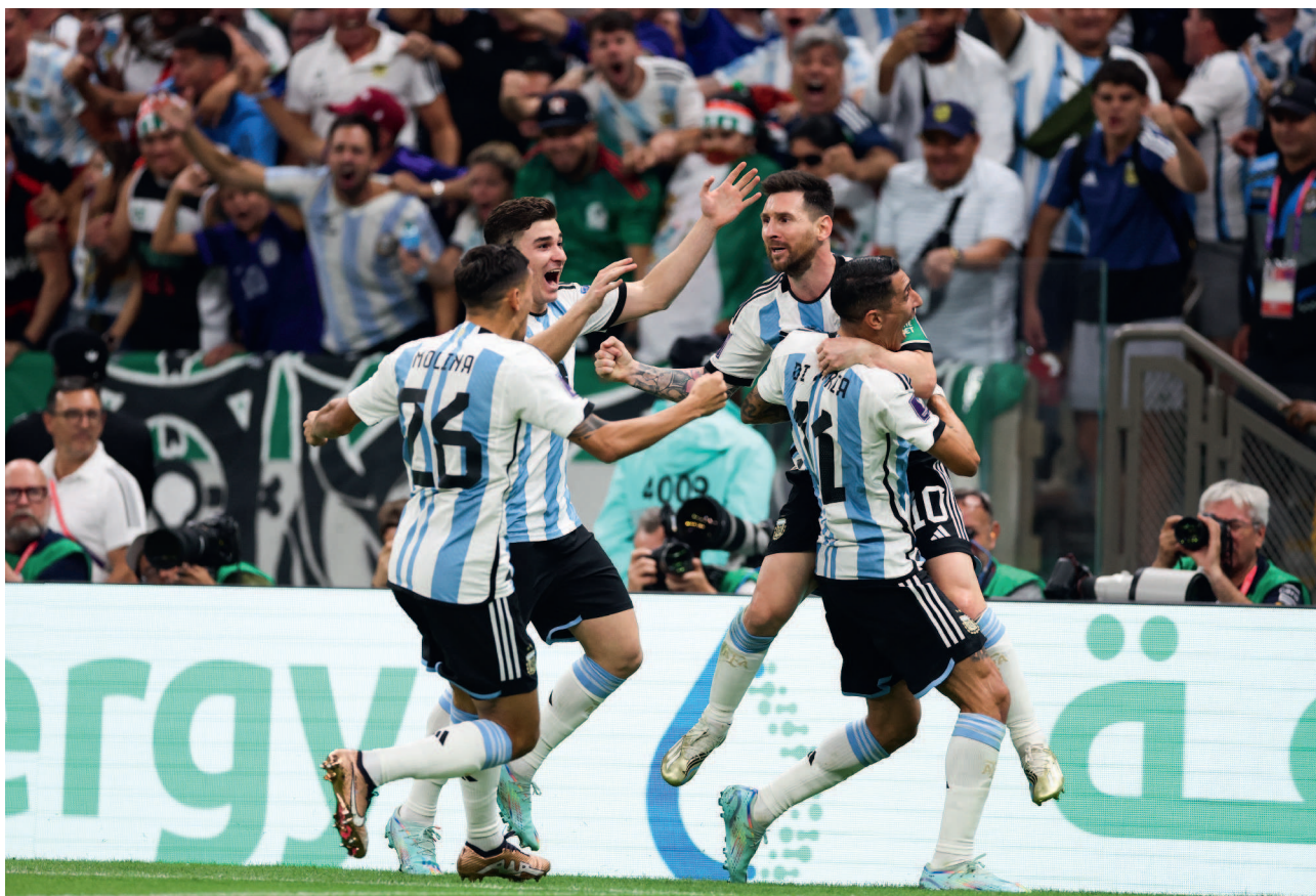
«В ЛЕО ВСЕЛИЛАСЬ ДУША МАРАДОНЫ»